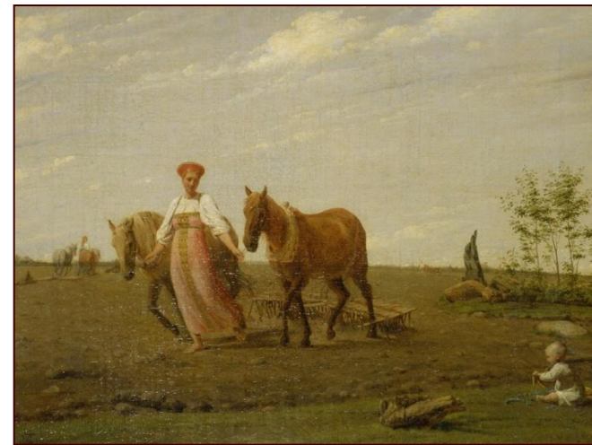
А Венецианов. Весна. На пашне. 1827г.