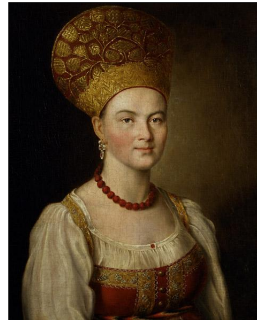
И.П. Аргунов. Портрет неизвестной в русском костюме 1784г.