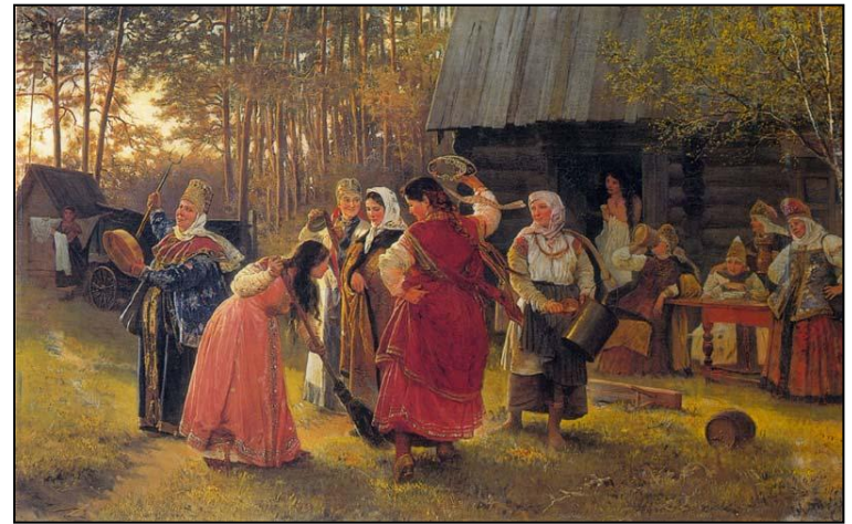
А.Корзухин Девичник. 1889г.