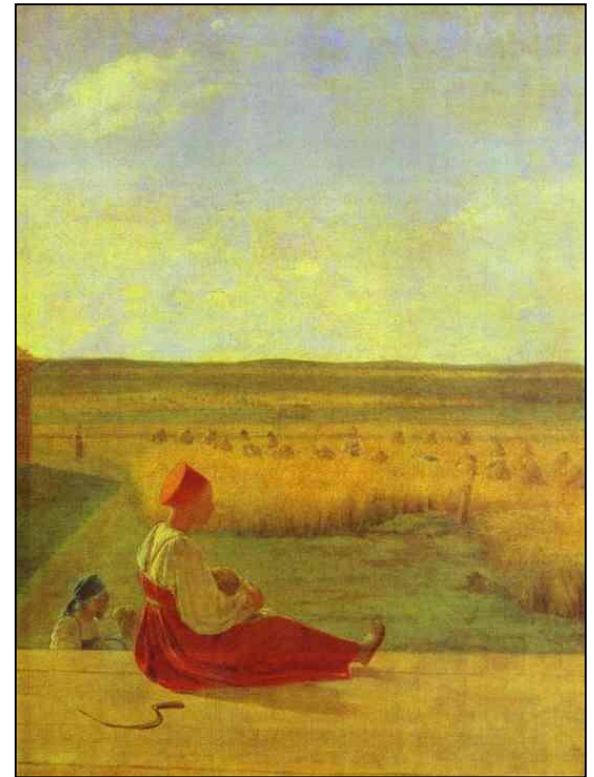
А.Венецианов. Жатва. Лето.

Как вы думаете, пошла бы женщина в своем единственном праздничном костюме на поле?