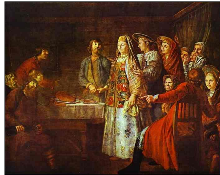
М. Шибанов. Брачный договор. 1777г.