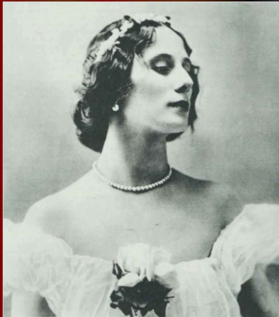
Анна Павлова – Великая русская балерина