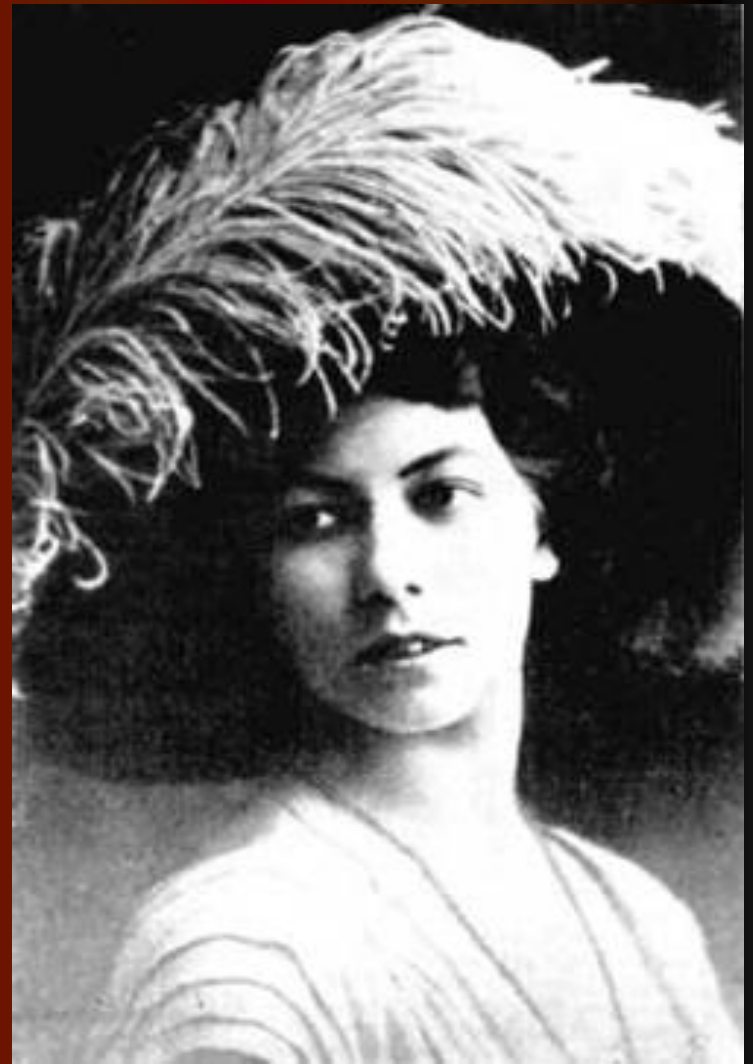
Бронислава Нижинская (1891-1972)