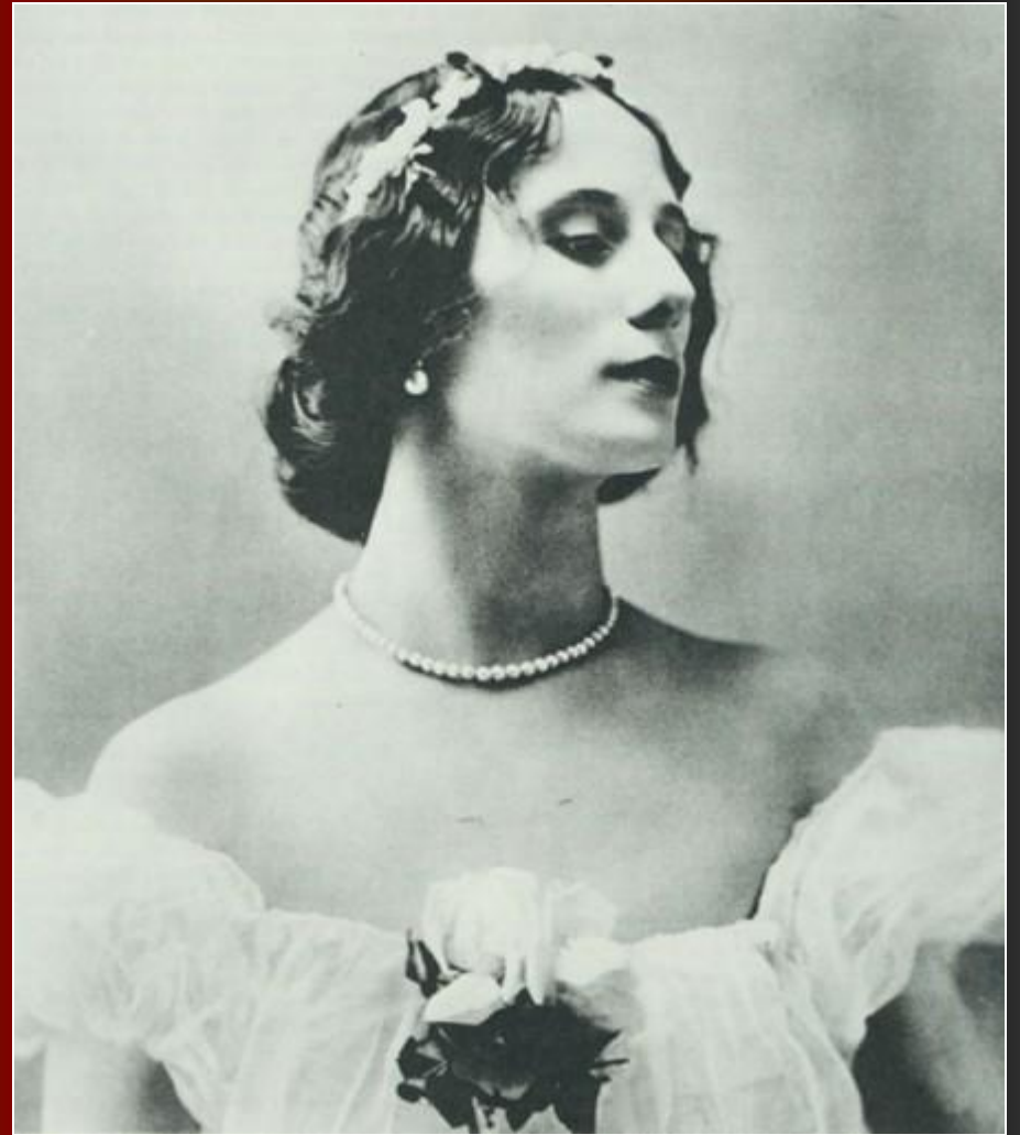
Анна Павлова – Великая русская балерина