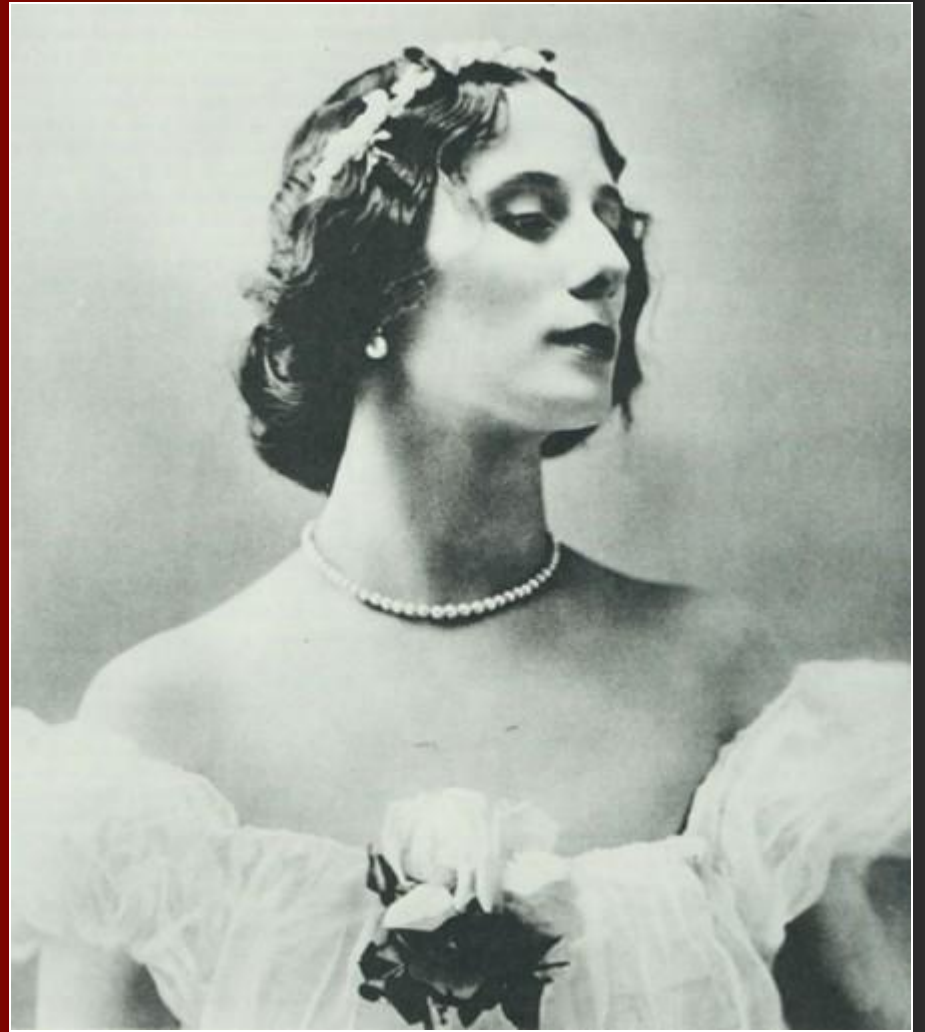
Анна Павлова – Великая русская балерина