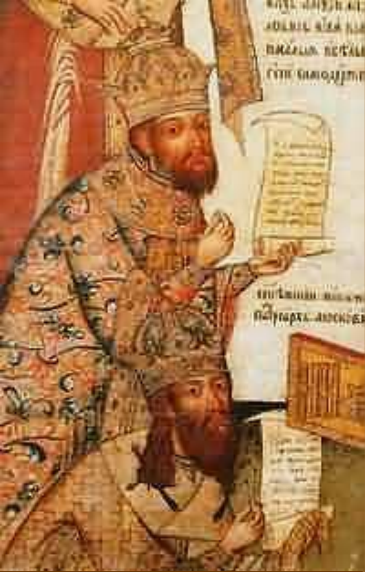
«Патриарх Никон и Алексей Михайлович»

Годы патриаршества Никона были временем искренней и тесной дружбы царя и патриарха. Первые годы патриарх Никон и царь Алексей Михайлович сообща решали все важнейшие дела как церковной, так и государственной жизни. Царь непременно участвовал во всех Соборах Церкви, а Патриарх – в Боярской думе. В 1654 году, отправляясь в поход на войну с Польшей, царь оставляет вместо себя Патриарха Никона, а, вернувшись с войны, царь жалует Патриарха титулом «великий государь». Тем не менее, между Патриархом и Алексеем Михайловичем существовало очень чёткое разделение ответственностей и обязанностей.