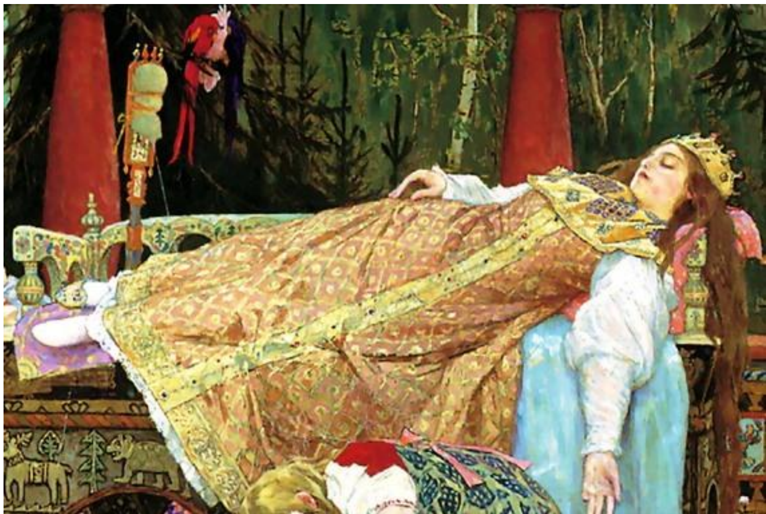
В.Васнецов «Спящая царевна»