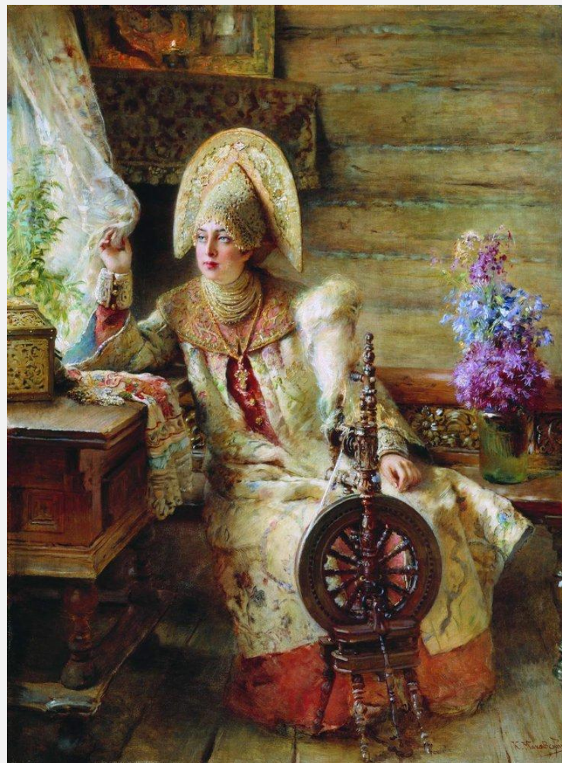
Боярыня у окна с прялкой