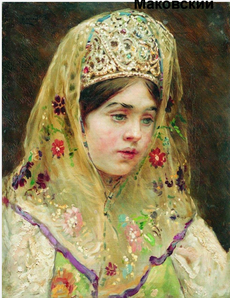
Девушка в русском костюме