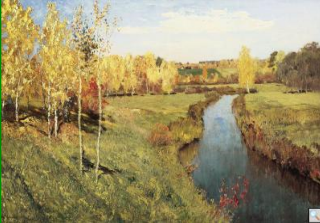
Левитан И.И. «Золотая осень»