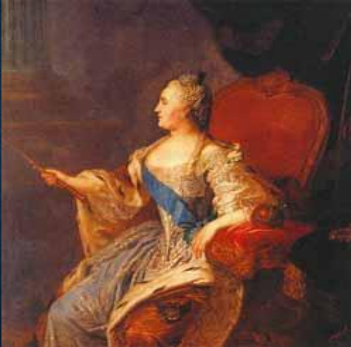
Рокотов. Екатерина II. «писан» в 1763 году, месяц май 20 дня.