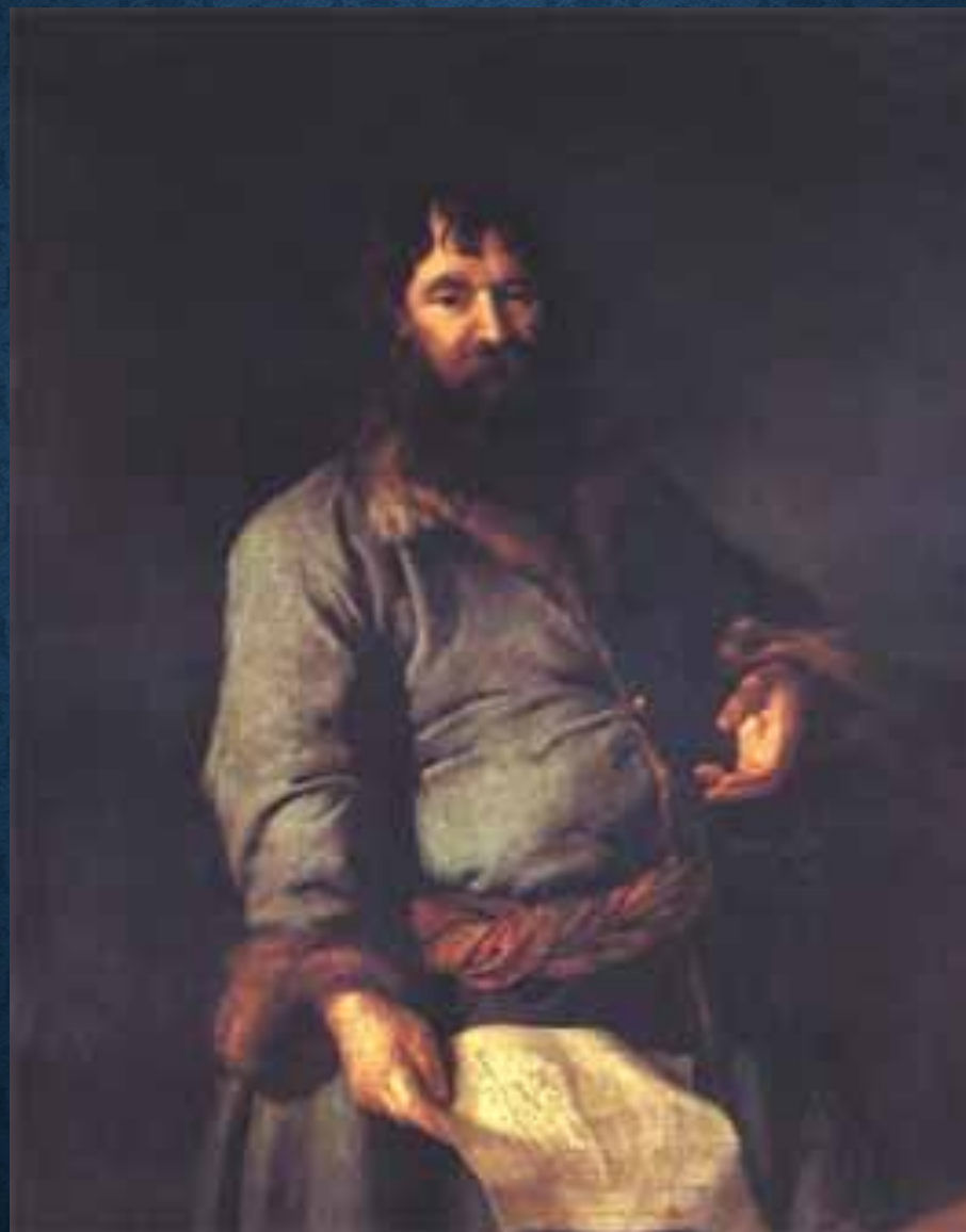
"Портрет Н.А.Сеземова" (1770), Левицкий