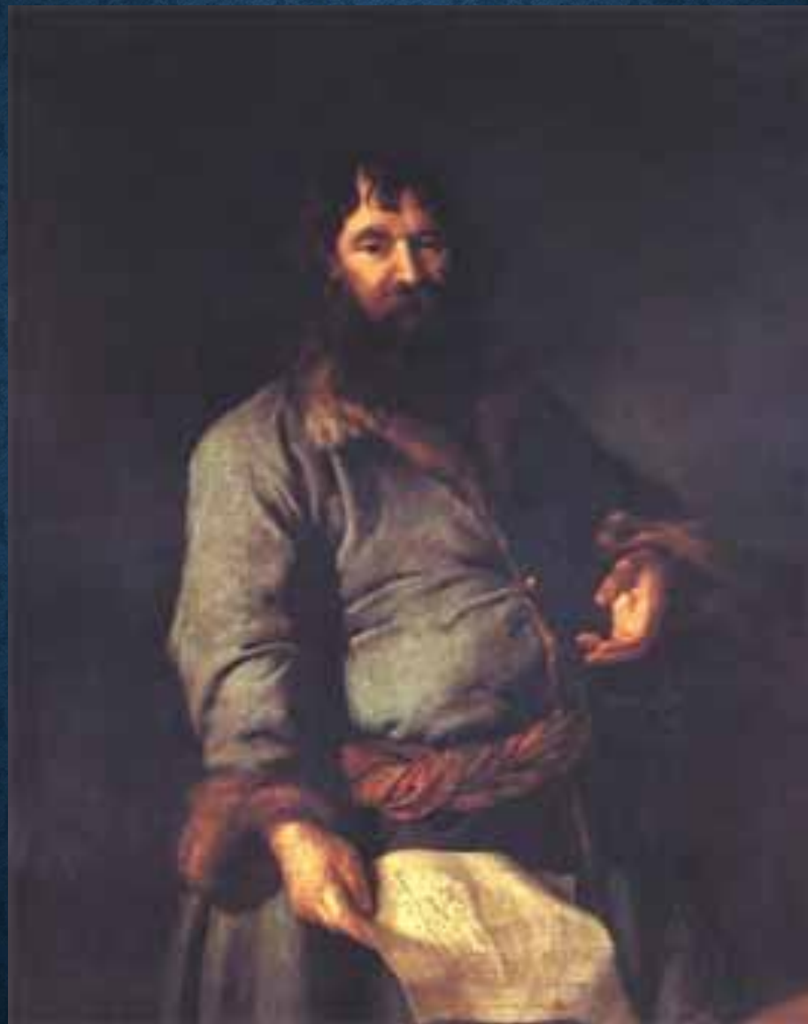
"Портрет Н.А.Сеземова" (1770), Левицкий