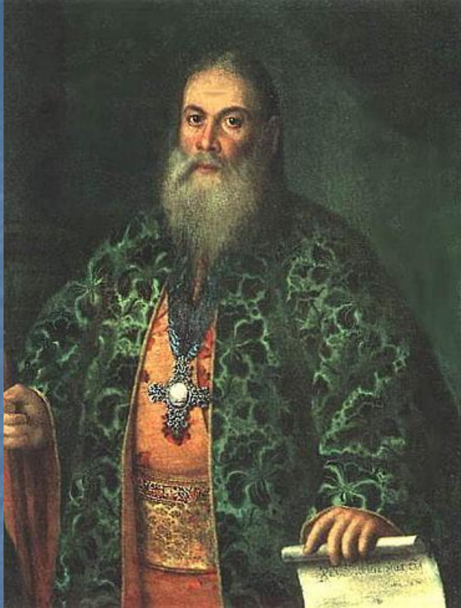
А.П. Антропов, портрет протоиер. Ф. Я Дубянского, духовника Елизаветы, а потом и Екатерины,