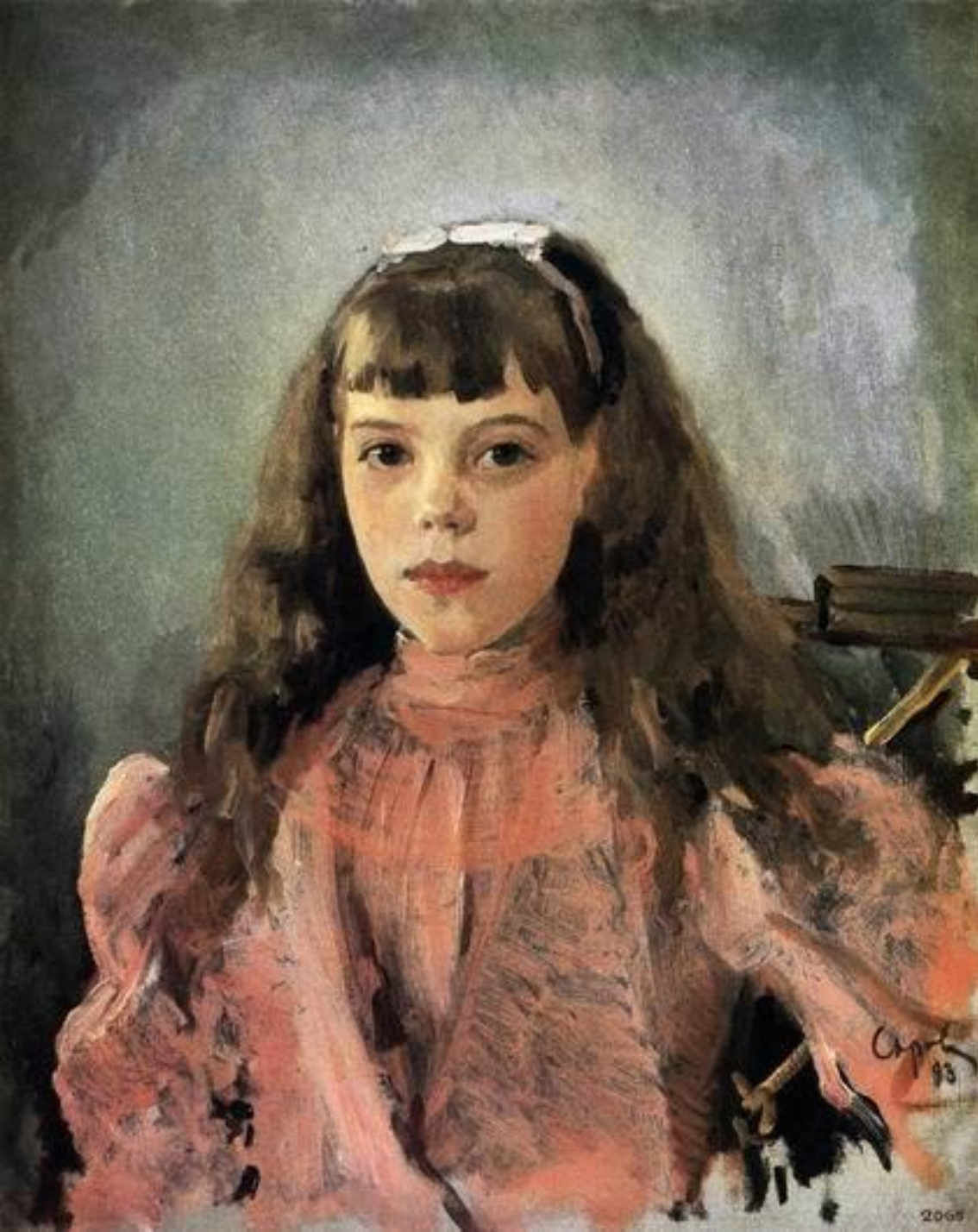
В. Серов. Портрет великой княжны Ольги Александровны