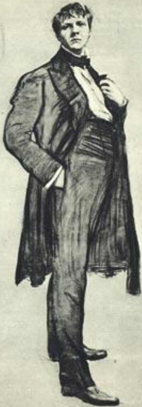
В. Серов. Портрет Ф.И. Шаляпина