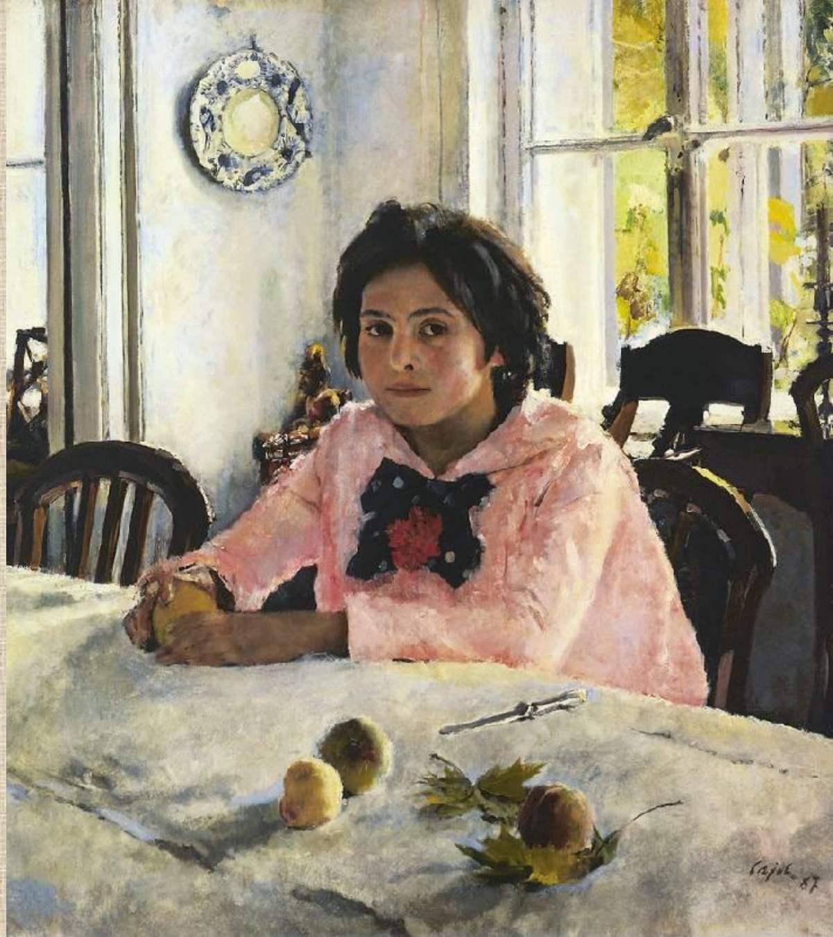
В. Серов. Девочка с

Формат холста близок квадрату; самое темное пятно - бант с цветком - отмечает геометрический центр квадрата, так что гвоздика буквально пригвозждает фигуру к самой неподвижной точке изобразительного поля; фигура "прислонена" к вертикали, точно обозначающей середину от правой кромки холста до вертикали дверного проема. Далее можно отметить, как приближены к правильным прямым линии, очерчивающие силуэт розовой блузы, - фигура вписана в треугольник, устойчиво поставленный на прямую линию, обозначенную положенной на стол рукой, а эта линия строго параллельна горизонтали обрамления. Хитроумие мастера состояло в том, что это сопряжение противоположного произведено незаметно, образует гармоничное согласие: все обдуманное, сочиненное служит тому, чтобы создать иллюзию естественного распорядка жизни. Но соединенным как раз и оказалось абсолютно противоположное: прелесть преходящего мгновения со всеми признаками этой мгновенности (включая саму юность) - и непреходящая, существующая вне времени "эстетика числа", абстракция математического расчета. Тем самым художник осуществил мечту и главный