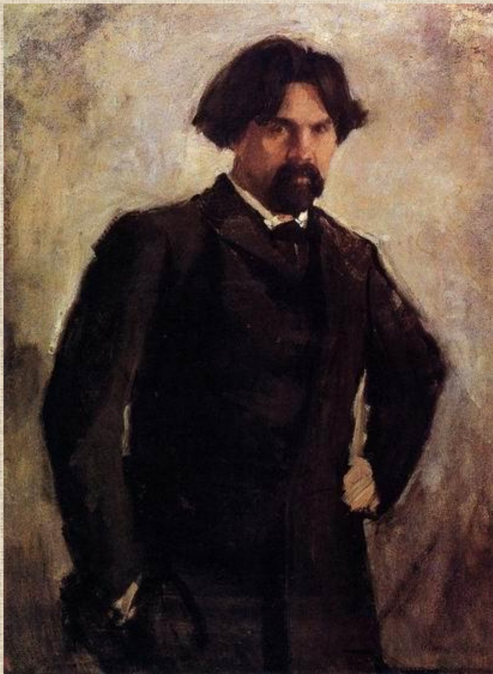
В. Серов. Портрет художника Сурикова