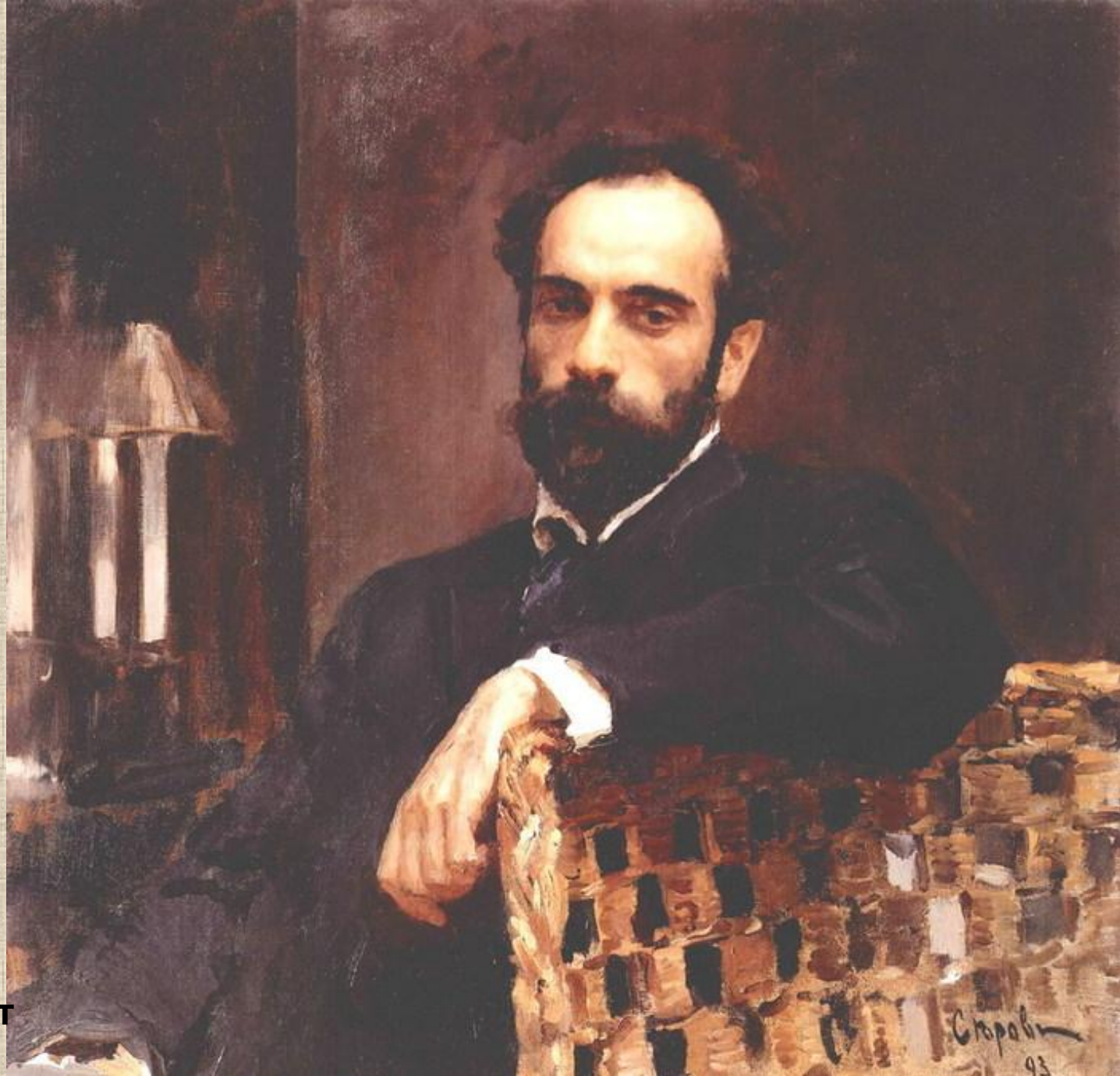
В. Серов. Портрет И. Левитана

Собранность позы, углубленные, пытливый взгляд, значительность жеста – во всем этом раскрывается сила и глубина духовной жизни портретируемого — вот что привлекало мастера в облике И.И. Левитана