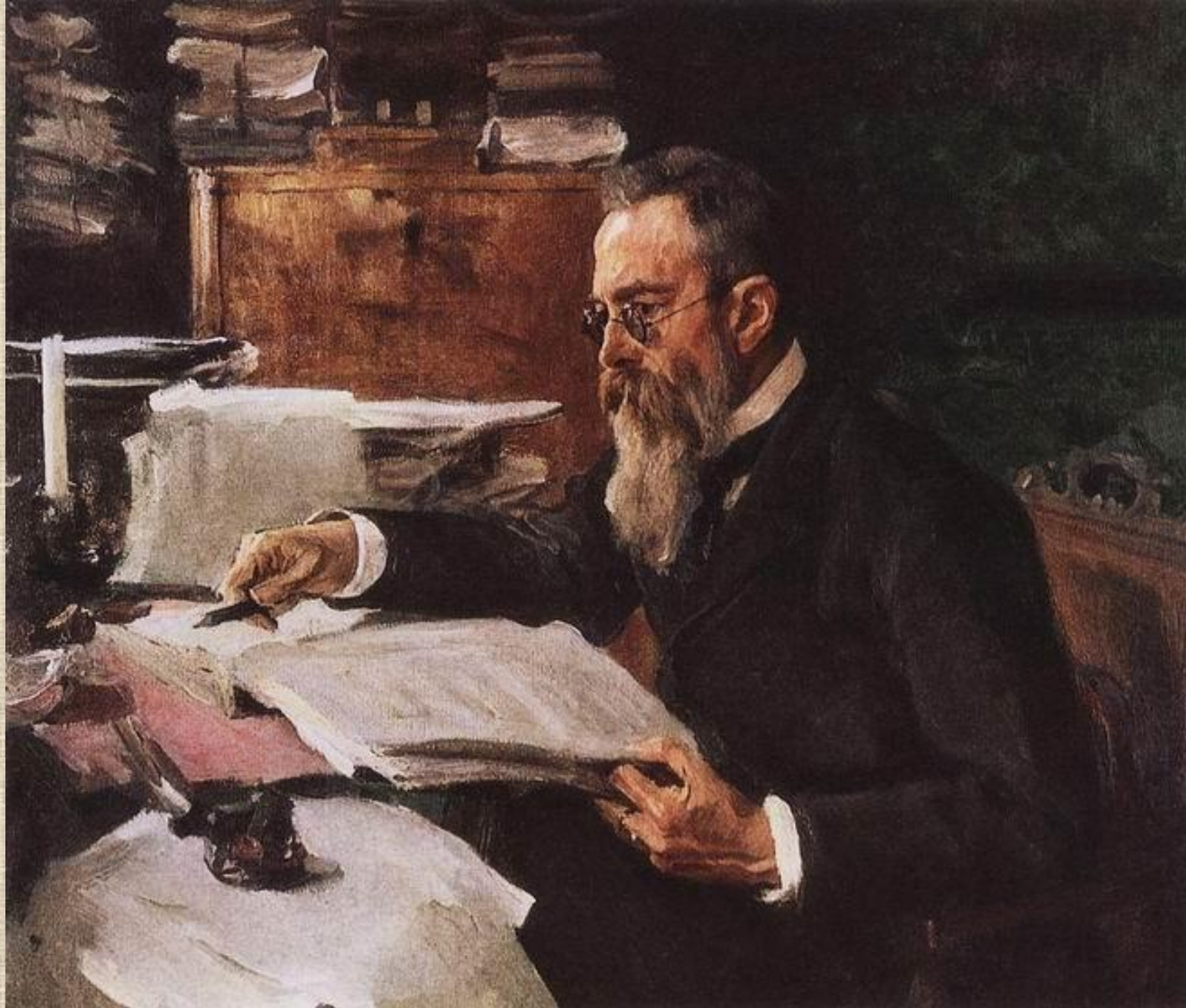
В. Серов. Композитор Н. А. Римский-Корсаков. Портрет