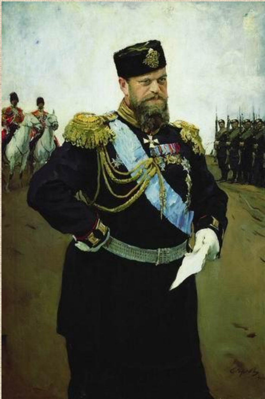
Валентин Серов. Портрет Александра III с рапортом в руках.