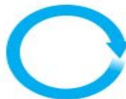
«круг»; «коло»; «колесо» — Смоленская обл. «шина» — Архангельская обл.