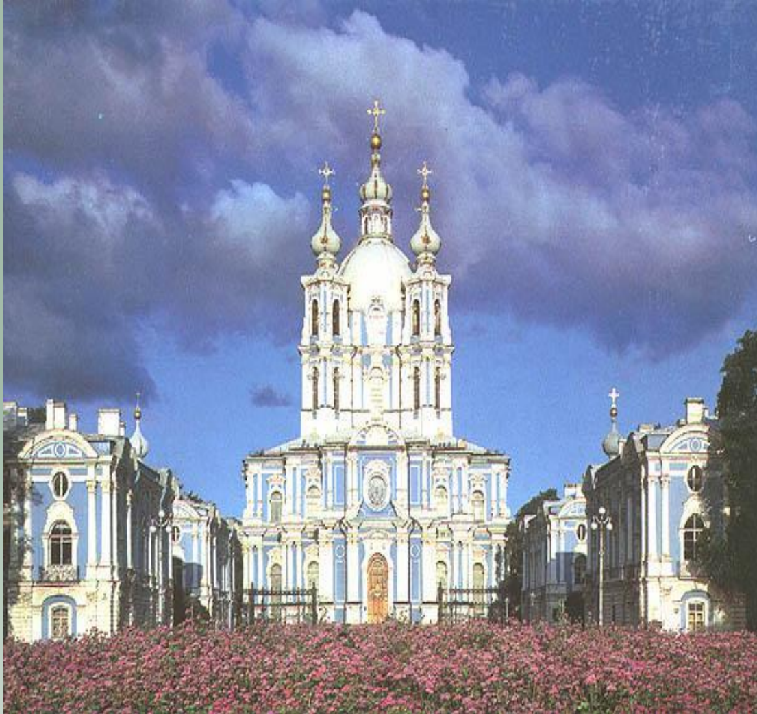
Смольный (Воскресенский Новодевичий) монастырь (1748-1764), арх. Ф. Растрелли