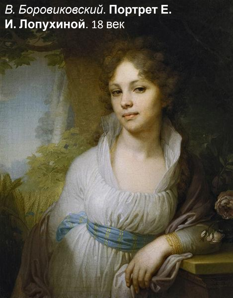
В. Боровиковский. Портрет Е. И. Лопухиной. 18 век