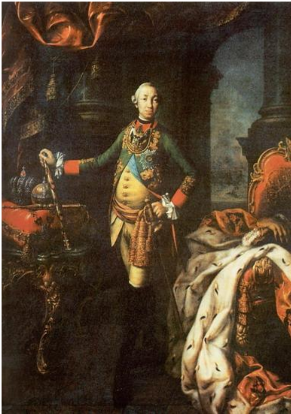
А. П. Антропов. Портрет Петра III 1762 г.