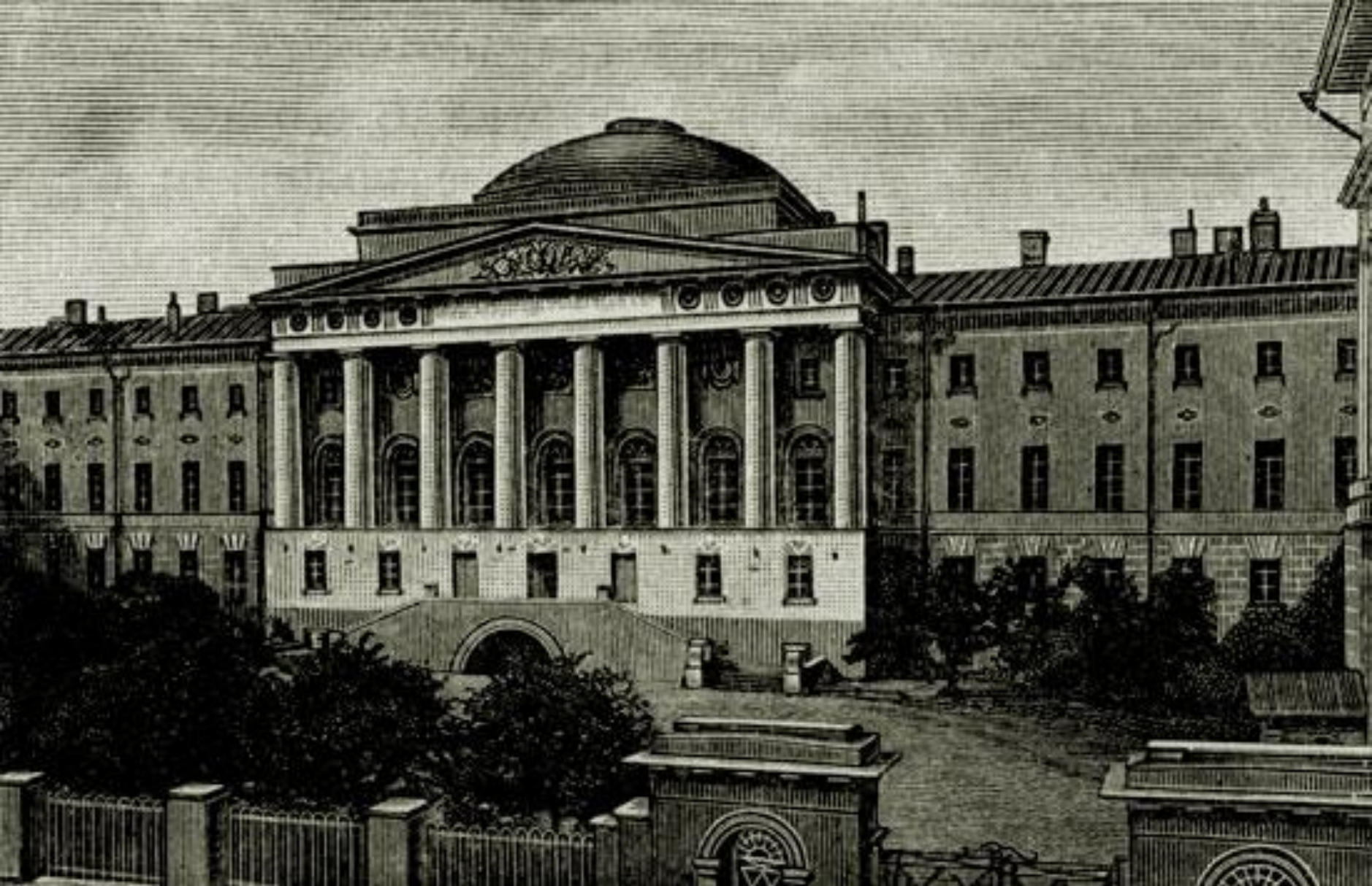
М. Казаков. Московский университет. 18 век