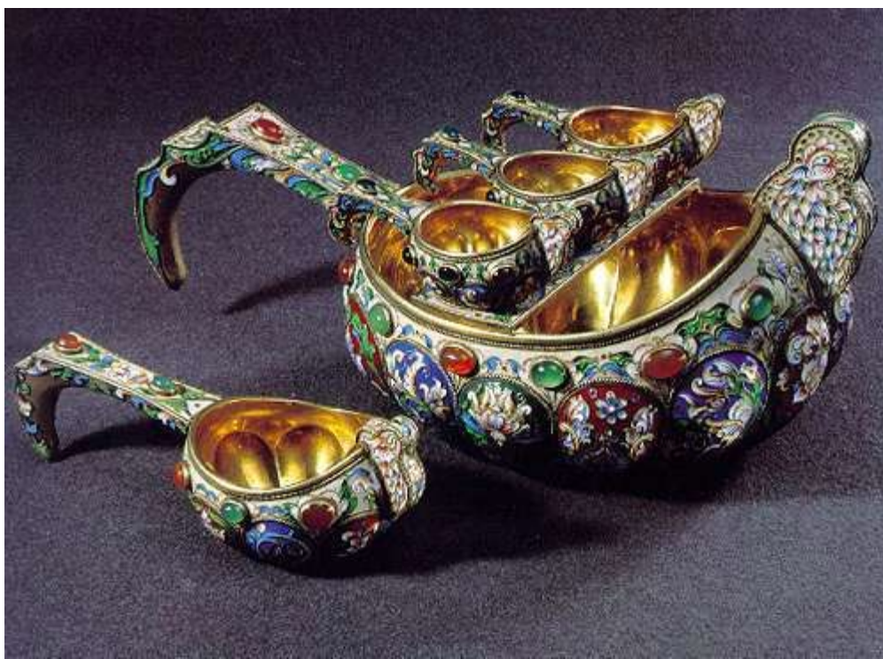
Чернь, зернь, эмаль, скань