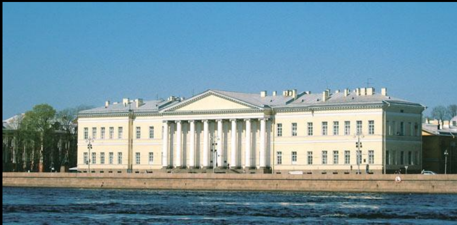
Дж. Кваренги. Здание Академии наук. 1783–1785. Санкт-Петербург