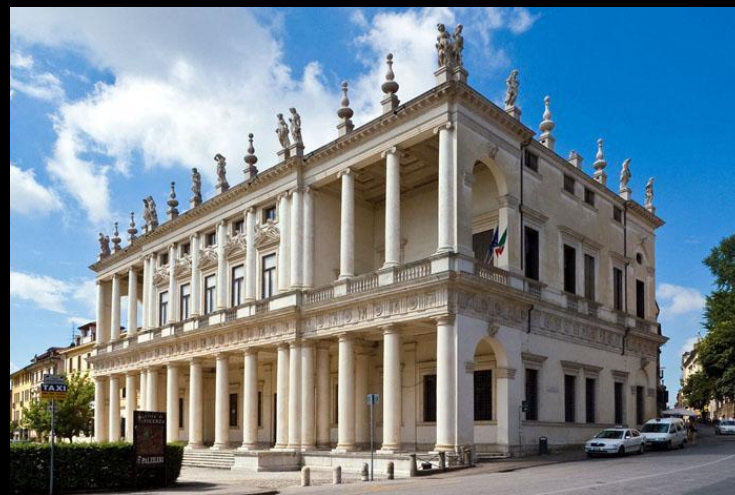
А. Палладио. Вилла Кьерикати