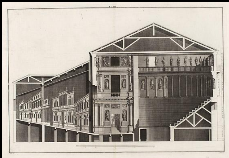
А. Палладио. Театр «Олимпико». Разрез. Виченце