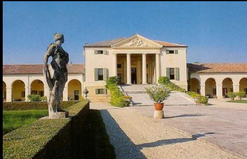
А. Палладио Вилла Эмо