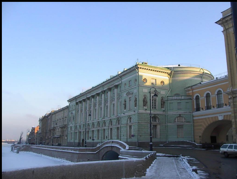
Дж. Кваренги. Эрмитажный театр. 1783–1787. Санкт-Петербург