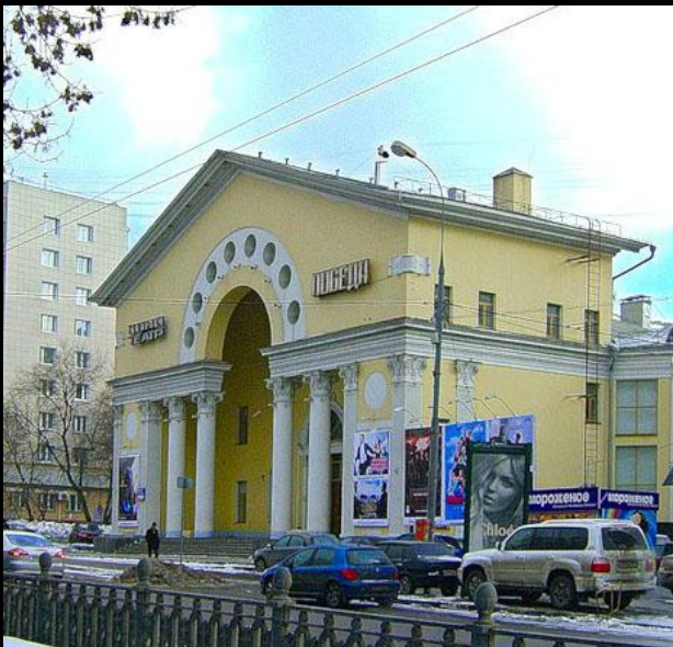
И. Жолтовский. Кинотеатр «Победа». 1957. Москва