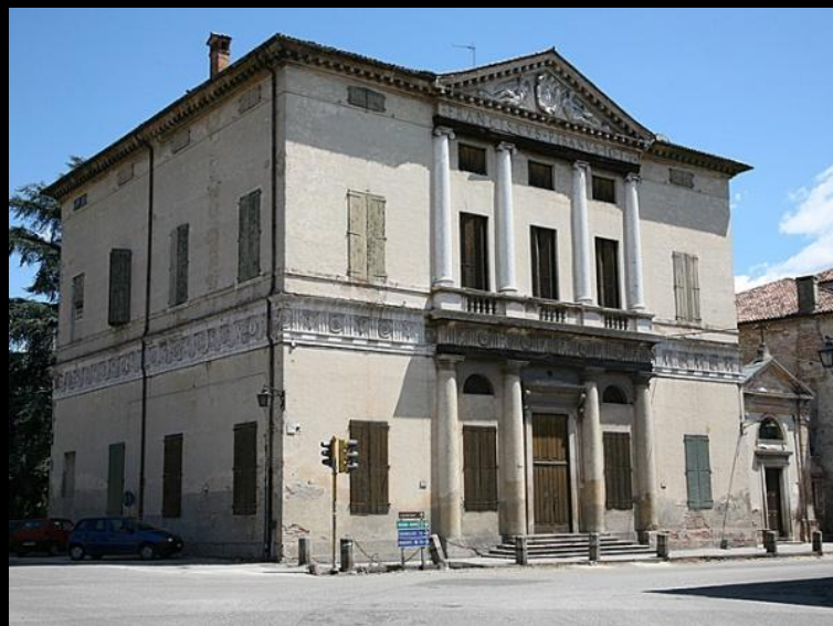
А. Палладио. Вилла Пизани