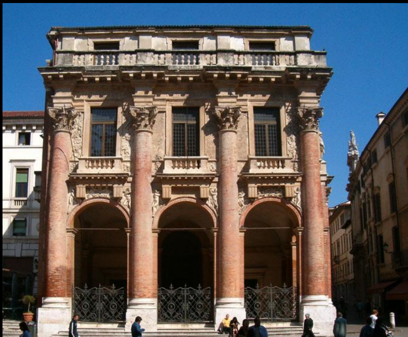
А. Палладио Лоджия дель Капитанио