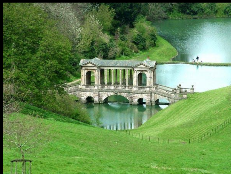
Дж. Вуд Старший. Мост в парке города Бат. 1735–1748