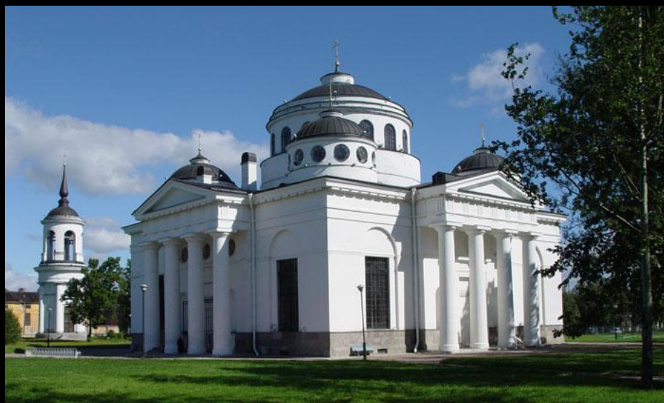
Ч. Камерон. Воскресенский собор в Царском Селе. 1782–1788