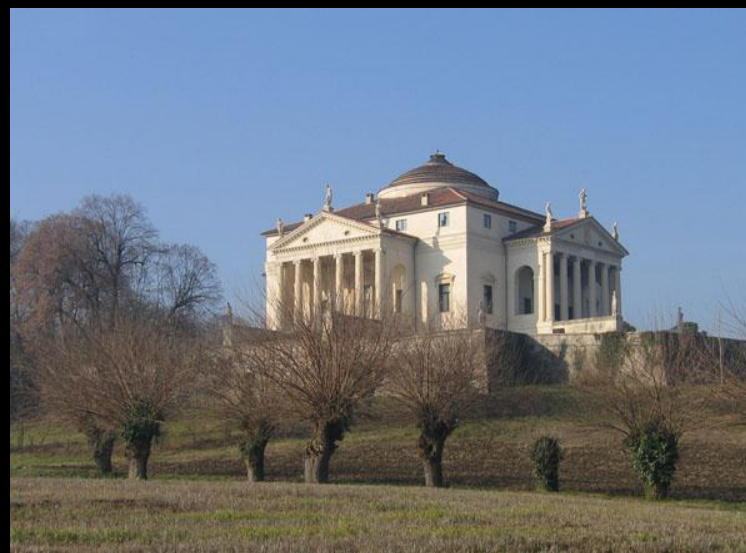
А. Палладио. Вилла Ротонда