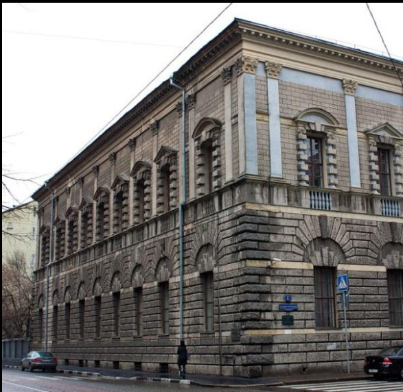
И. Жолтовский. Дом Тарасова на Спиридоновке 1908–1912. Москва