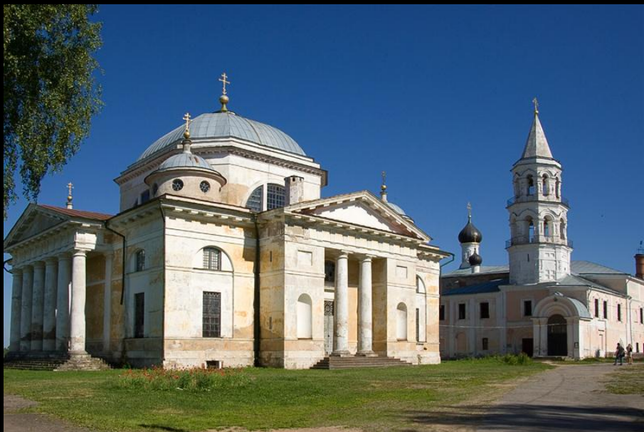
Н. Львов. Собор Бориса и Глеба в Торжке. 1785–1796