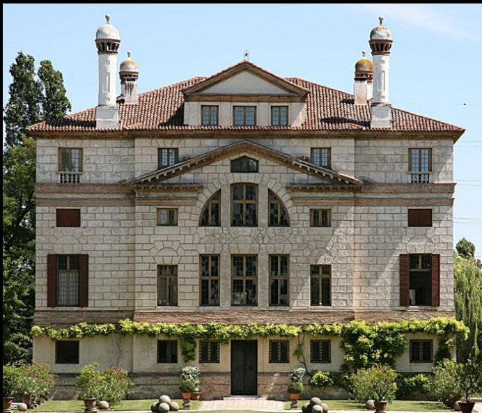
А. Палладио. Вилла Фоскари