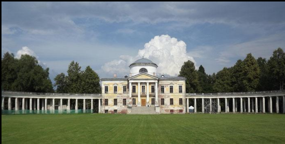
Н. Львов. Усадьба Знаменское-Раек. Вторая половина XVIII в.