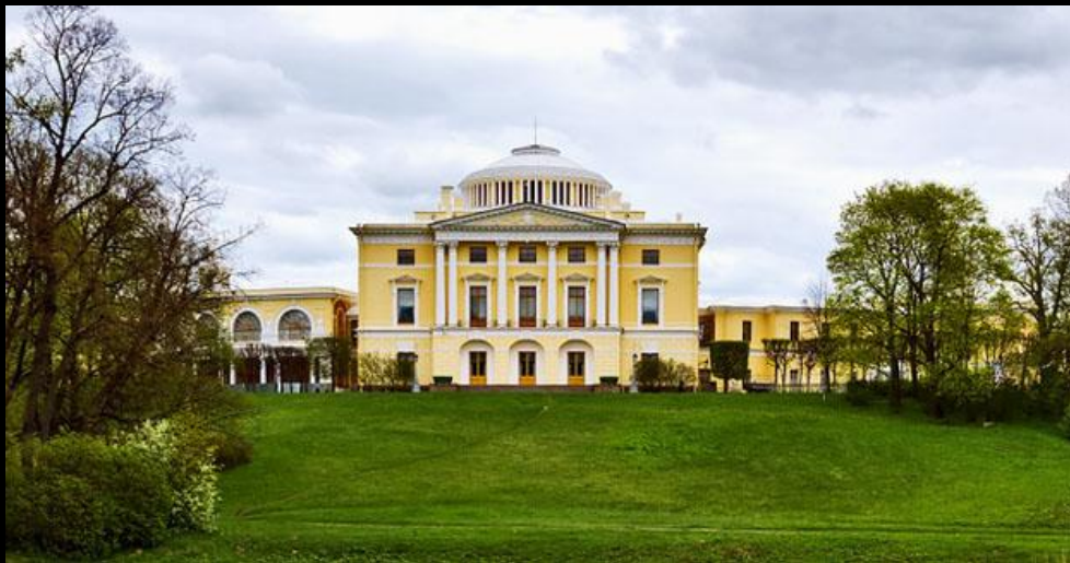
Ч. Камерон. Дворец в Павловске. 1782