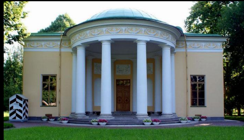
Дж. Кваренги. Концертный зал в Царском Селе. 1782–1788