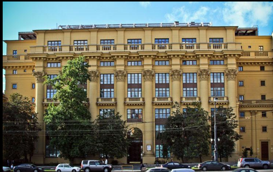
И. Жолтовский. Дом на Моховой. 1934. Москва