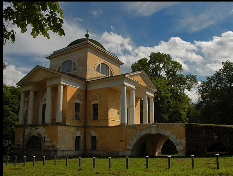
Н. Львов. Покровская церковь в Прямухине. 1808–1826