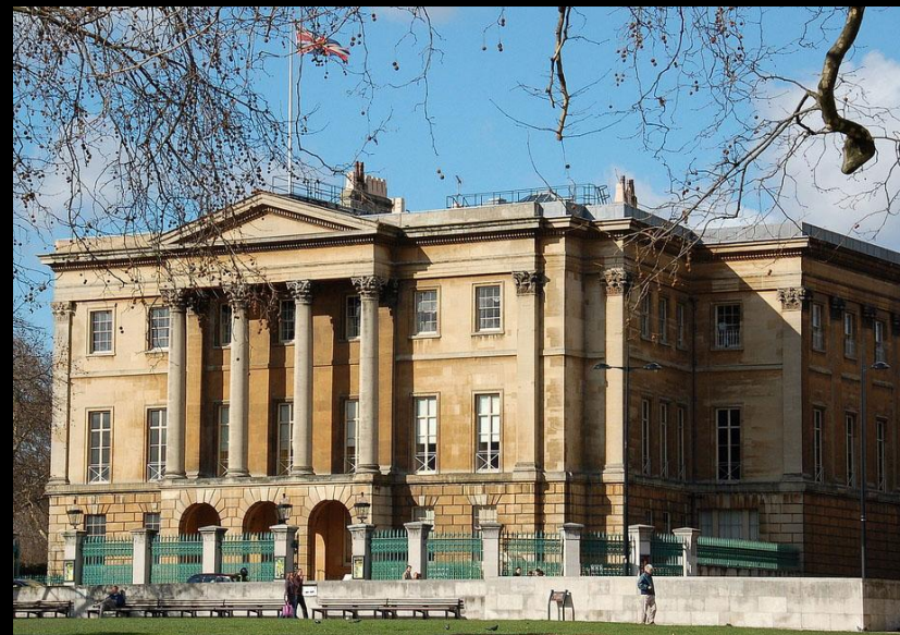
Р. Адам. Дом Эпслей в Лондоне. 1771–1778