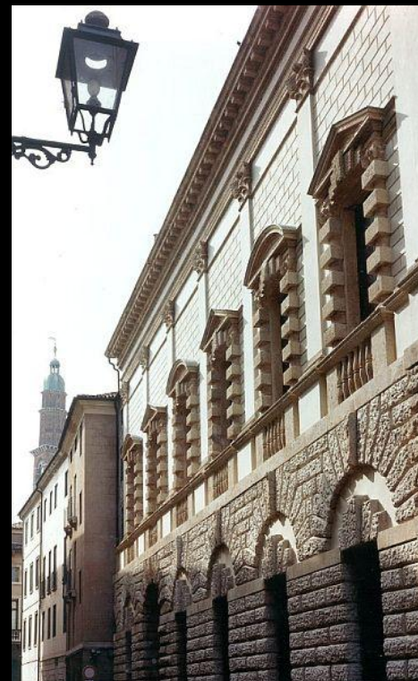
А. Палладио Палаццо Тьене