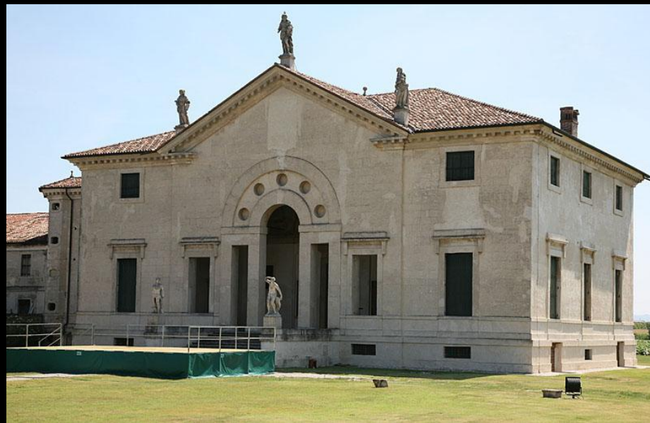
А. Палладио. Вилла Пояна (Poiana)