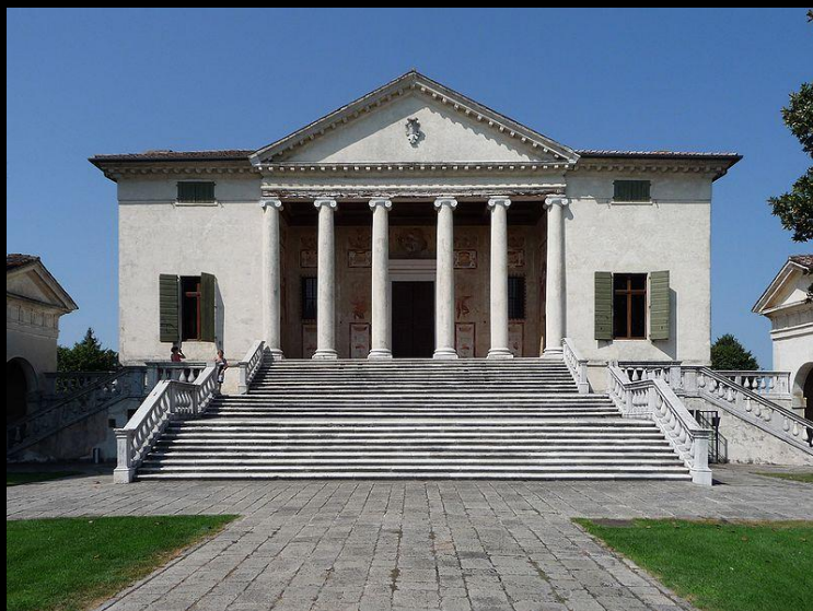
А. Палладио. Вилла Бадоэр