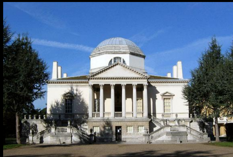
Л. Берлингтон, У. Кент. Чизвик-хаус. 1720-е. Лондон