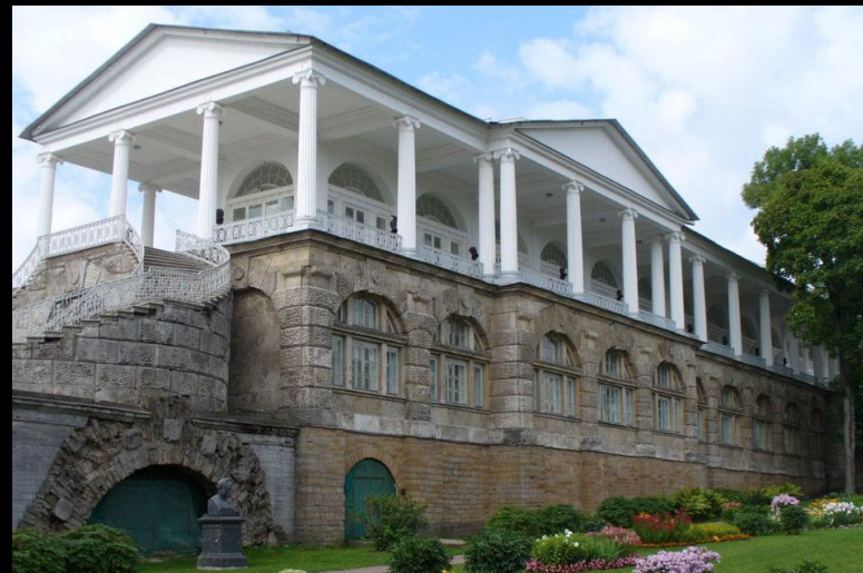
Ч. Камерон. Галерея в Царском Селе. 1783–1787