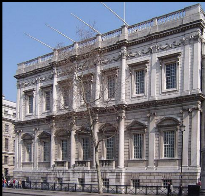
И. Джонс. Дом банкетов 1619–1622. Лондон