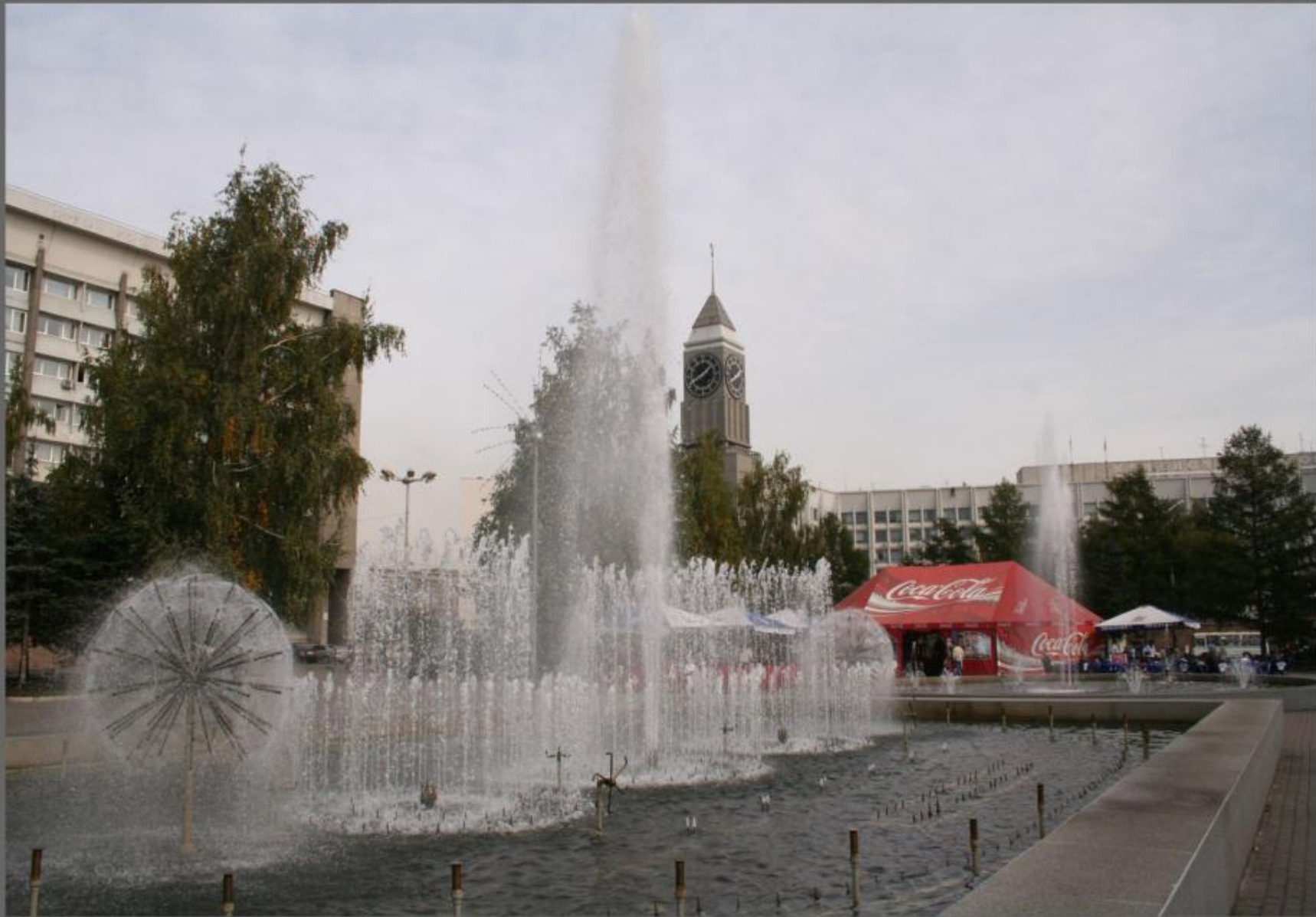
Фонтан на площади перед Театром Оперы и Балета.