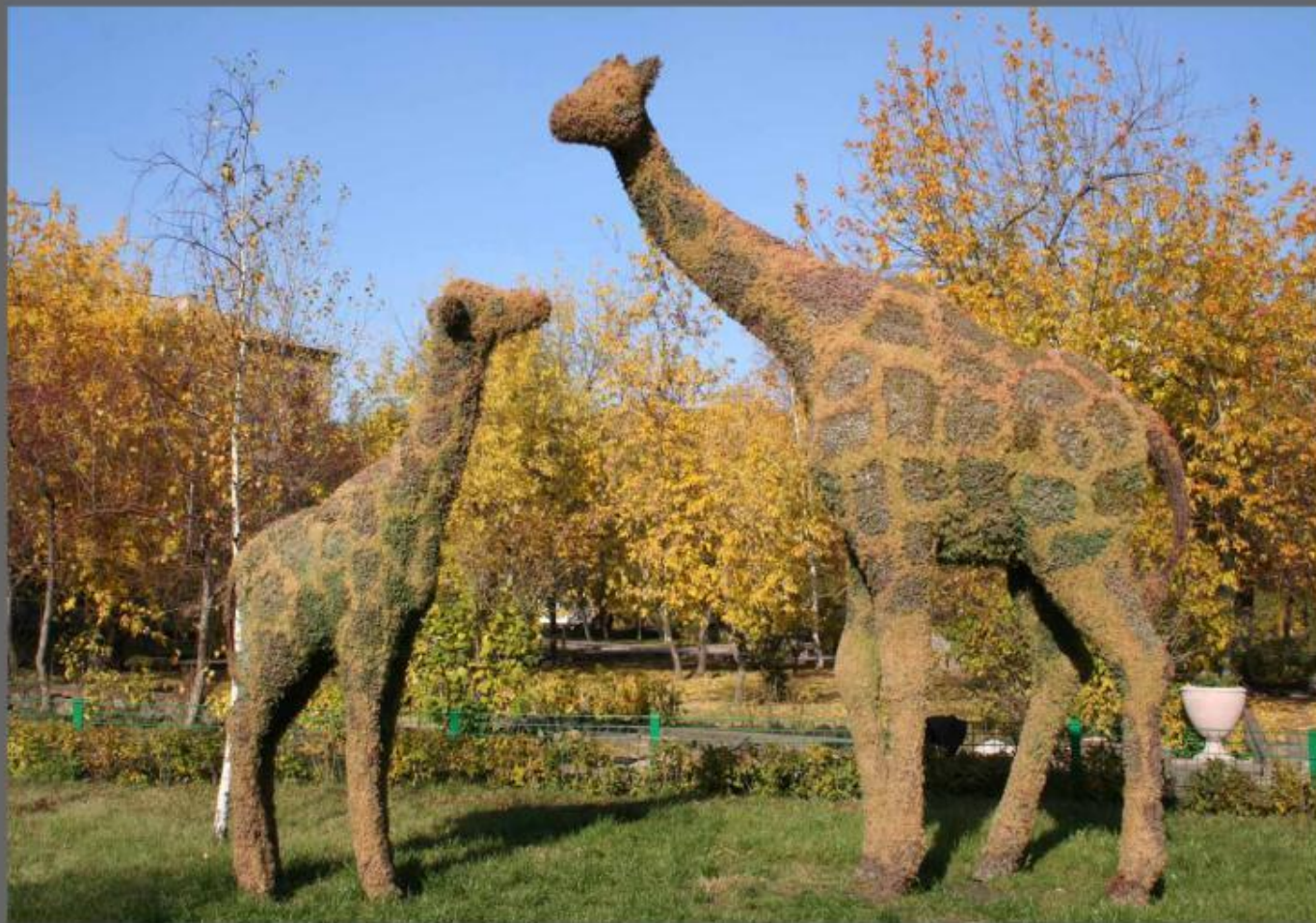
Из Серии: Осенние Зарисовки. Ул. Ленина.