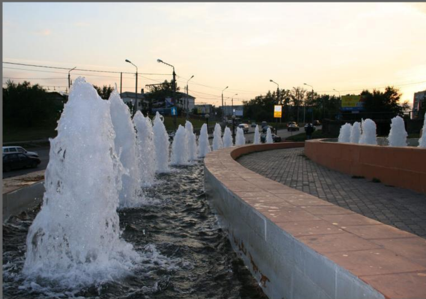
Фонтаны На ул.Копылова.

Большое декоративное значение имеют и фонтаны на улицах города, которые не только украшают, но и освежают горожан в жаркие летние дни, становятся излюбленным местом отдыха.