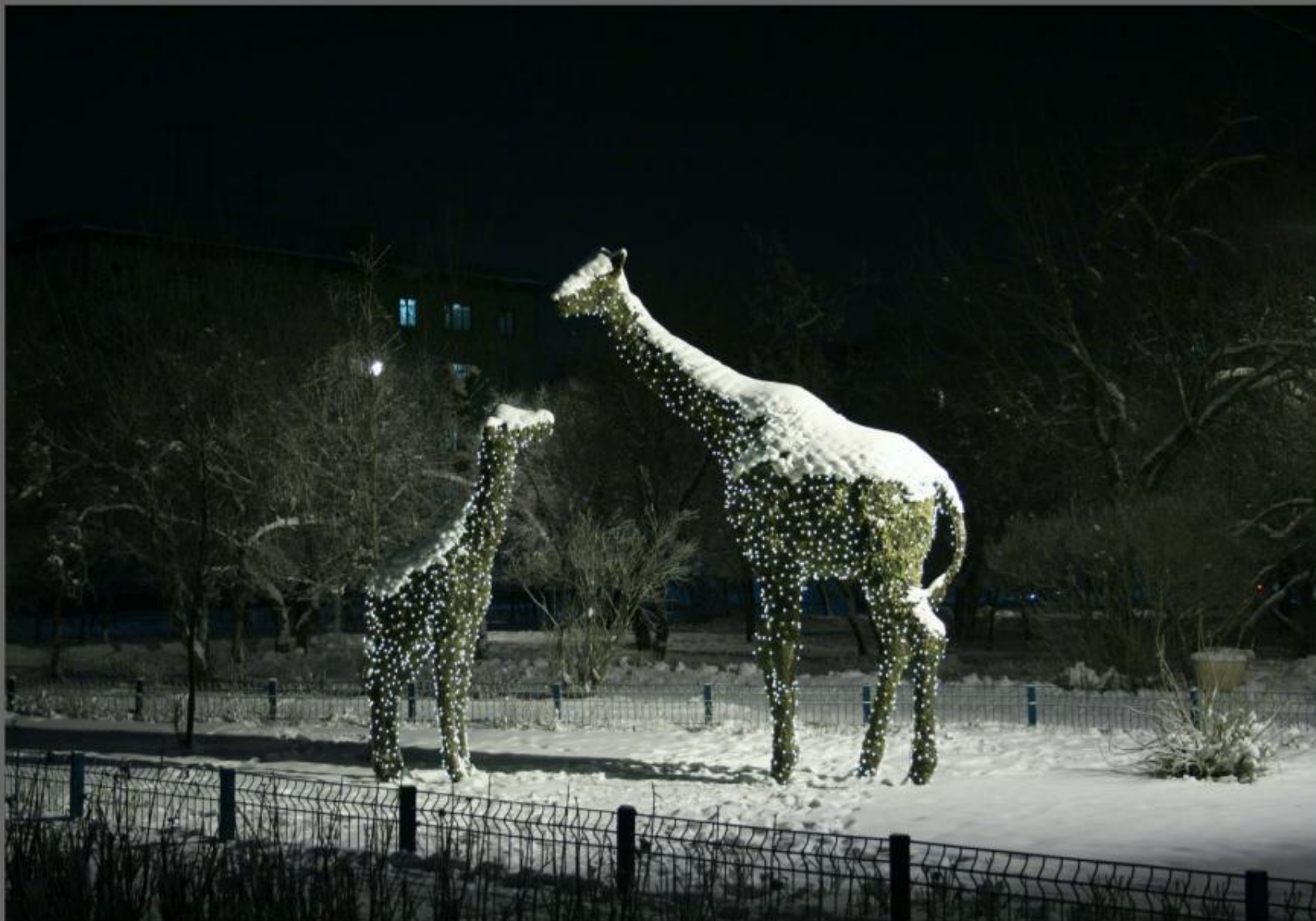
“Ночная Прогулка”. Ул. Ленина.