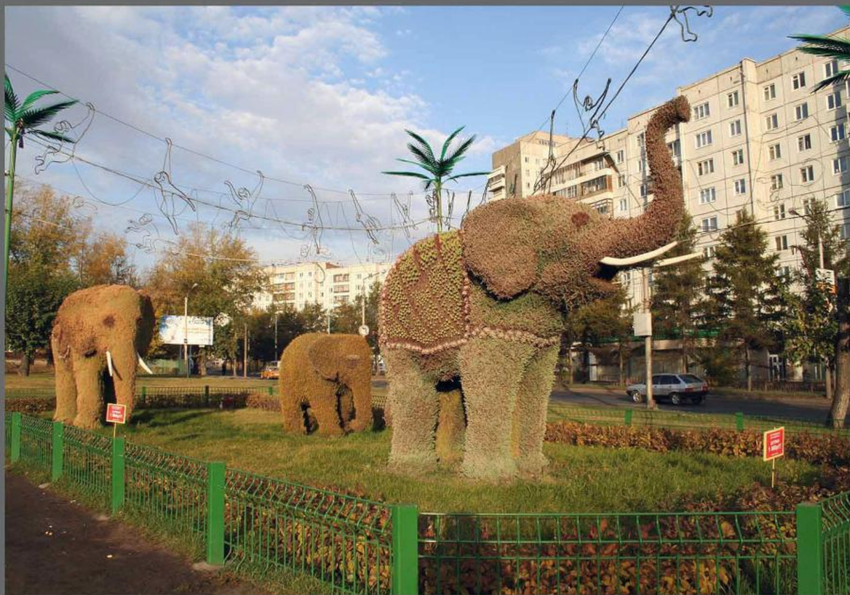
Из Серии: Осенние Зарисовки. Ул. Копылова.