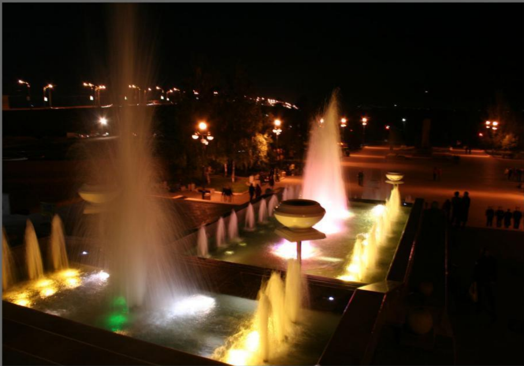
Из серии:ночные фонтаны.