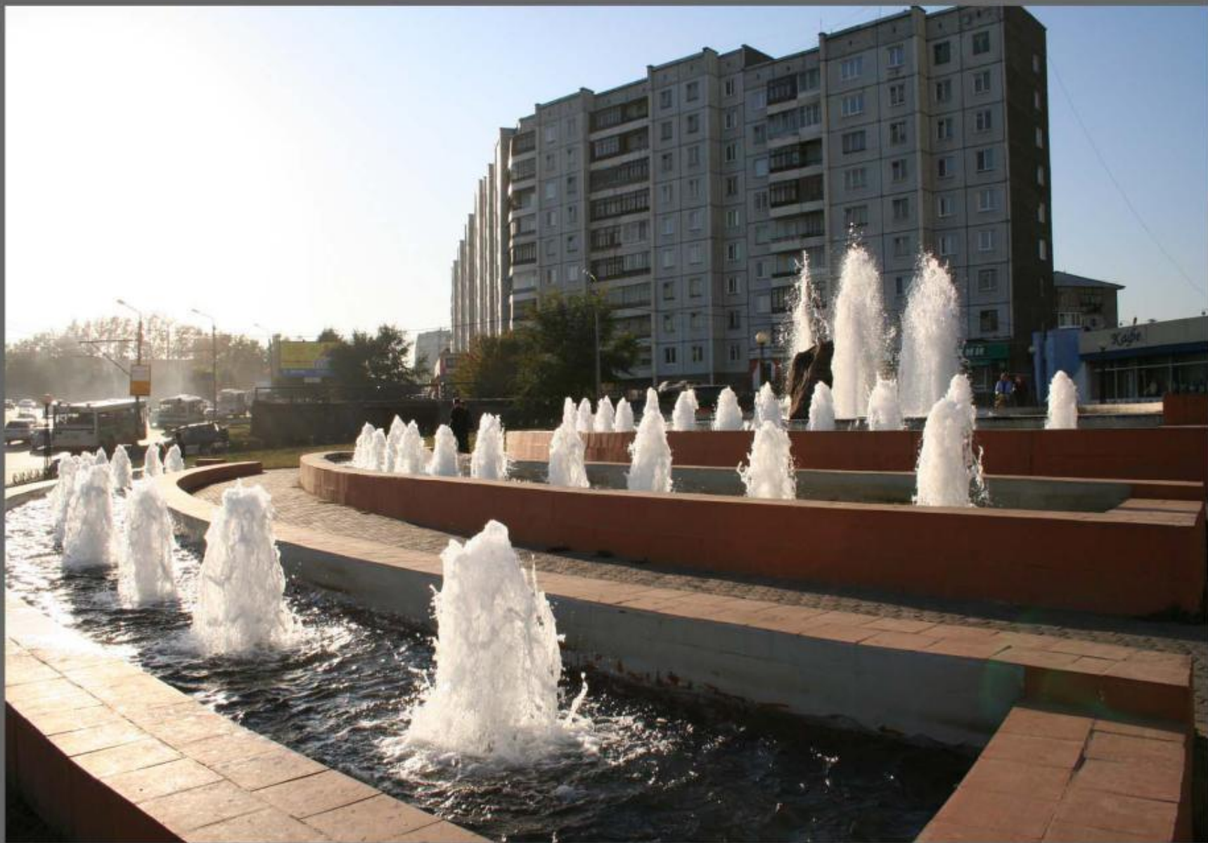
Фонтан на Ул. Копылова.