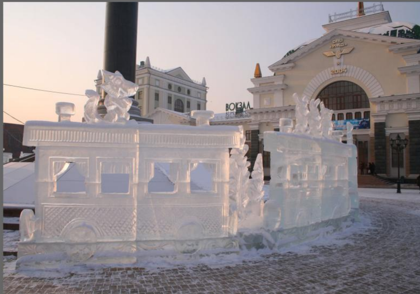
Площадь перед Ж.Д. Вокзалом.

Зимой фонтаны продолжают радовать горожан, но уже замерзшей водой.