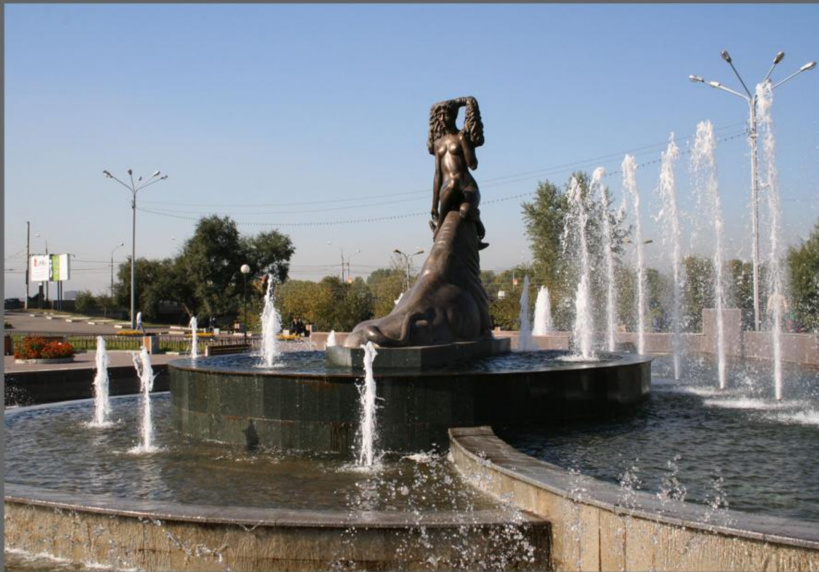
Фонтан на Предмостной Площади.