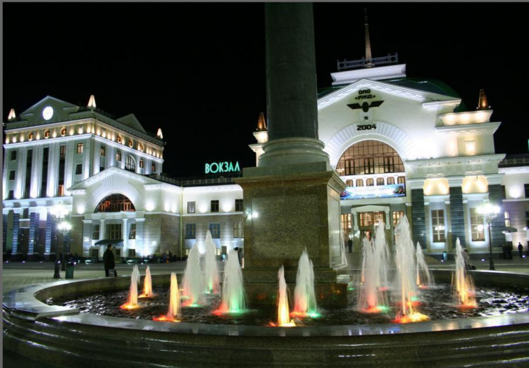
Площадь перед Ж.Д.Вокзалом.