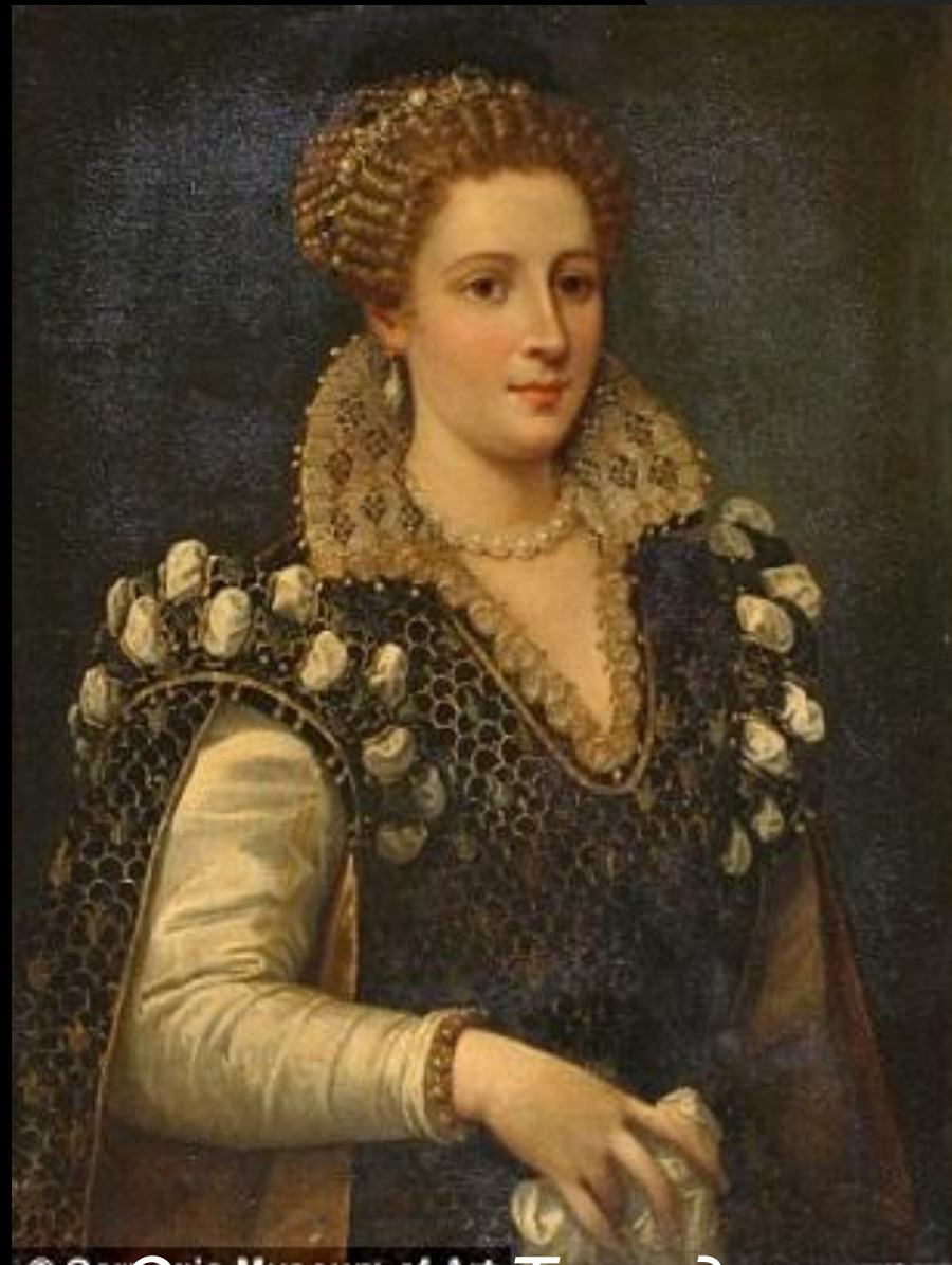
Элеонора Толедская Медичи.