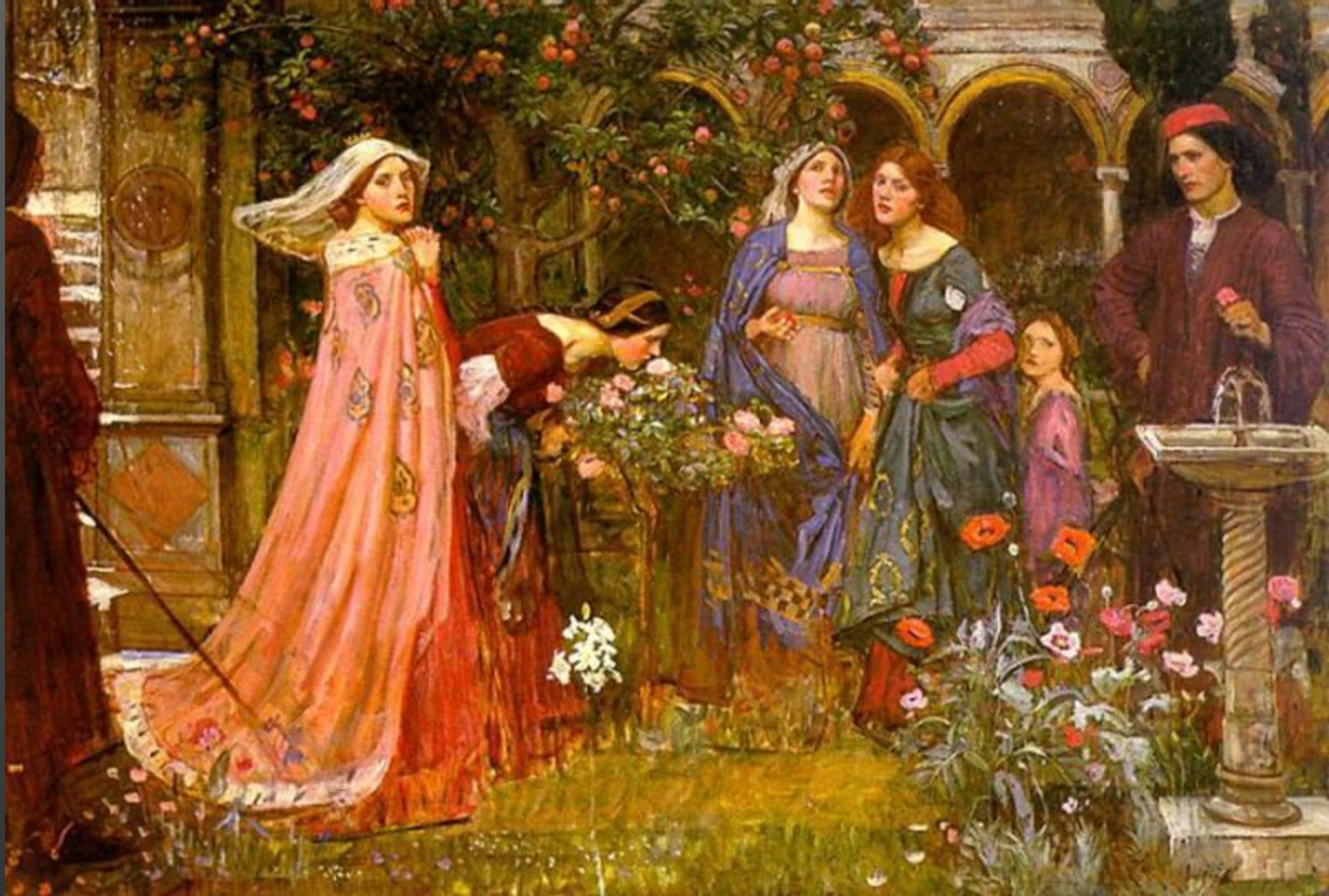
Джон Уильям Уотерхаус «Зачарованный сад».