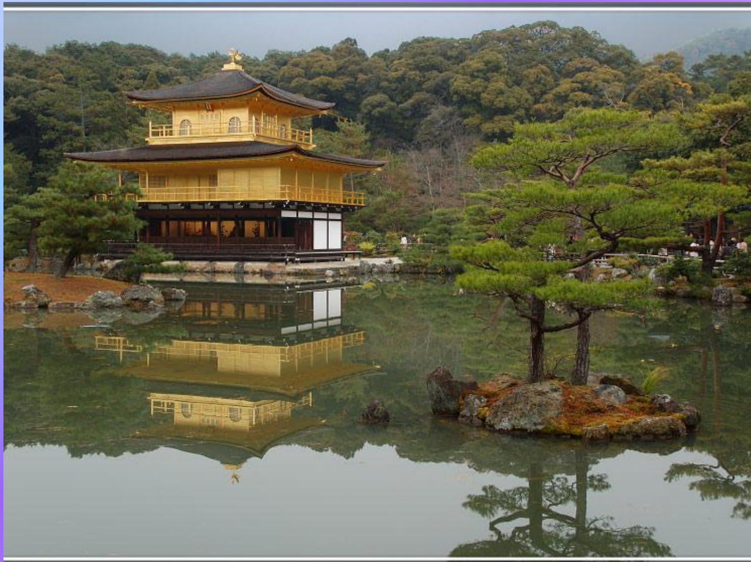
Кинкаку-дзи (Золотой павильон) — один из храмов в комплексе Рокуон-дзи (Храм оленьего сада) в Киото, Япония.