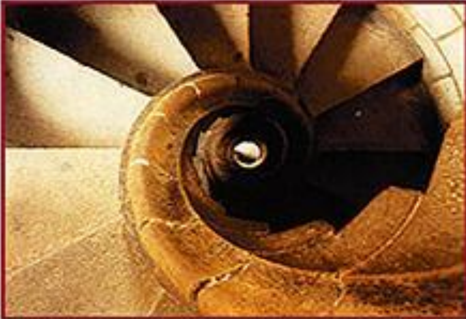
лестница в башне