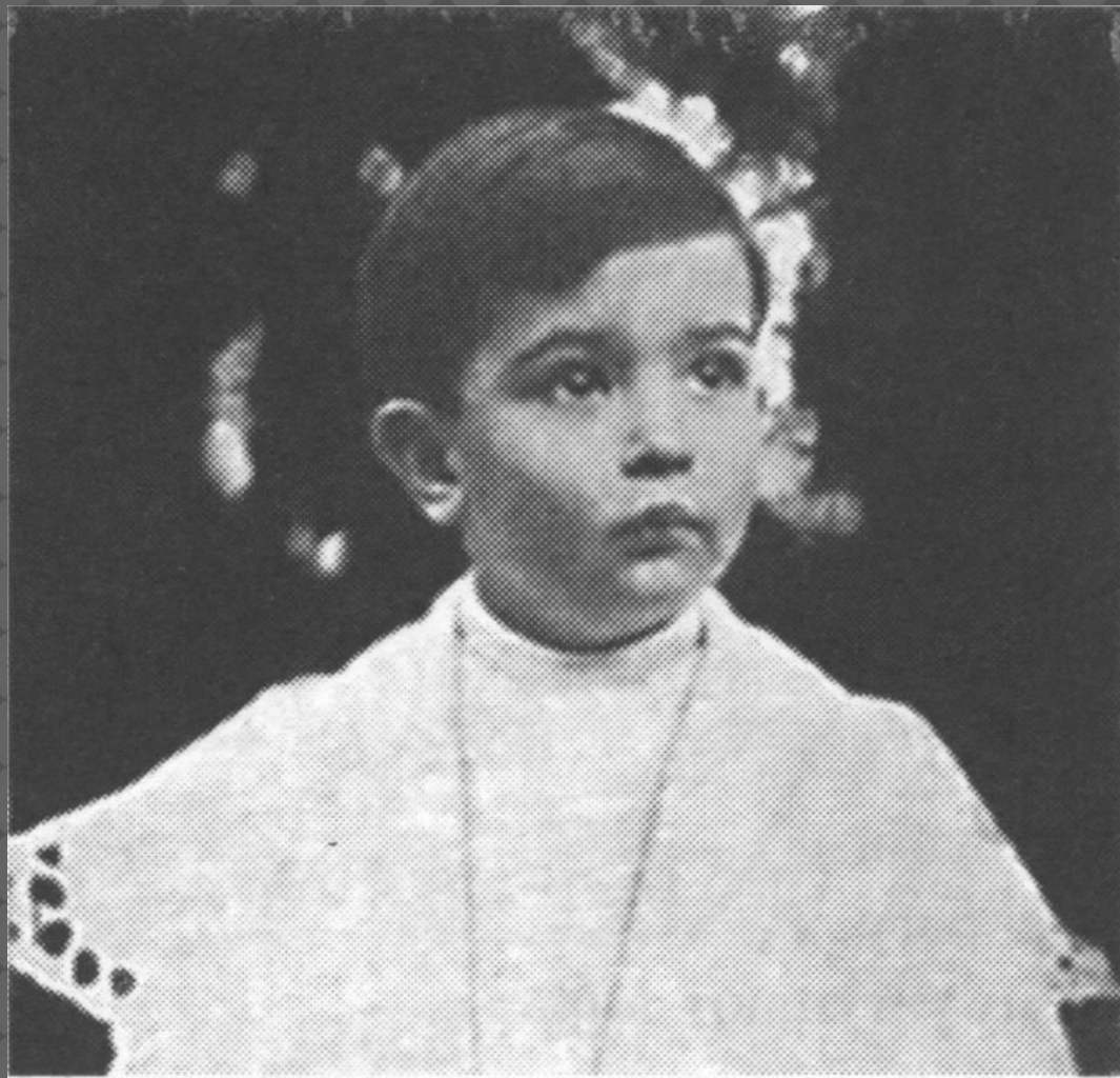
Сальвадор Далі в дитинстві

Ось юному Сальвадору шість років. Він схожий на Маленького принца з казки Екзюпері. Великі сумні очі, попелясті локони, дивна блукаюча посмішка. Всі знайомі його батьків кажуть: «О, це абсолютно незвичайна дитина: не бешкетує, як його однолітки, може подовгу блукати на самоті і думати про щось своє. Дуже сором'язливий. А недавно, уявіть собі, закохався і запевняє, що це на все життя!»