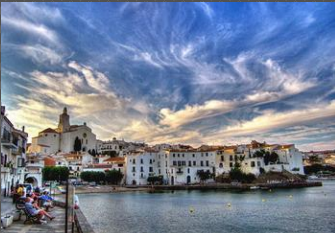
Кадакес. Наші дні

Вересень 1929. Невелике каталонське селище Кадакес, що в кількох кілометрах від Порт-Аїгата. Тут живе початківець художник Сальвадор Далі, відомий своїми дивними картинами і пристрасстю до філософії Ніцше. Йому 25 років, але він панічно боїться жінок.