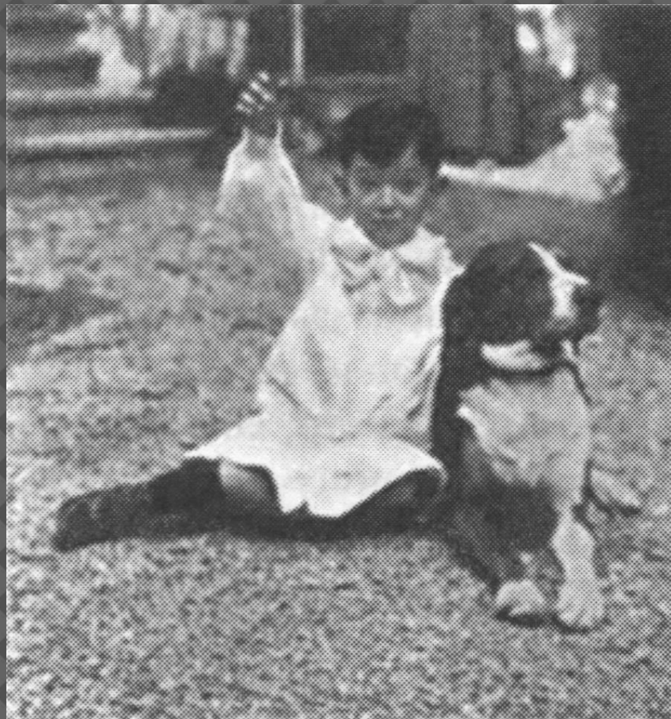
Сальвадор Далі в дитинстві

А було так. Хтось із дорослих подарував хлопчику авторучку: у скляній кульці її оправи можна було побачити гарну даму з розвіяним волоссям. Подібно Сніговій Королеві вона мчала в снях по сліпуче білому снігу, і зоряний пил осідав на її чарівній шубці ... Ручка стала головним скарбом хлопчика. «Виросте - забуде», - відмахнулися дорослі. Але він не забув.