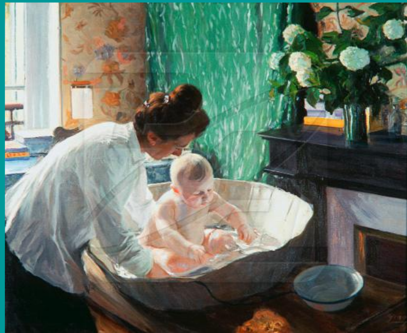
Б.Кустодиева. «Утро». 1904.