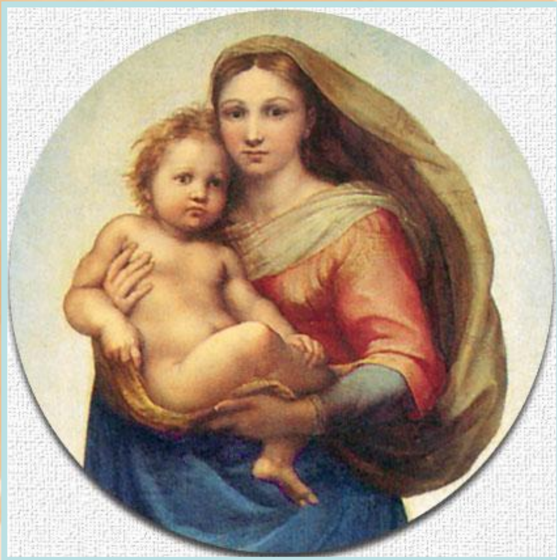
Рафаэль Санти. «Сикстинская мадонна. Мария и Христос». 1512-1515.