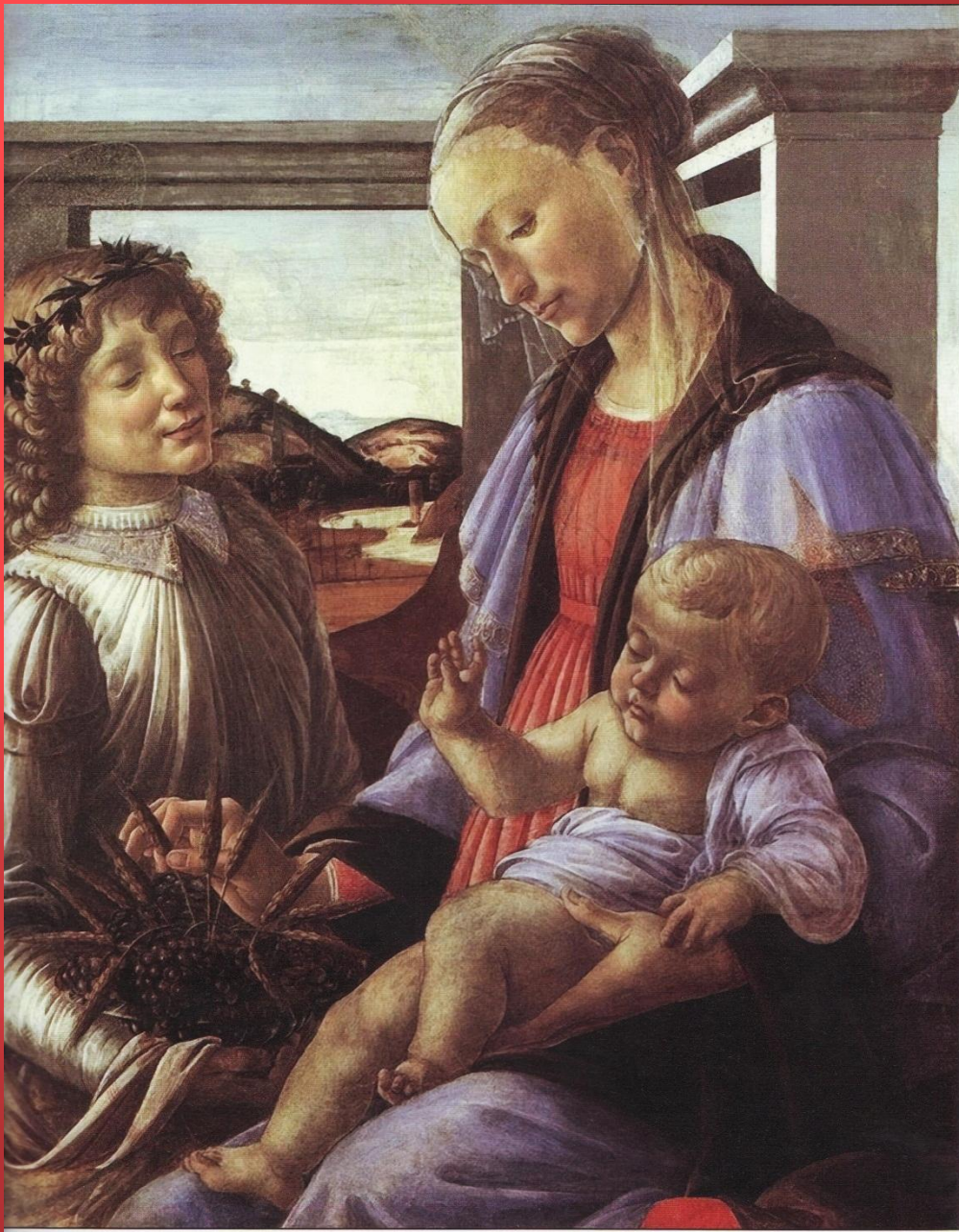
Мадонна Евхаристии . Около 1470