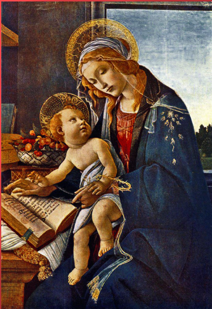
Мадонна с книгой. 1480-1481