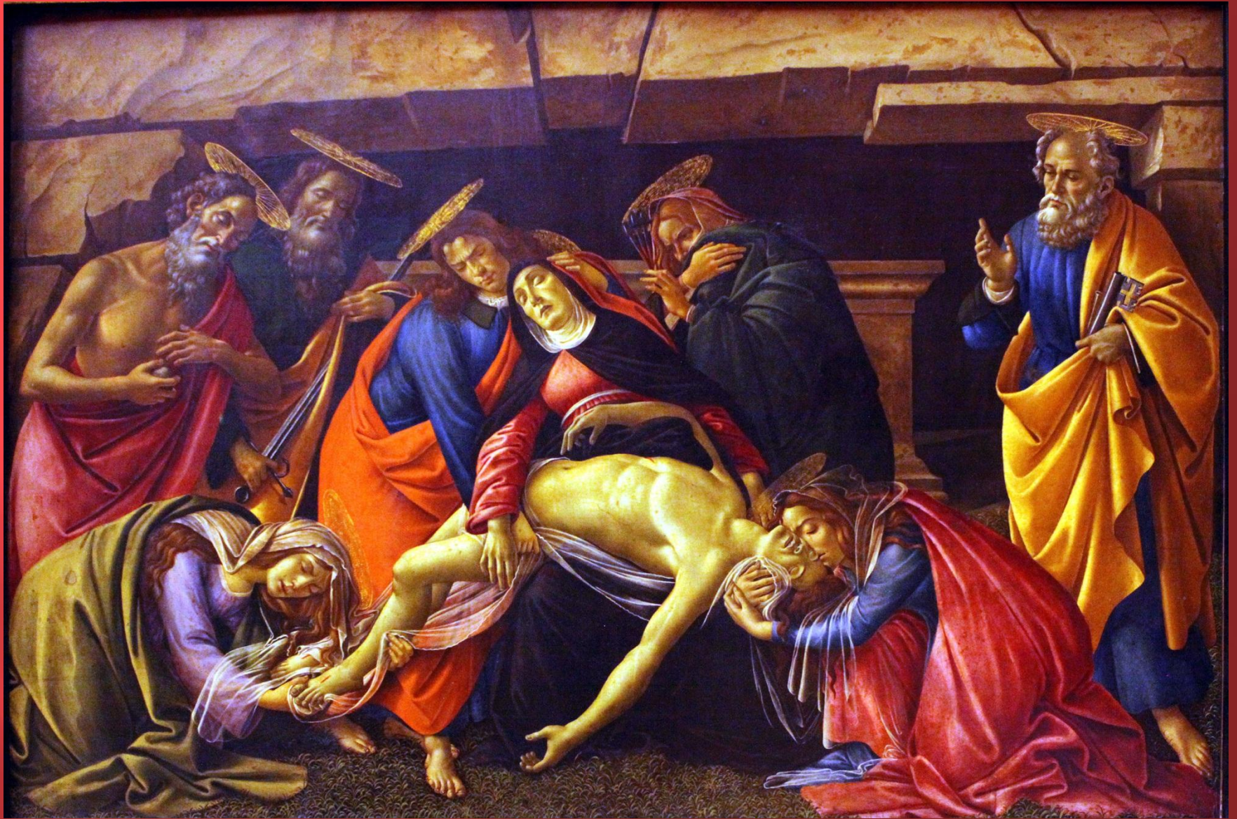
Оплакивание Христа. Около 1500