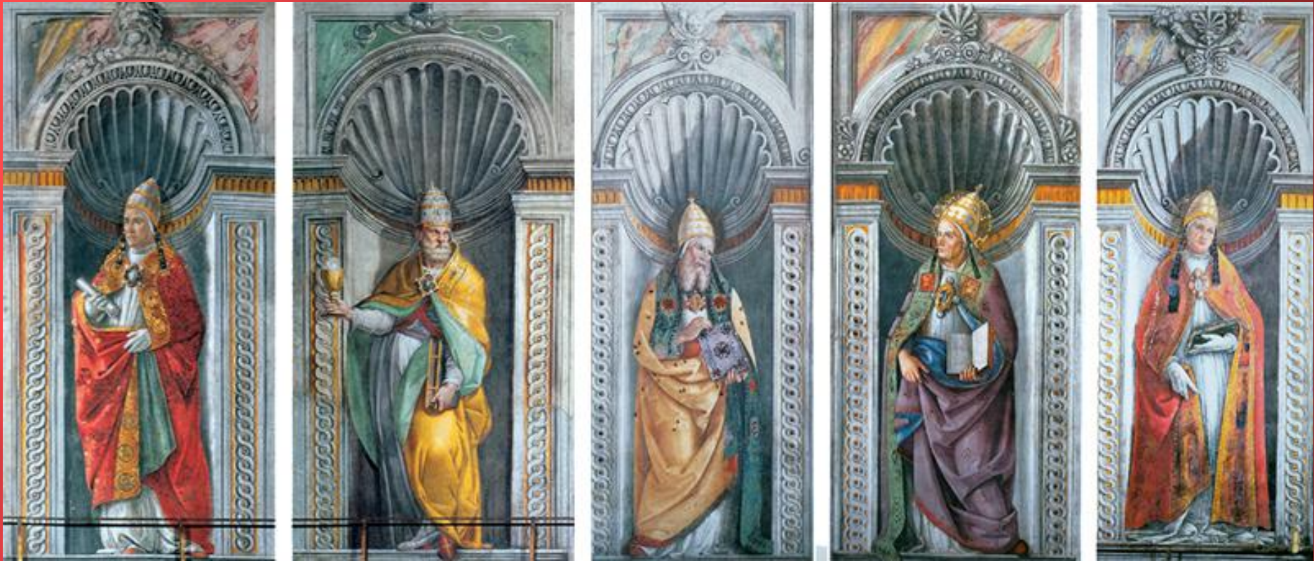
Сикстинская капелла. Портреты римских пап. 1481