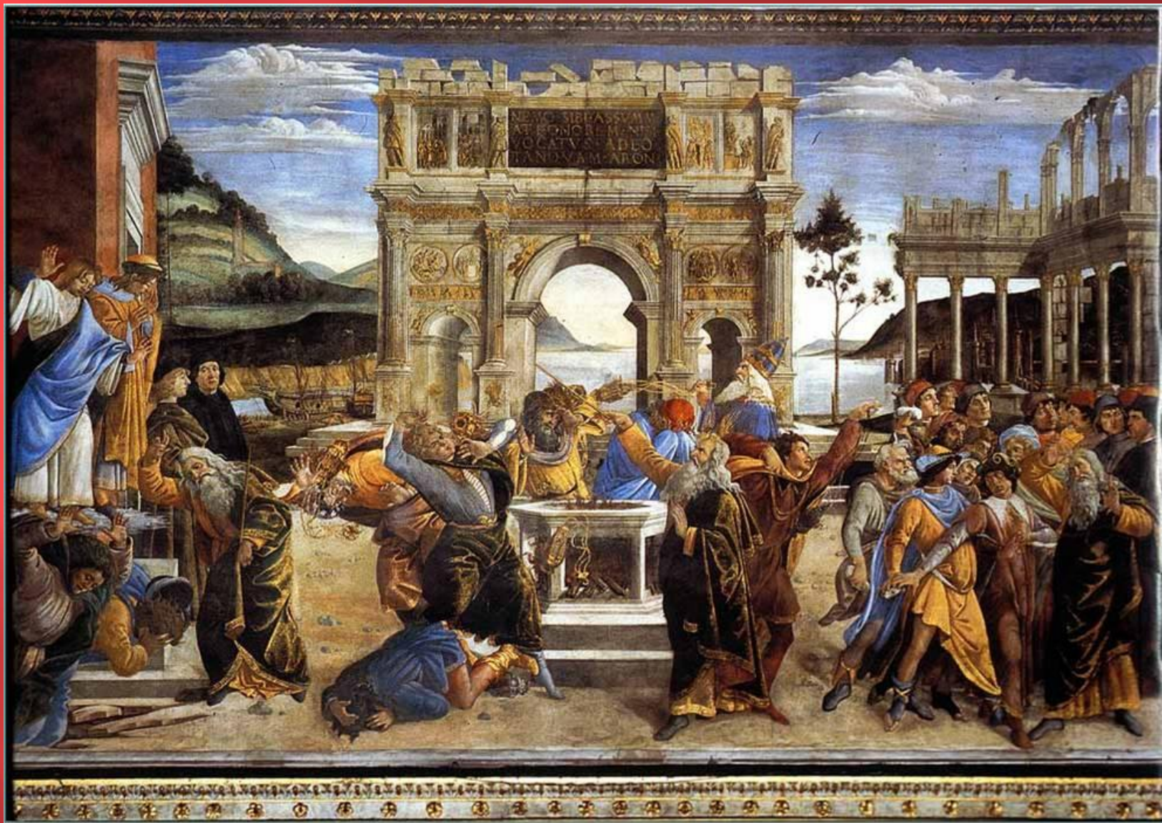
Наказание левитов. 1481-1482