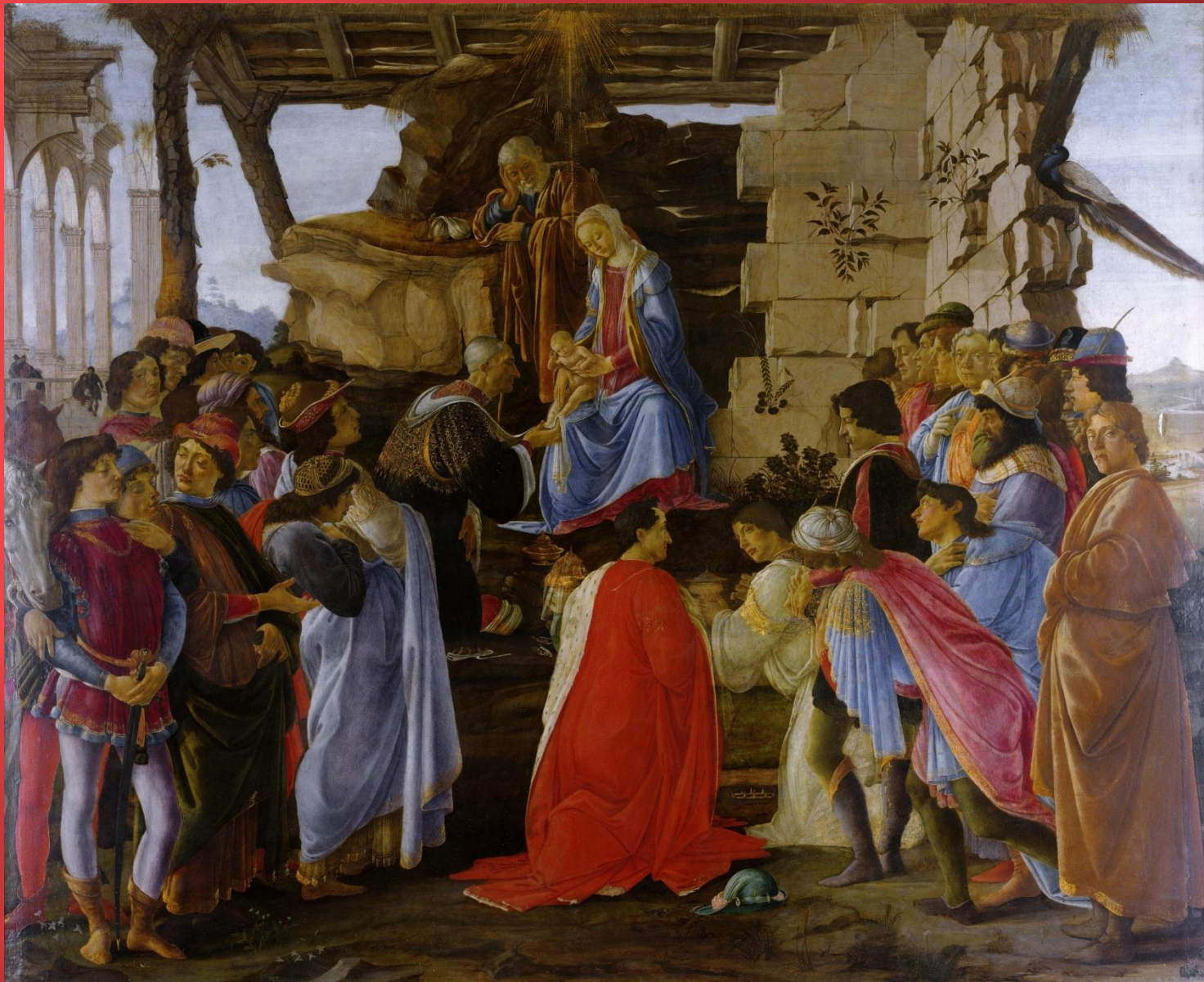
Поклонение Волхвов. Около 1473