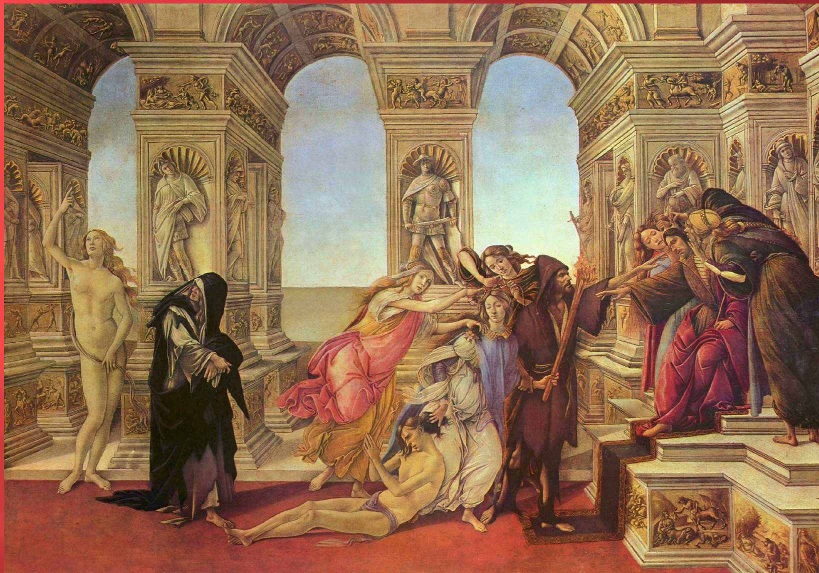
Клевета. Около 1495