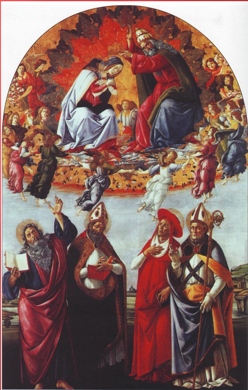
Коронование Марии. 1490- 1492