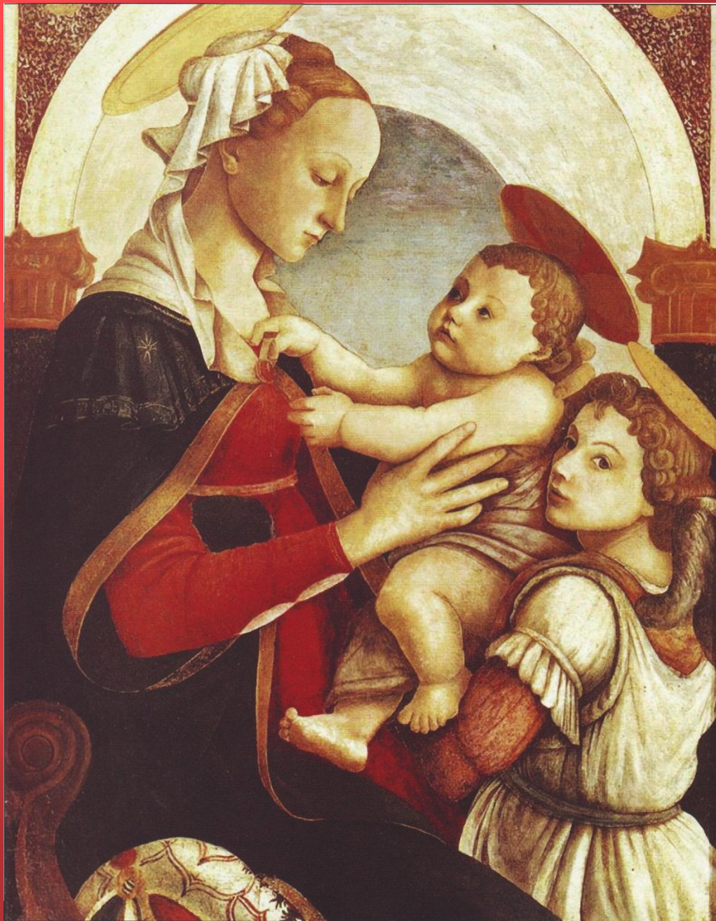
Мадонна с младенцем и ангелом. 1465-1467