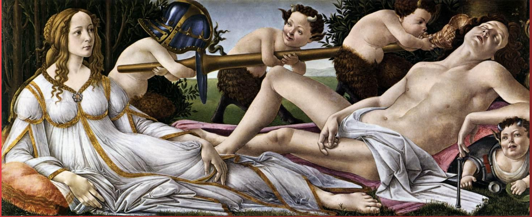
Венера и Марс. 1482-1483