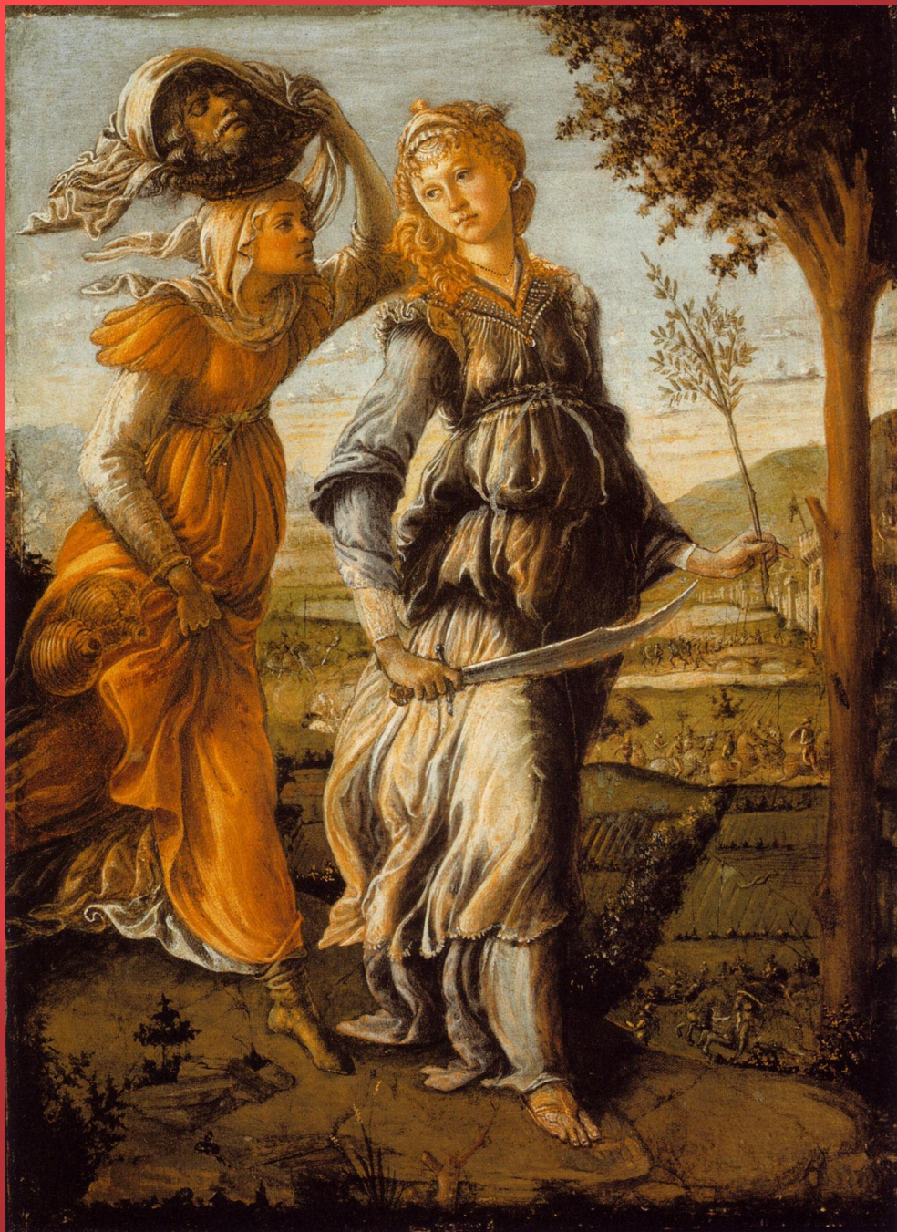
Возвращение Юдифи. 1472-1473