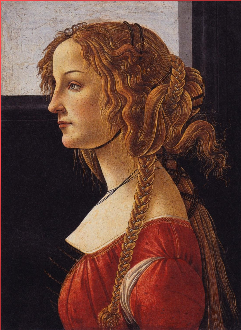
Портрет Симонетты Веспуччи. Около 1480