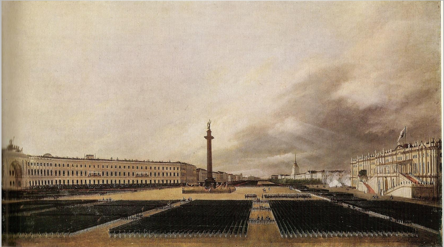
Парад 30 августа 1834 года. Картина В.Е. Раева. 1834