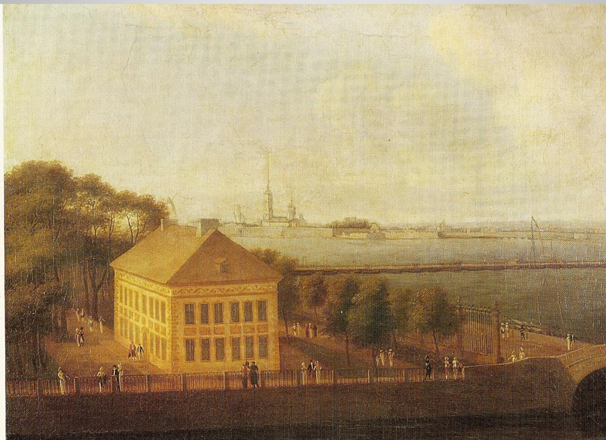
Вид на Неву и Летний дворец Петра I, А.Е.Мартынов, 1825г.