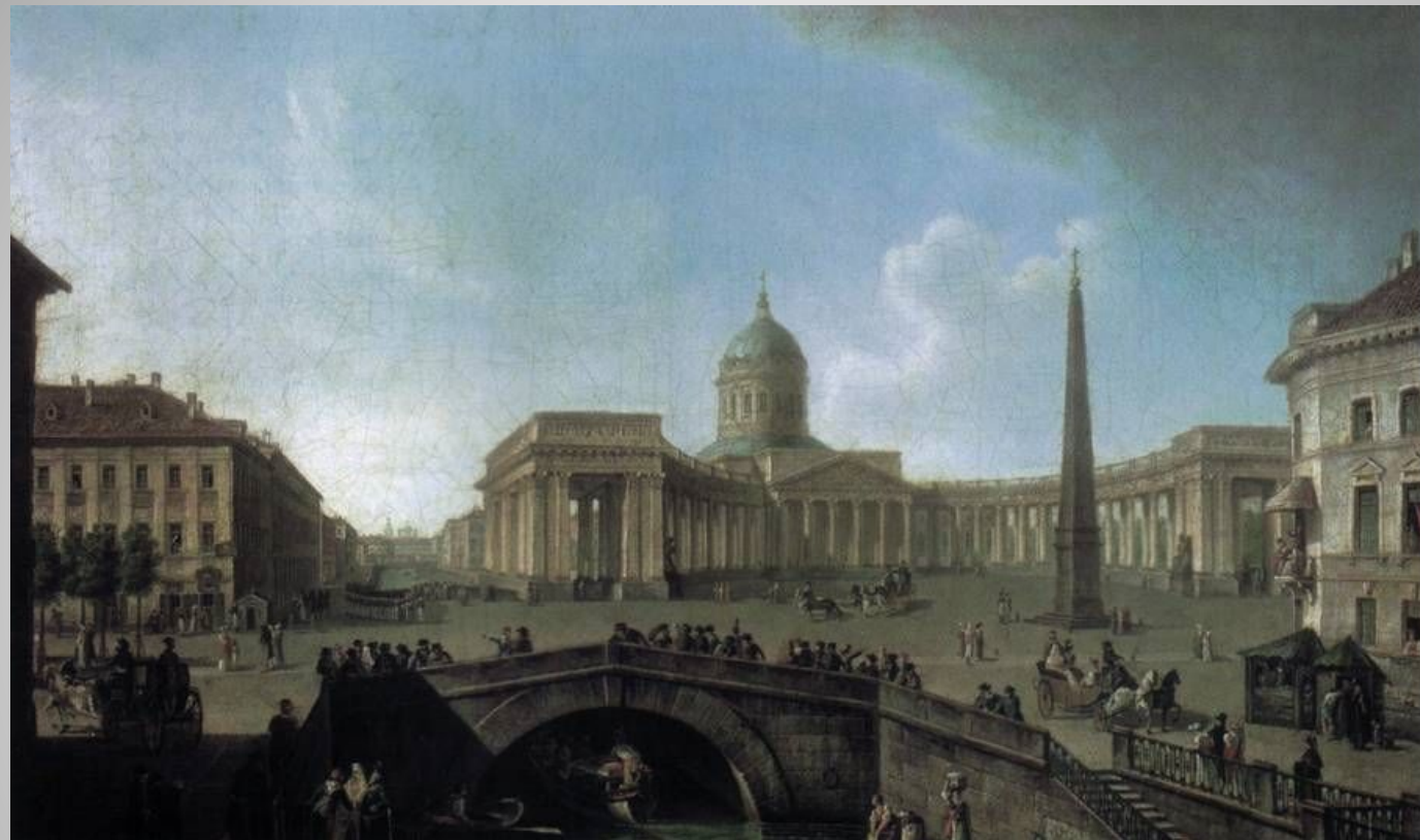
Вид Казанского собора в Петербурге. Федор Алексеев