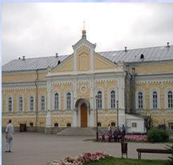
Трапезный храм во имя святого благочестивого князя Александра Невского

В обители проживает более 400 насельниц. С 1989 года в Дивееве было восстановлено и освящено семь храмов. Центром духовной жизни остается Троицкий собор со своей главной святыней — святыми мощами преподобного Серафима, Саровского чудотворца.