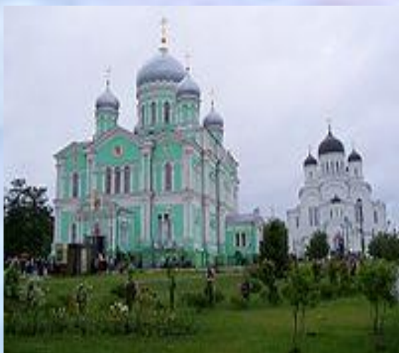
Троицкий собор (слева) и Преображенский собор (справа)

В 1842 году В 1842 году, через 9 лет после преставления Серафима, обе общины были объединены с наименованием Серафимо-Дивеевской. С 1853 года Казанская церковь с приделами стала существовать отдельно от новой общины.