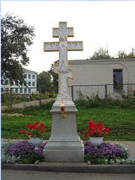
Крест у начала Святой канавки

25 ноября 1825 года Богородица явилась преподобному Серафиму и повелела основать Мельничную общину, указав как следует обнести это место канавой и валом. Копать Канавку должны были только сестры общины, а миряне могли помогать носить землю и насыпать вал.