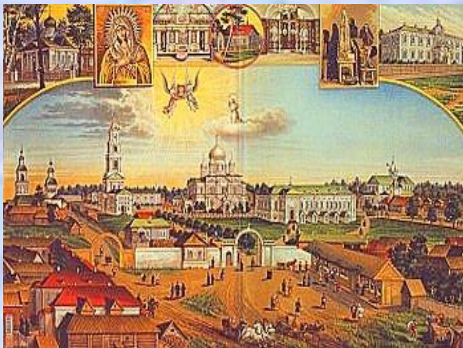
Литография с видом Дивеевского монастыря с юго-западной стороны (начало XX века)