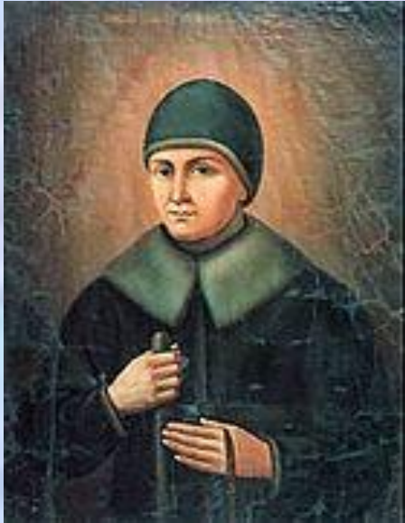
Портрет преподобной Александры

Монастырь возник в половине XVIII века Монастырь возник в половине XVIII века: около 1758 Монастырь возник в половине XVIII века: около 1758 прибыла в Киев Монастырь возник в половине XVIII века: около 1758 прибыла в Киев богатая рязанская помещица Агафья Семёновна Мельгунова Монастырь возник в половине XVIII века: около 1758 прибыла в Киев богатая рязанская помещица Агафья Семёновна Мельгунова († 13 июня 1789 Монастырь возник в половине XVIII века: около 1758 прибыла в Киев богатая рязанская