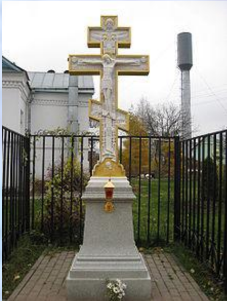
Крест у окончания Святой Канавки