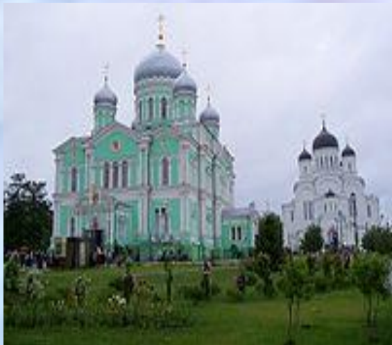
Троицкий собор (слева) и Преображенский собор (справа)

В 1842 году В 1842 году, через 9 лет после преставления Серафима, обе общины были объединены с наименованием Серафимо-Дивеевской. С 1853 года Казанская церковь с приделами стала существовать отдельно от новой общины.