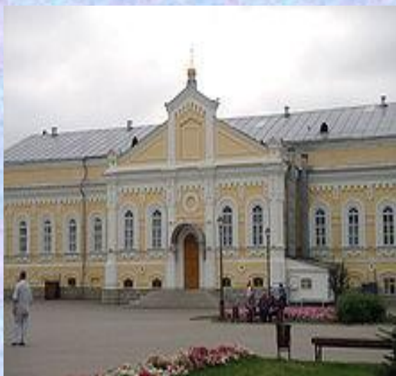
Трапезный храм во имя святого благочестивого князя Александра Невского

В обители проживает более 400 насельниц. С 1989 года в Дивееве было восстановлено и освящено семь храмов. Центром духовной жизни остается Троицкий собор со своей главной святыней — святыми мощами преподобного Серафима, Саровского чудотворца.