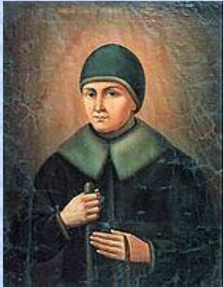
Портрет преподобной Александры

Монастырь возник в половине XVIII века : около 1758 прибыла в Киев богатая рязанская помещица Агафья Семёновна Мельгунова († 13 июня 1789 ), ставшая насельницей Флоровского монастыря (матушка Александра) и вскоре начавшая странствовать по России в поисках места для основания новой обители. В 1760 году она оказалась, по пути в Саровский монастырь , вблизи Дивеева в деревне Осиновка.