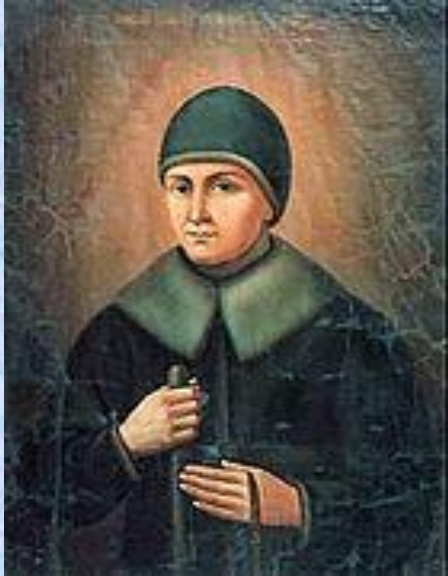
Портрет преподобной Александры

Монастырь возник в половине XVIII века : около 1758 прибыла в Киев богатая рязанская помещица Агафья Семёновна Мельгунова († 13 июня 1789 ), ставшая насельницей Флоровского монастыря (матушка Александра) и вскоре начавшая странствовать по России в поисках места для основания новой обители. В 1760 году она оказалась, по пути в Саровский монастырь , вблизи Дивеева в деревне Осиновка.