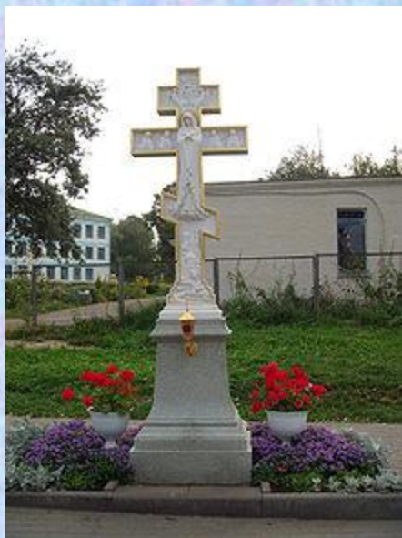
Крест у начала Святой канавки

25 ноября 1825 года Богородица явилась преподобному Серафиму и повелела основать Мельничную общину, указав как следует обнести это место канавой и валом. Копать Канавку должны были только сестры общины, а миряне могли помогать носить землю и насыпать вал.