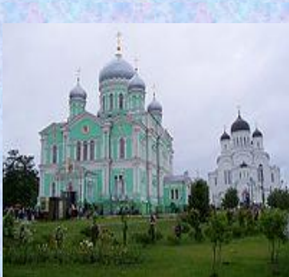
Троицкий собор (слева) и Преображенский собор (справа)

В 1842 году , через 9 лет после преставления Серафима, обе общины были объединены с наименованием Серафимо-Дивеевской. С 1853 года Казанская церковь с приделами стала существовать отдельно от новой общины.