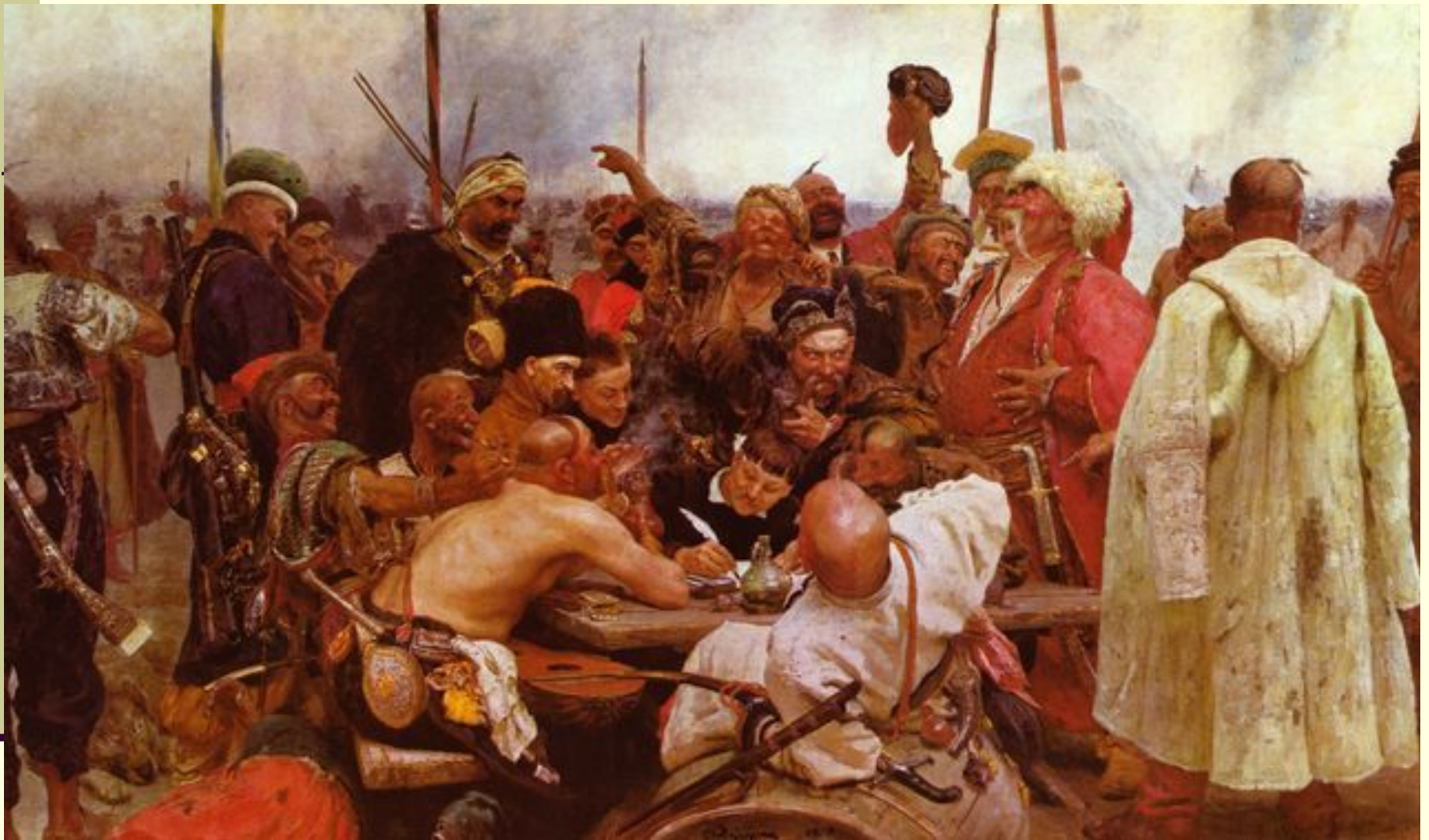
Запорожцы пишут письмо турецкому султану