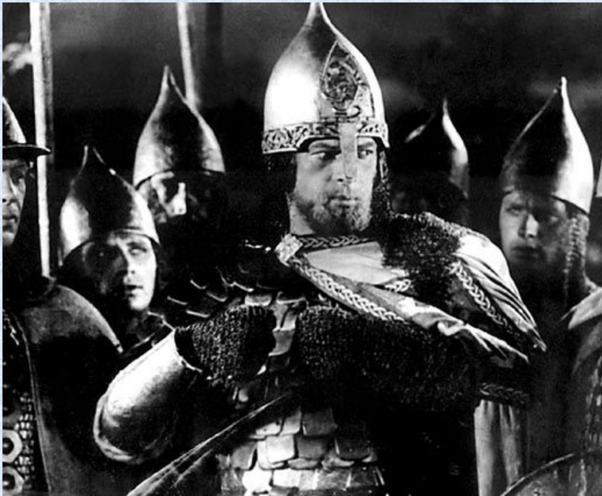
Николай Черкасов в фильм Сергея Эйзенштейна "Александр Невский"