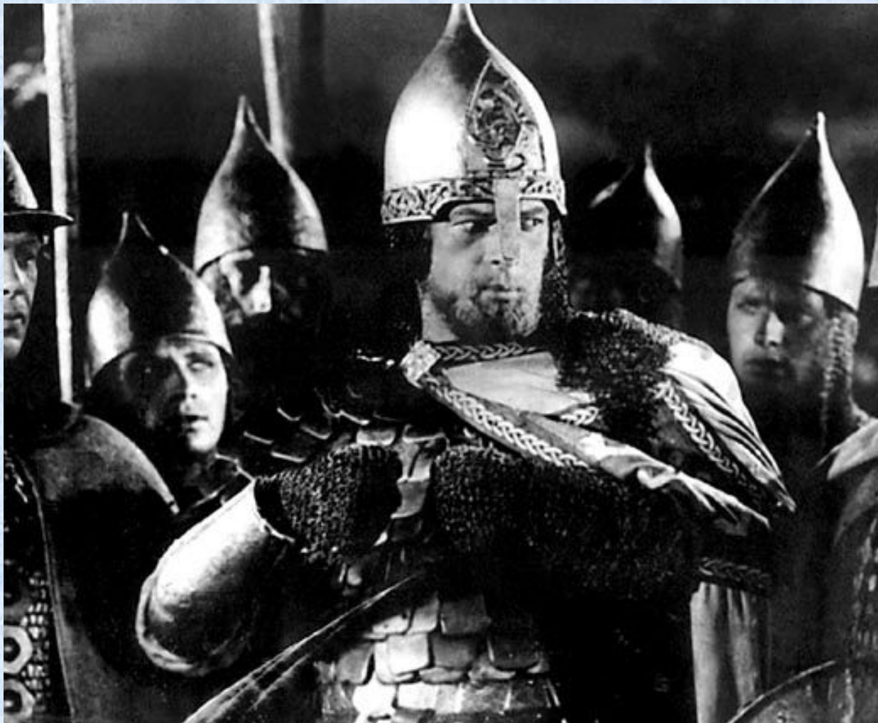
Николай Черкасов в фильм Сергея Эйзенштейна "Александр Невский"