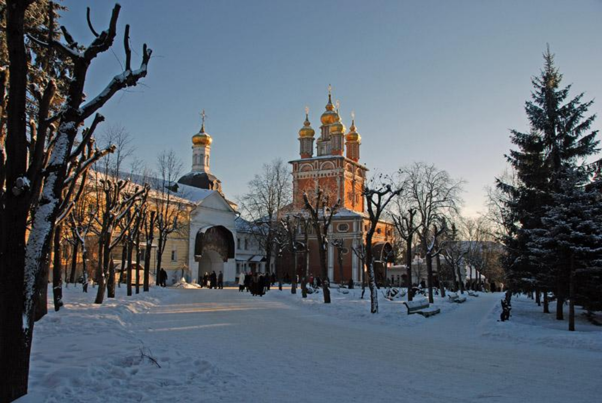
Троице-Сергиева лавра в Сергиевом Посаде Московской области. В центре надвратная Предтеченская церковь, слева от нее Успенские ворота монастыря.