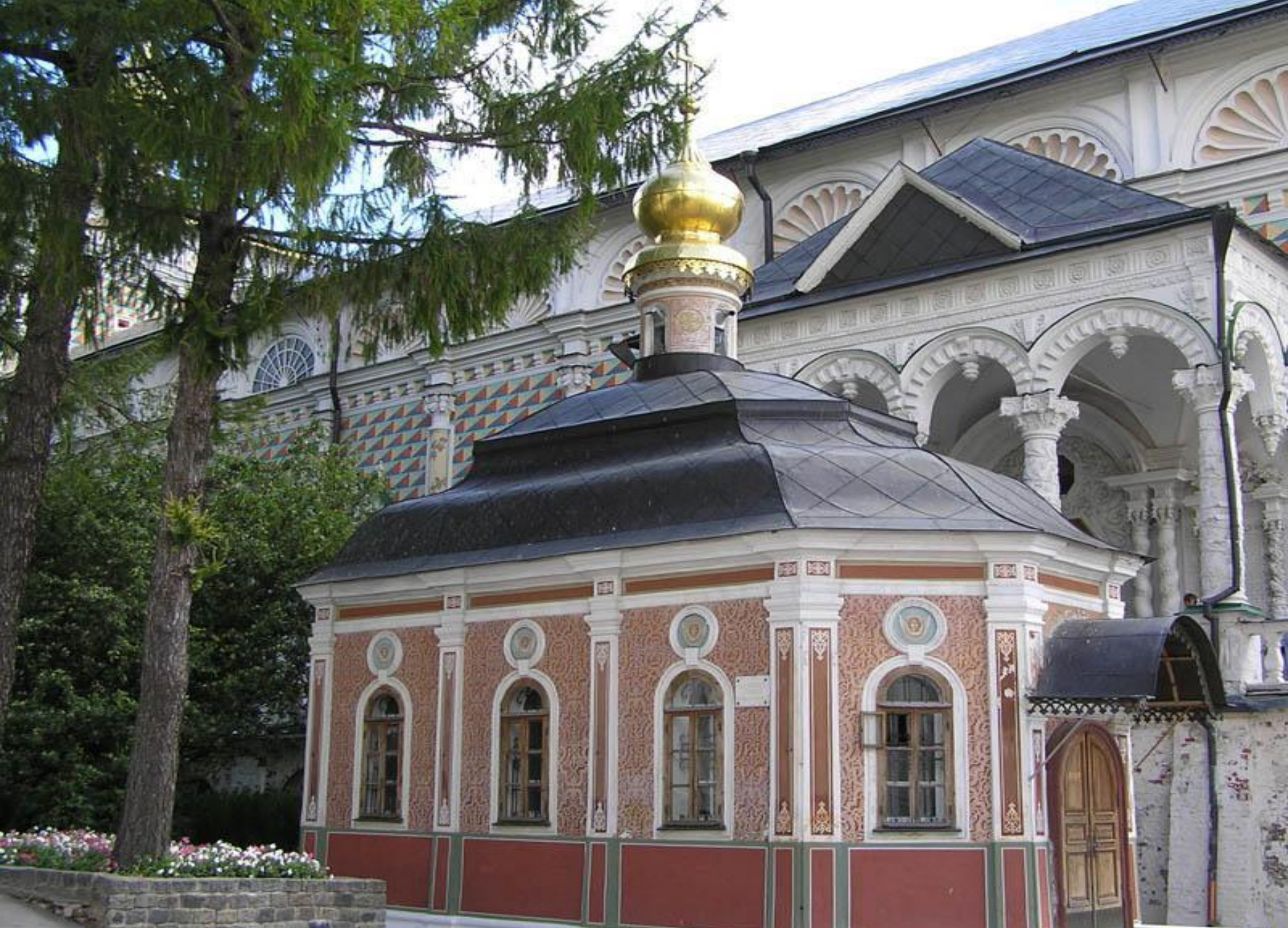
Михеевская церковь в Троице-Сергиевой лавре. На заднем плане Сергиевская