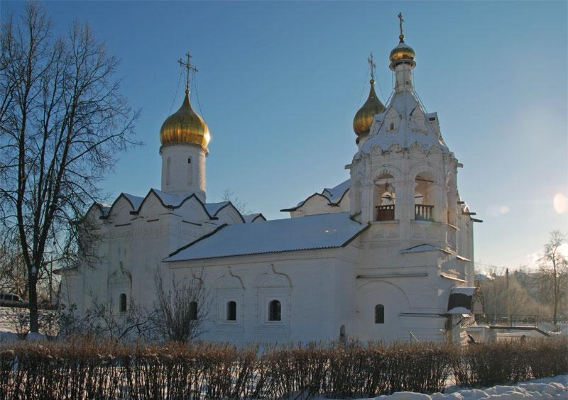
Пятницкая церковь на Подоле в Сергиевом Посаде Московской области. На заднем