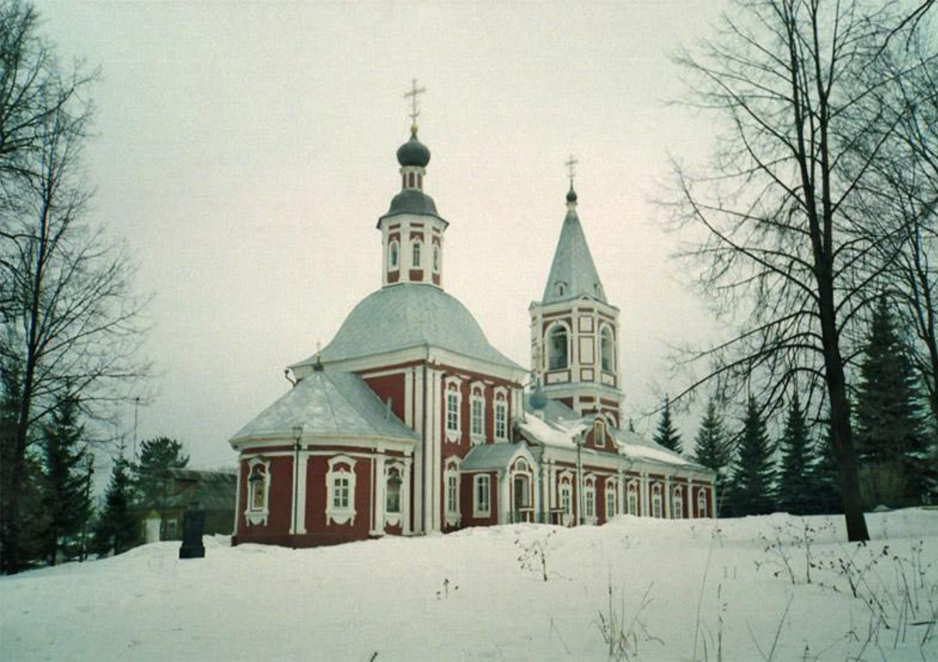
Церковь Илии Пророка в г. Сергиев Посад Московской области