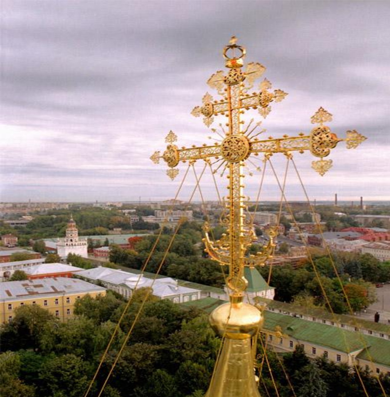
Крест на большом куполе Успенского собора Троице-