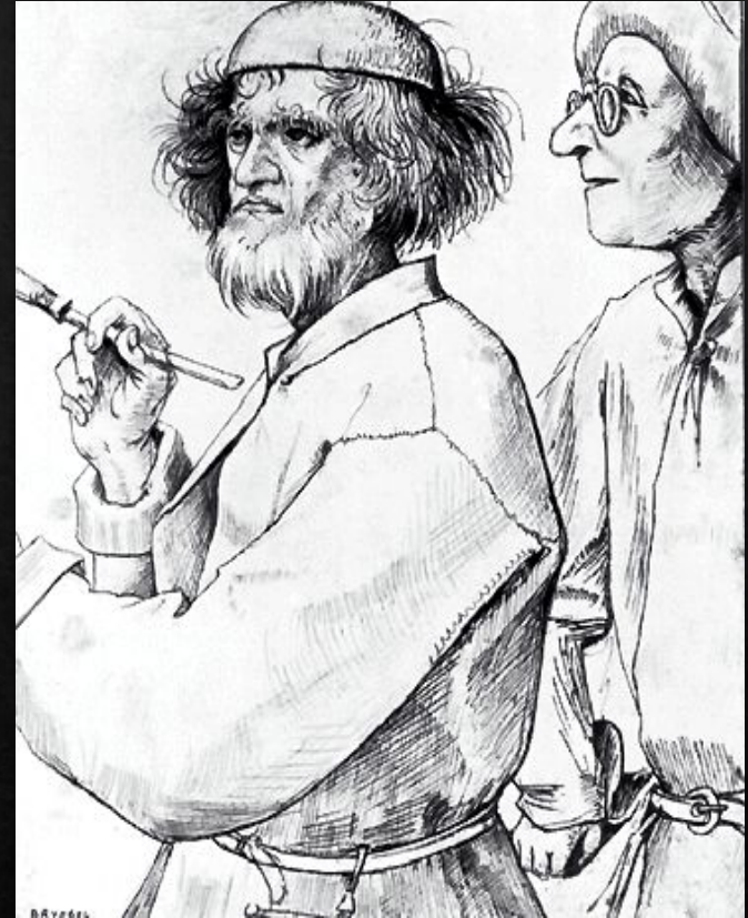
Художник и знаток. Рисунок пером

В его творчестве органично сплелись народный юмор и сложное иносказание, лиризм и трагичность, острая наблюдательность и фантастический гротеск.