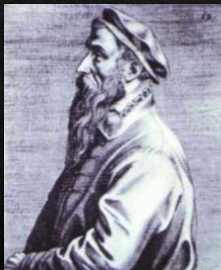
Питер Брейгель- старший