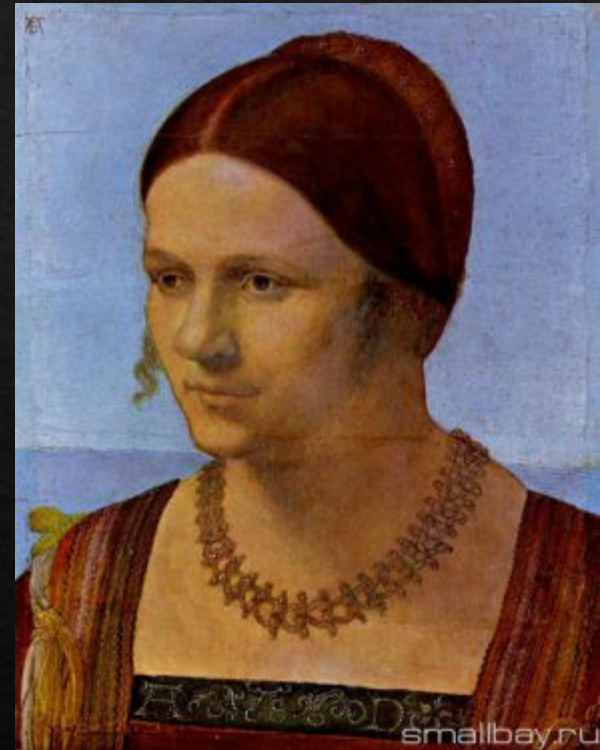
Портрет женщины (1506)