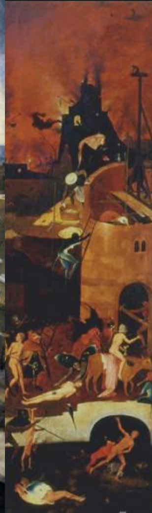
Алтарь Воз сена (1500-1502)