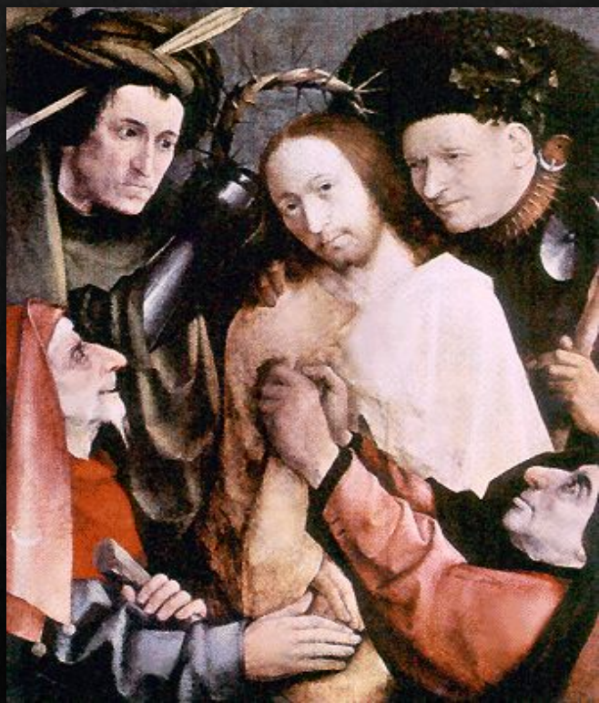
Коронавание терновым венцом(?)