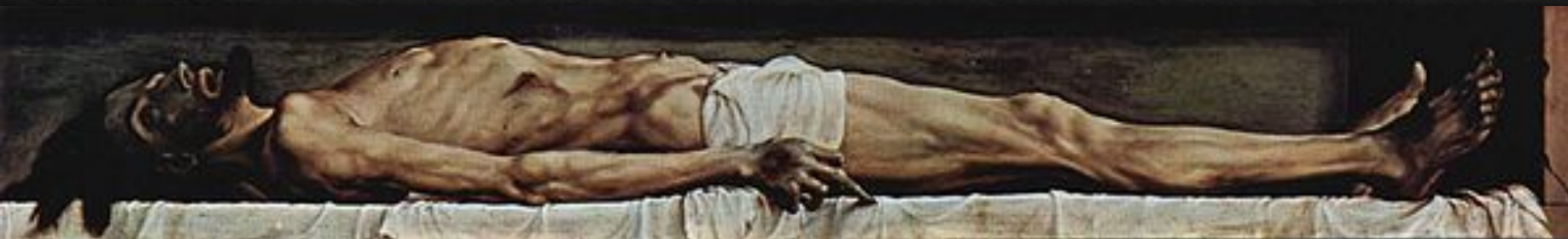
Мёртвый Христос в гробу (1521-1522)