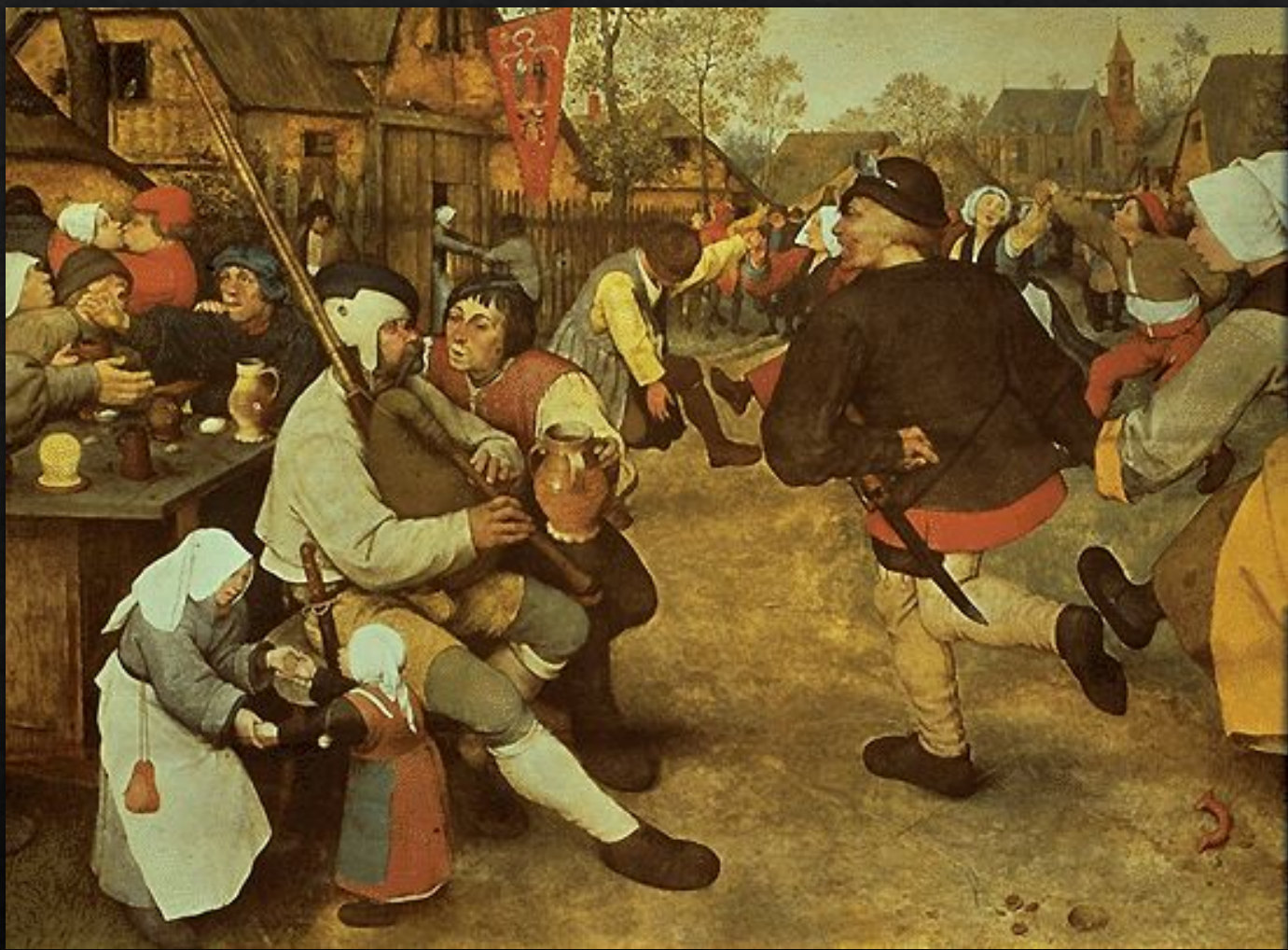
Крестьянский танец (1568)