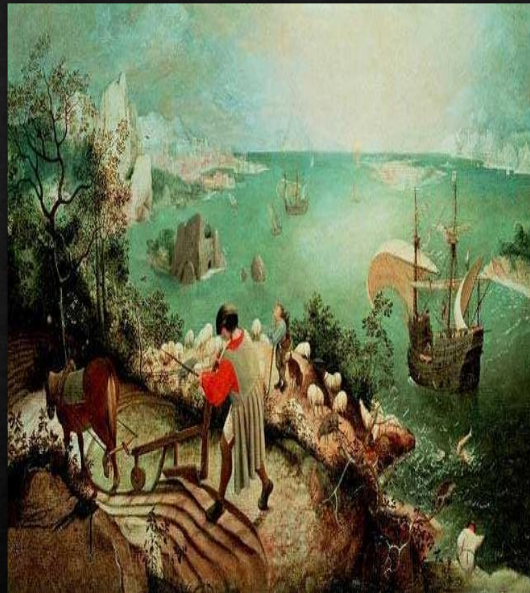
Падение Икара (1558)

Одно из самых ранних его полотен - "Падение Икара". Брейгель трактует зрелище его смерти как незначительную деталь в ничем не нарушаемом ритме вселенной.