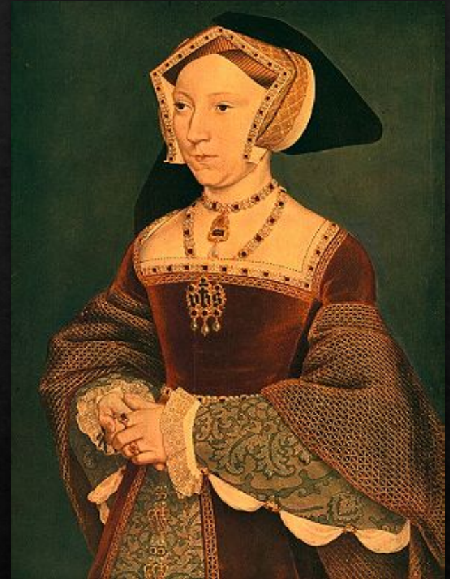
Джейн Сеймур. (1536)