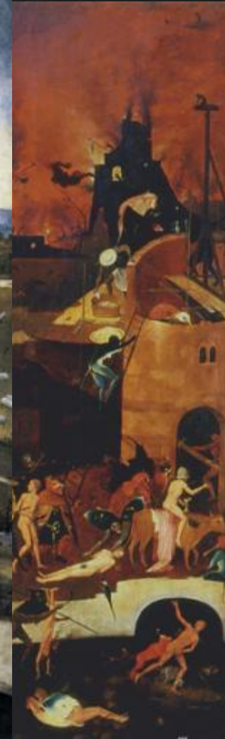
Алтарь Воз сена (1500-1502)