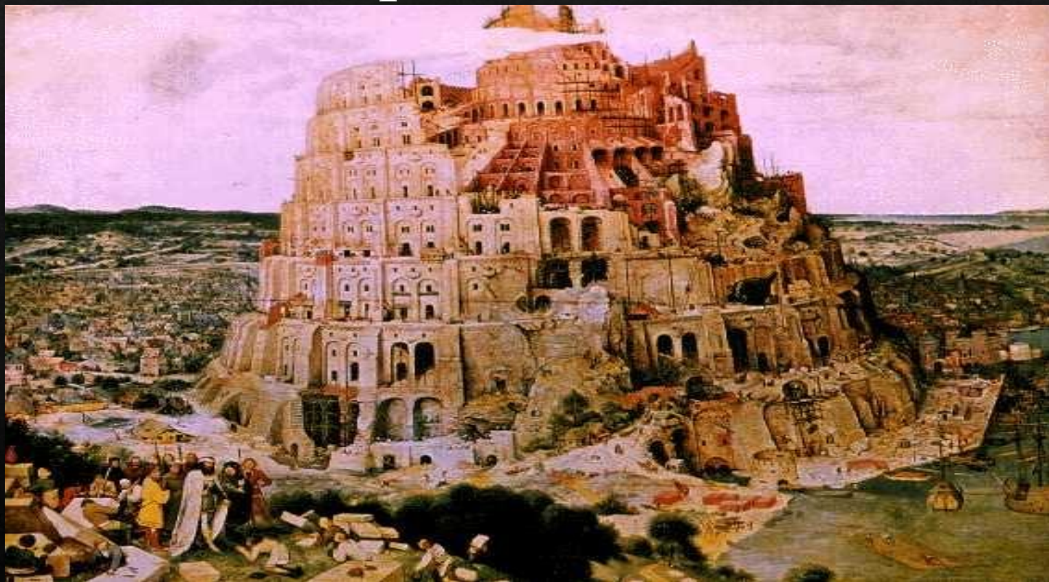
Вавилонская башня (1563)