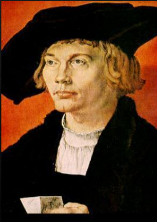
Портрет молодого человека (1521)