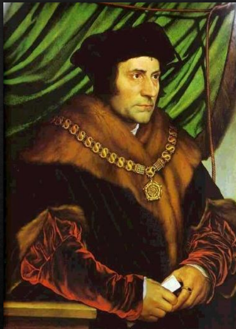
Портрет Томаса Мора (1527)