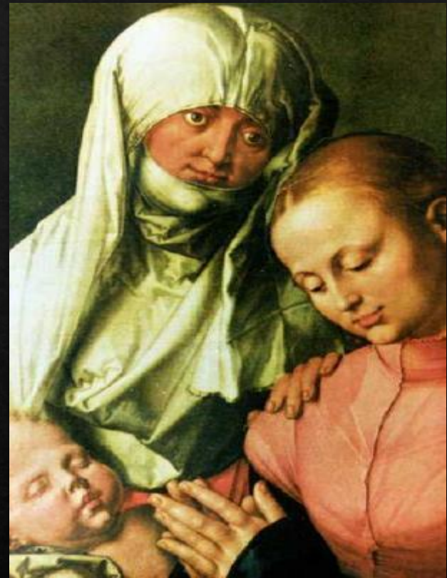
Святая Анна с Мадонной и младенцем (1519)