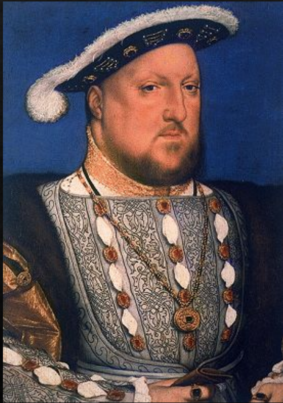
Генрих VIII (1537)