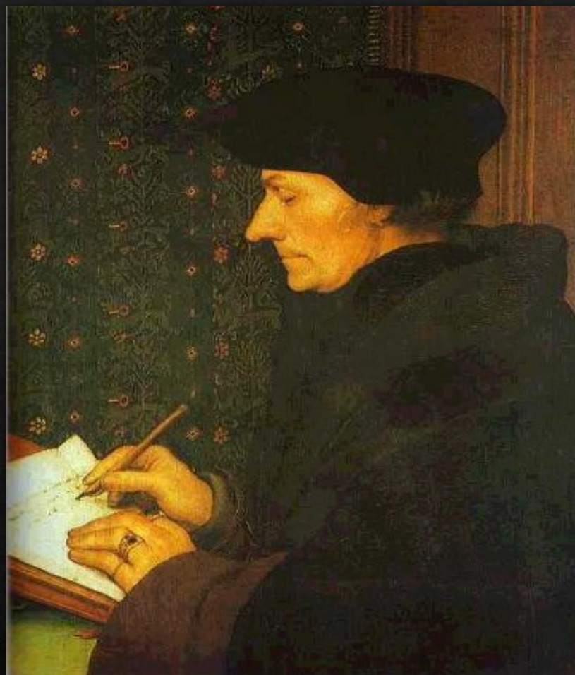
Портрет Эразма Роттердамского (?)