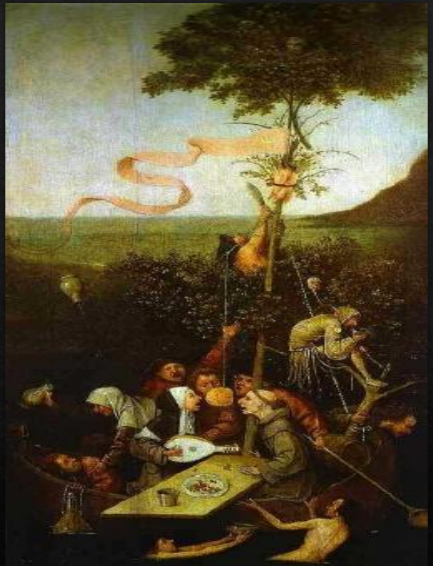
Корабль дураков (1490-1500)

Для современников Босха его картины имели гораздо больший смысл, чем для современного зрителя. Необходимые пояснения к сюжетам средневековый человек получал из разнообразных символов, которыми изобилуют картины Босха.