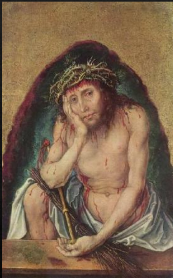
Се человек (1511)