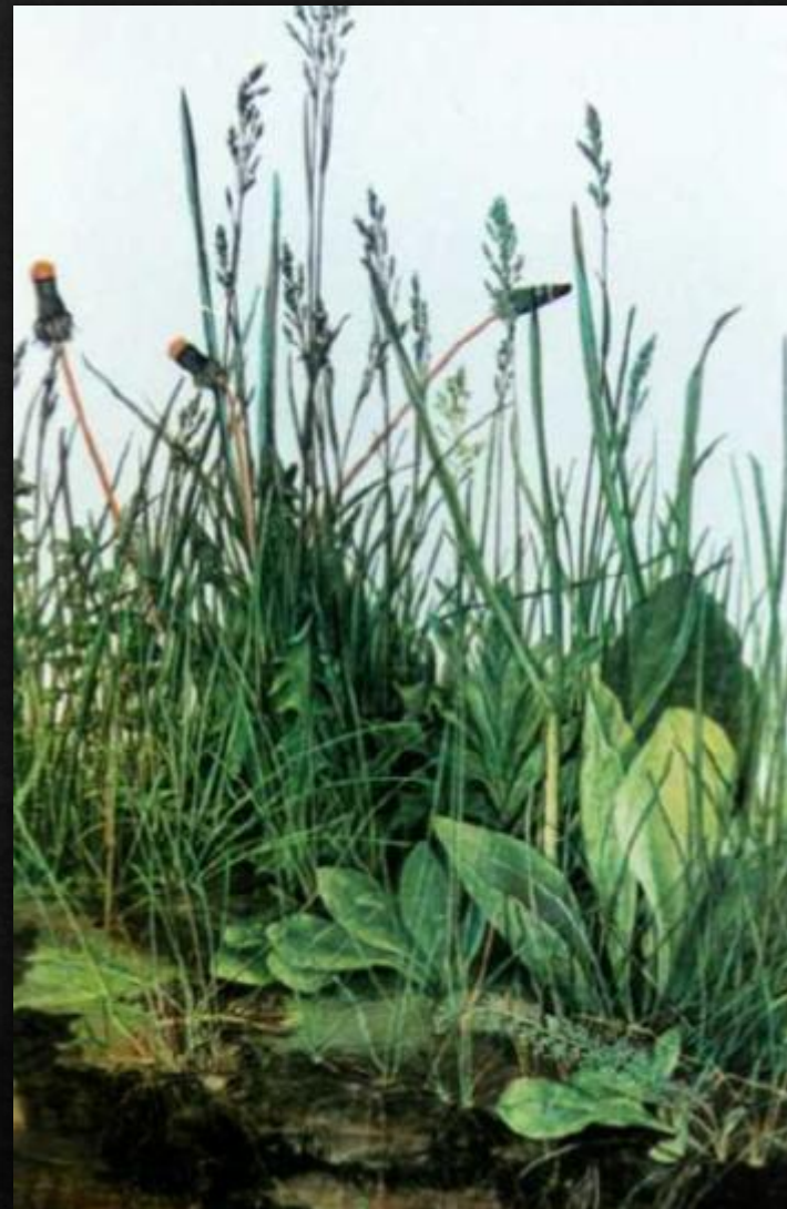
Кусок дёрна (1502)

Автор одних из первых в европейском искусстве акварельных пейзажей.