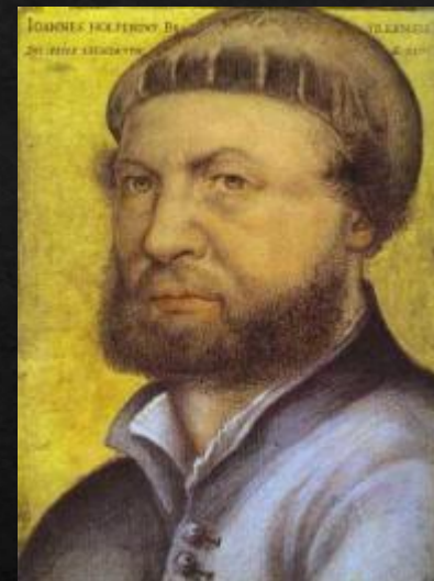
Ганс Гольбейн- младший