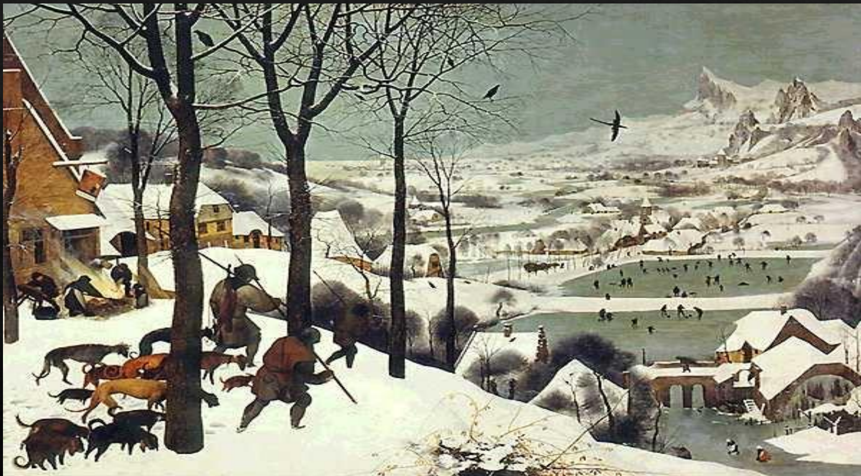
Охотники на снегу (1565)