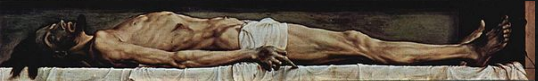
Мёртвый Христос в гробу (1521-1522)