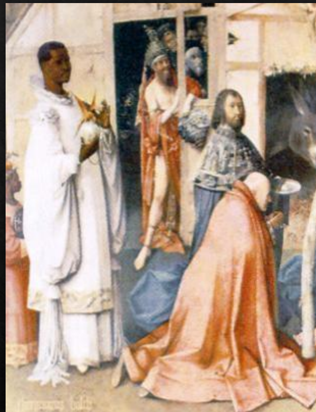
Поклонение волхвов. (1500)