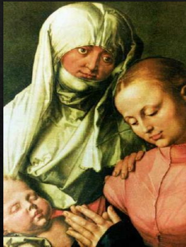
Святая Анна с Мадонной и младенцем (1519)