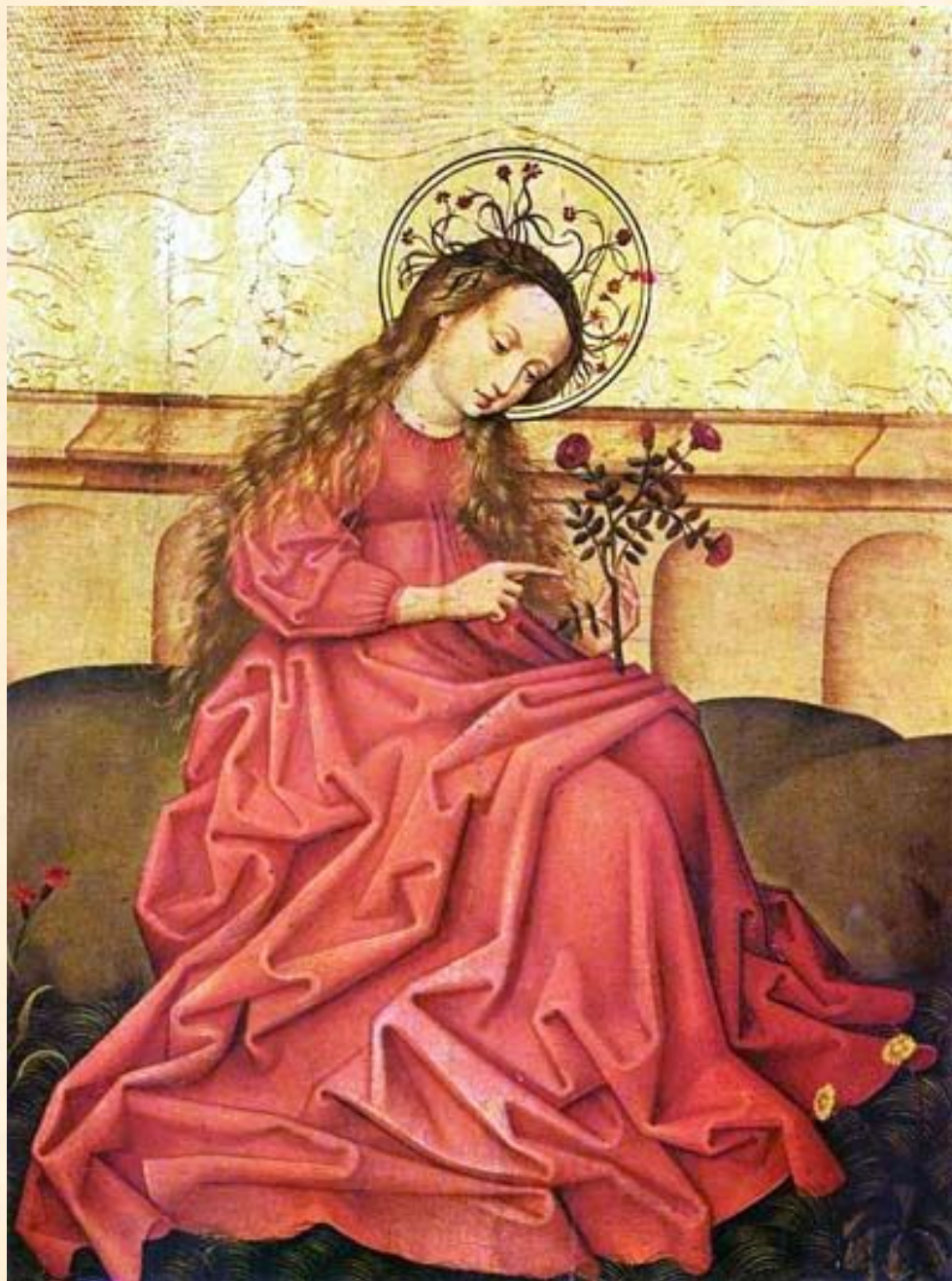
Мадонна в саду. Грюневальд