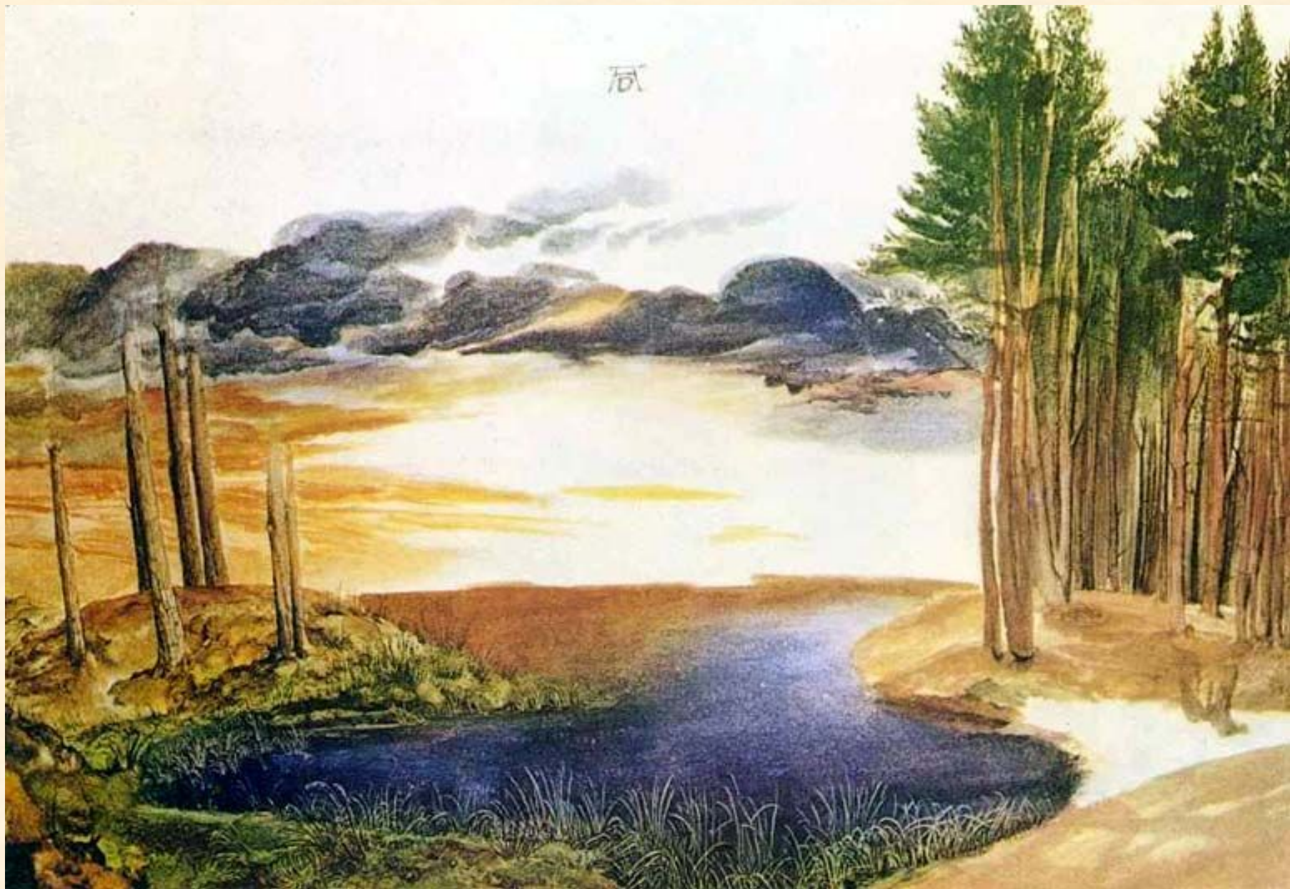
Лесной пруд. Дюрер