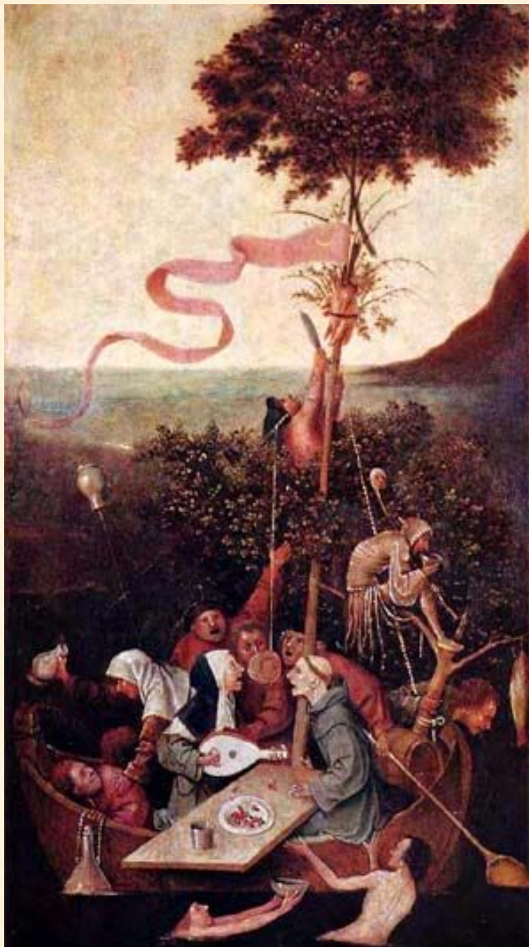
Корабль дураков. Босх