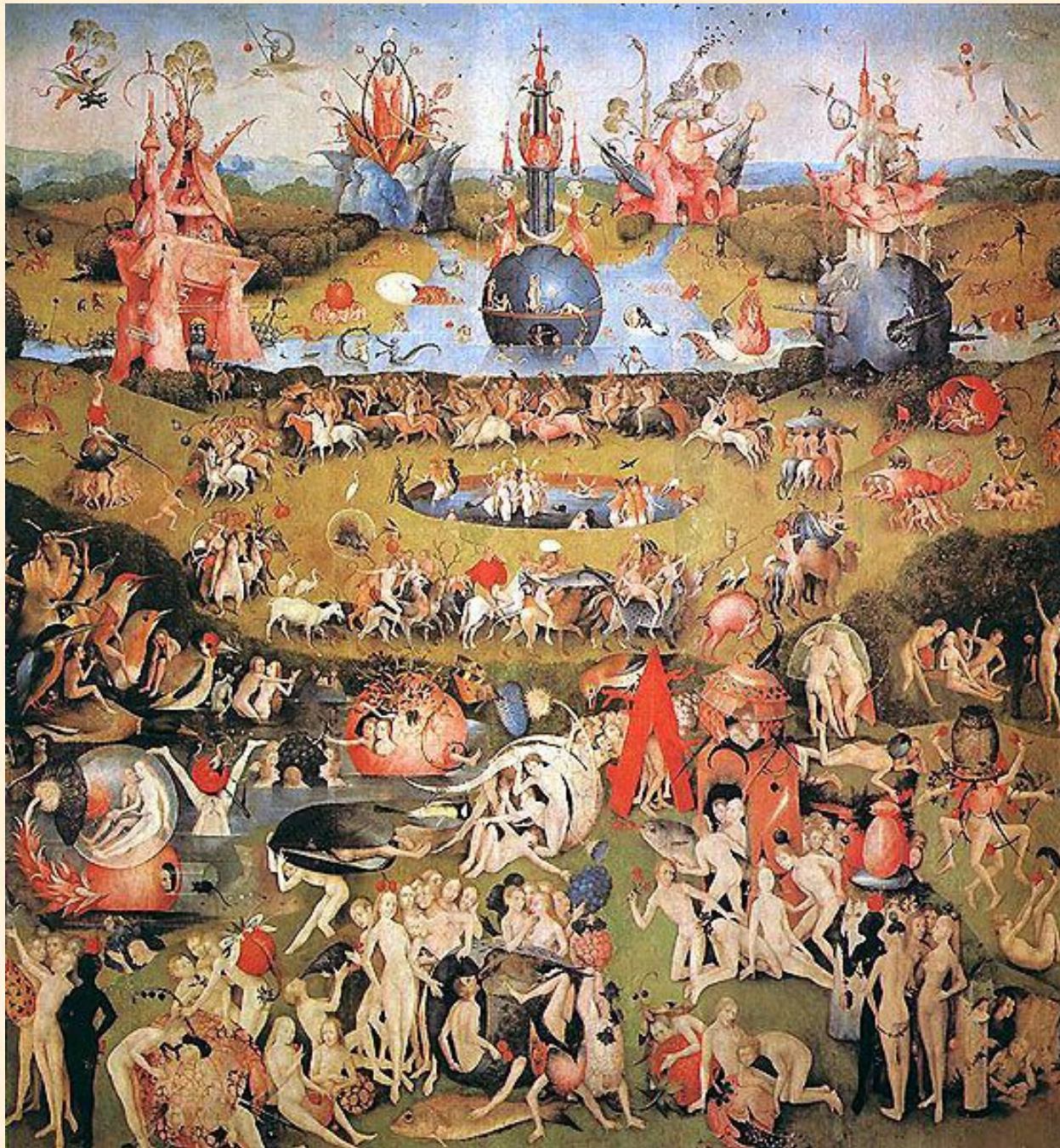
Сад земных наслаждений. Босх