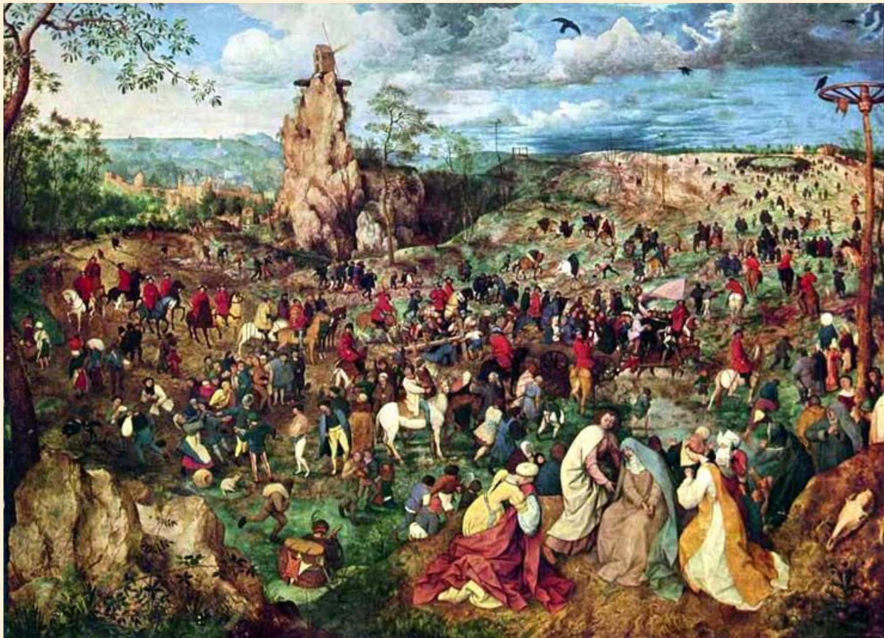
Несение креста. Брейгель