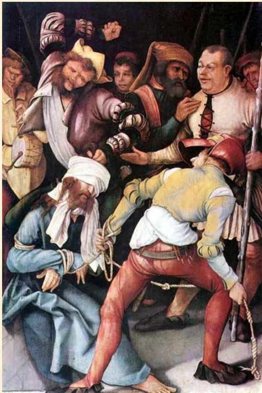
Осмеяние Христа. Грюневальд