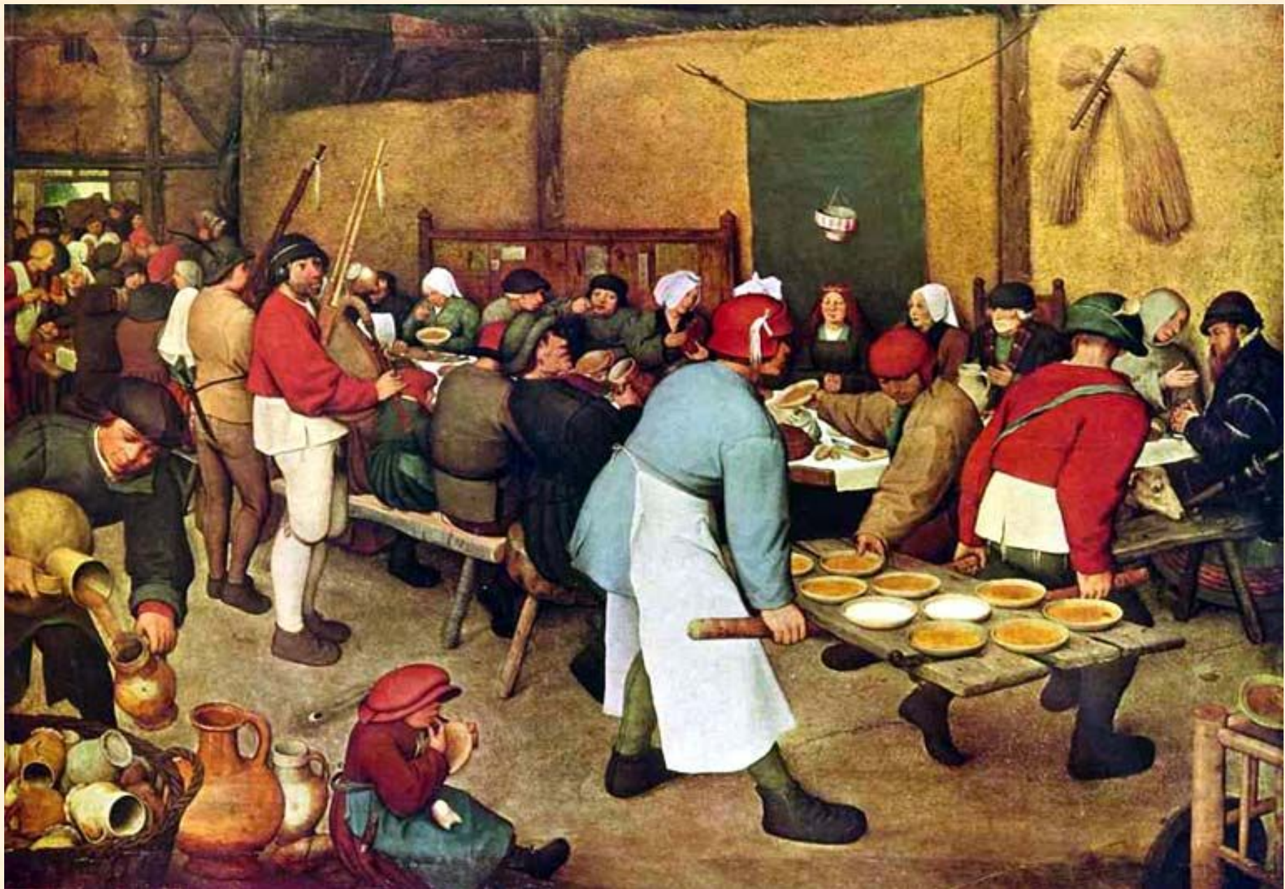
Крестьянская свадьба. Брейгель