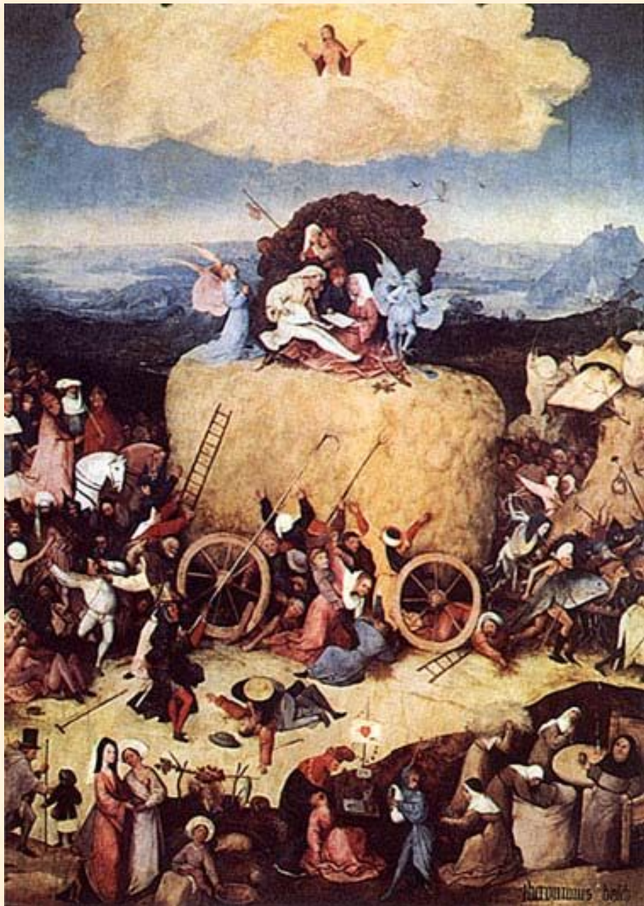
Воз сена. Босх