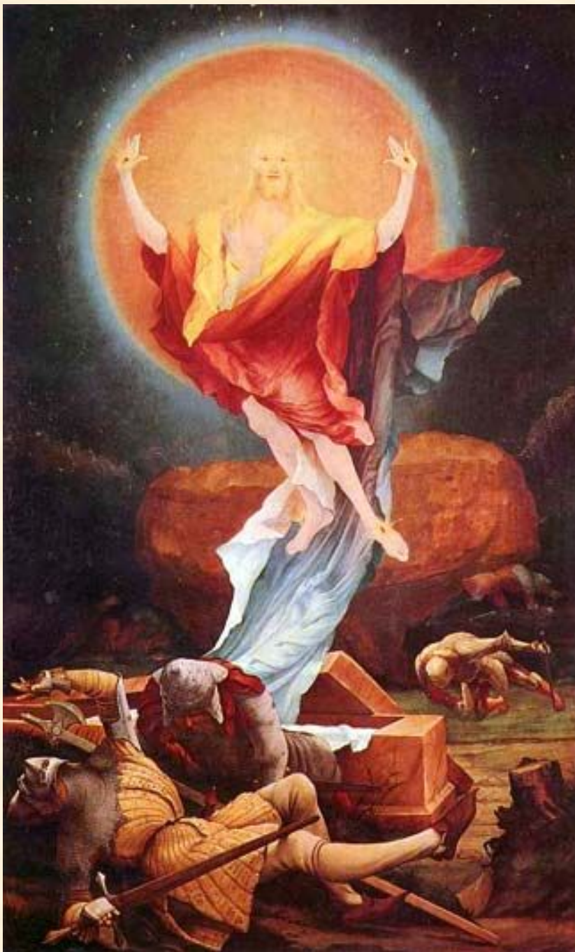
Воскресение Христа. Грюневальд