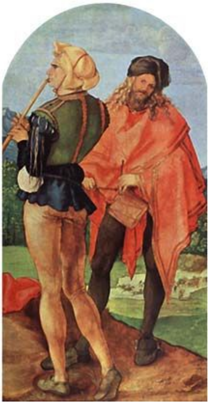
Барабаник и флейтист. Дюрер