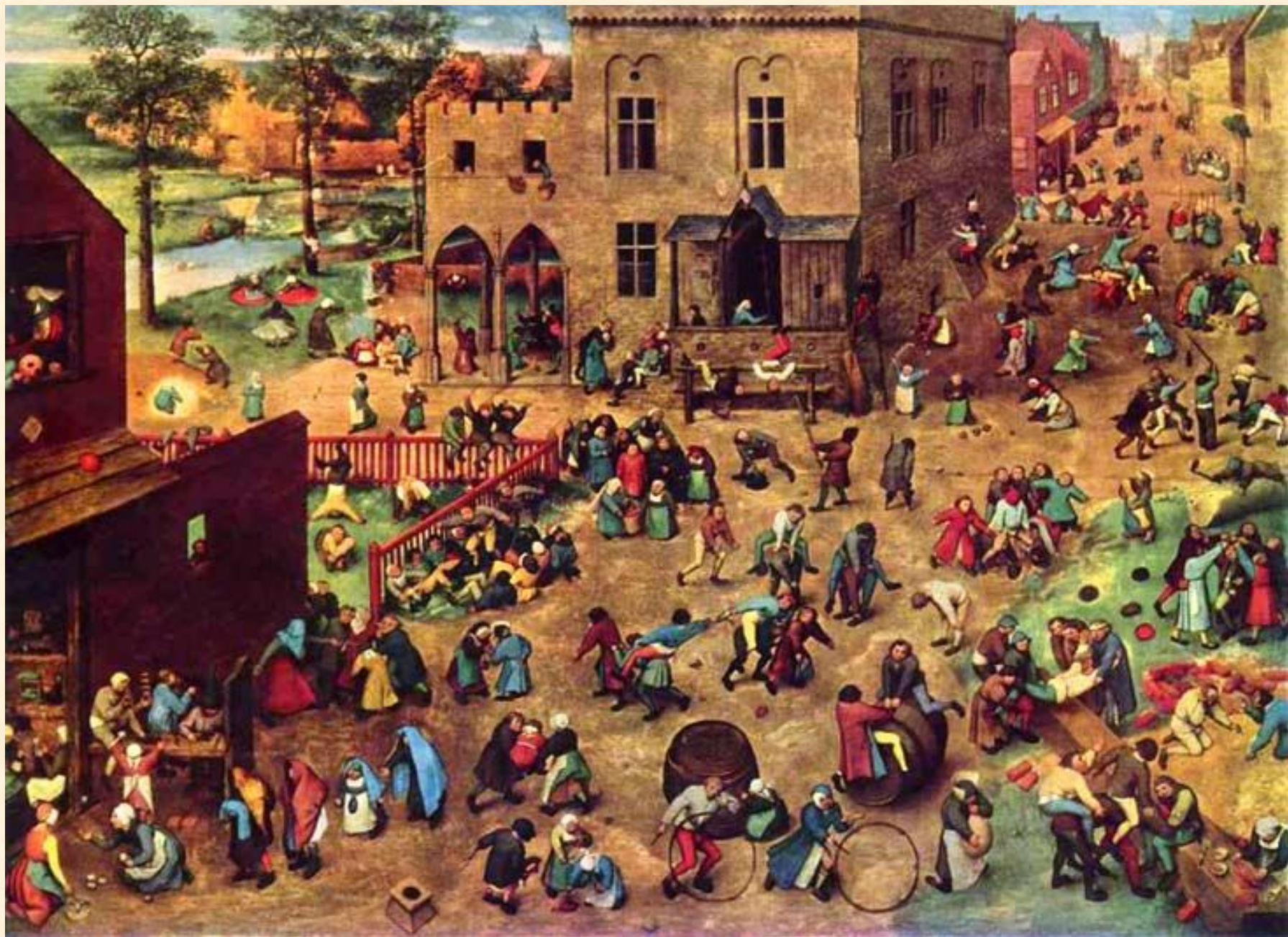
Игры детей. Брейгель