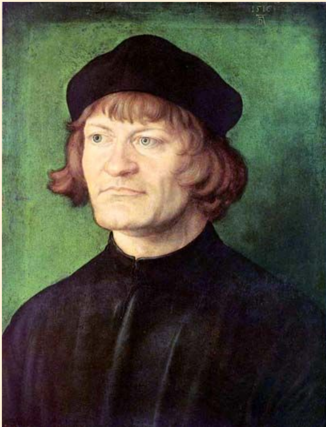
Портрет священника. Дюрер