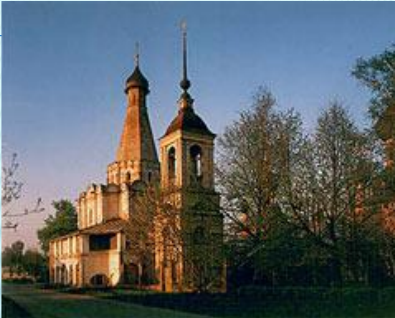
Церковь во имя митрополита Петра в Переславле Залесском