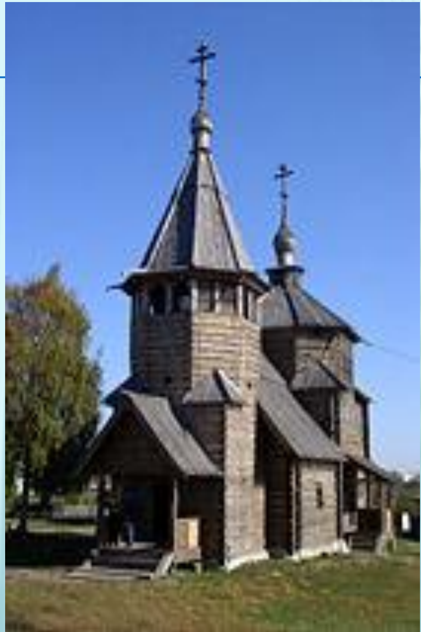
Воскресенская церковь из села Потакино

В шатровом зодчестве выделяли деревянные постройки и каменные. В русском деревянном зодчестве шатёр является распространенной, хотя далеко не единственной, формой завершения деревянных церквей. Так как с древнейших времен деревянное строительство на Руси было преобладающим, то большинство христианских храмов так же строилось из дерева. Типология церковной архитектуры перенималась Древней Русью из Византии. Однако в дереве чрезвычайно трудно передать форму купола — необходимого элемента храма византийского типа. Вероятно, именно техническими трудностями вызвана замена в деревянных храмах куполов шатровыми завершениями. Конструкция деревянного шатра проста, её устройство не вызывает серьёзных затруднений. Хотя самые ранние известные деревянные шатровые храмы относятся к XVI веку, есть основания думать, что и раньше в деревянном зодчестве была распространена форма шатра