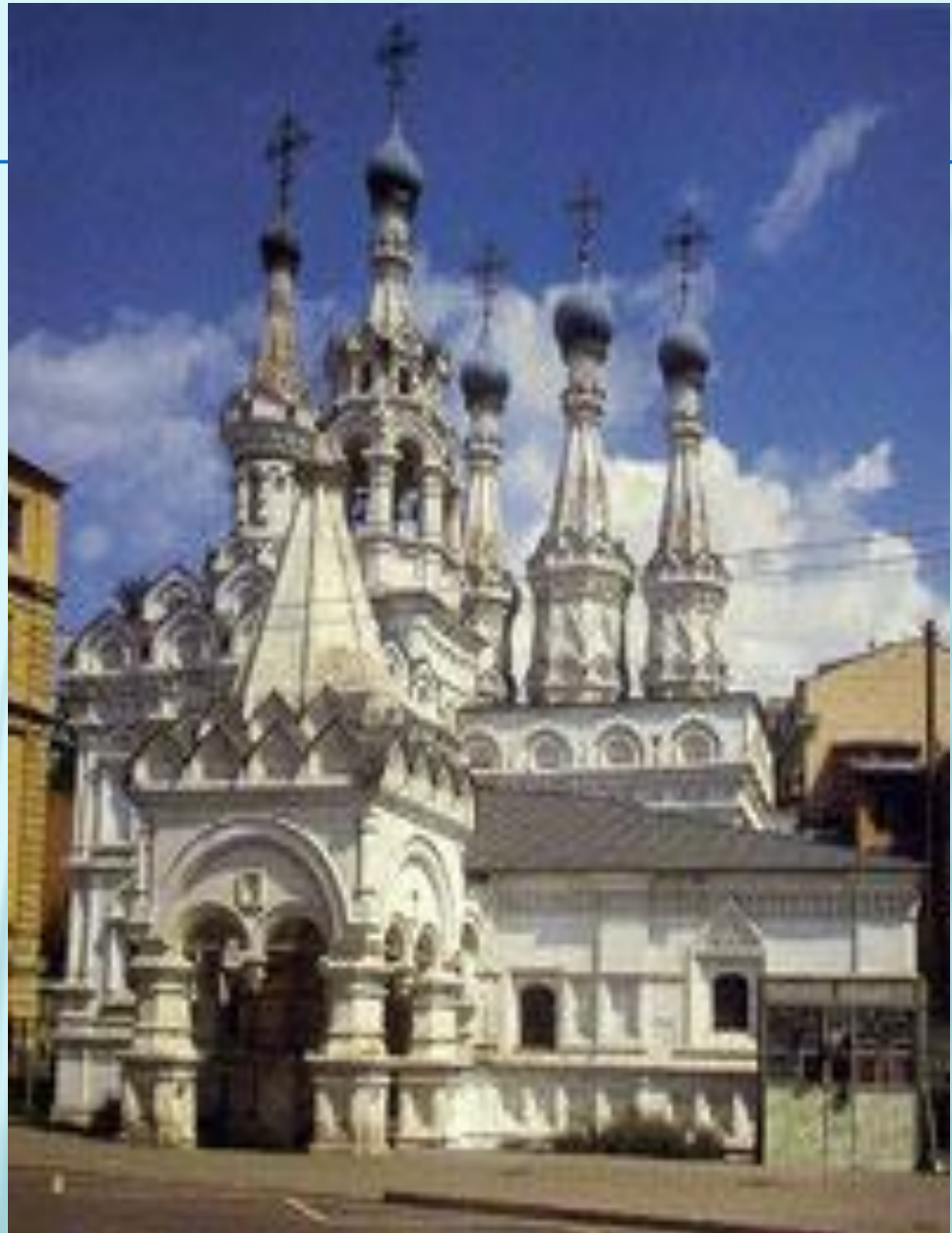
Церковь Рождества Богородицы в Путинках

Шатровое зодчество XVI–XVII вв., черпающее свое начало в традиционной русской деревянной архитектуре, является уникальным направлением русского зодчества, которому нет аналогов в искусстве других стран и народов. Шатровые храмы Московского государства – неповторимый вклад России в мировую культуру.