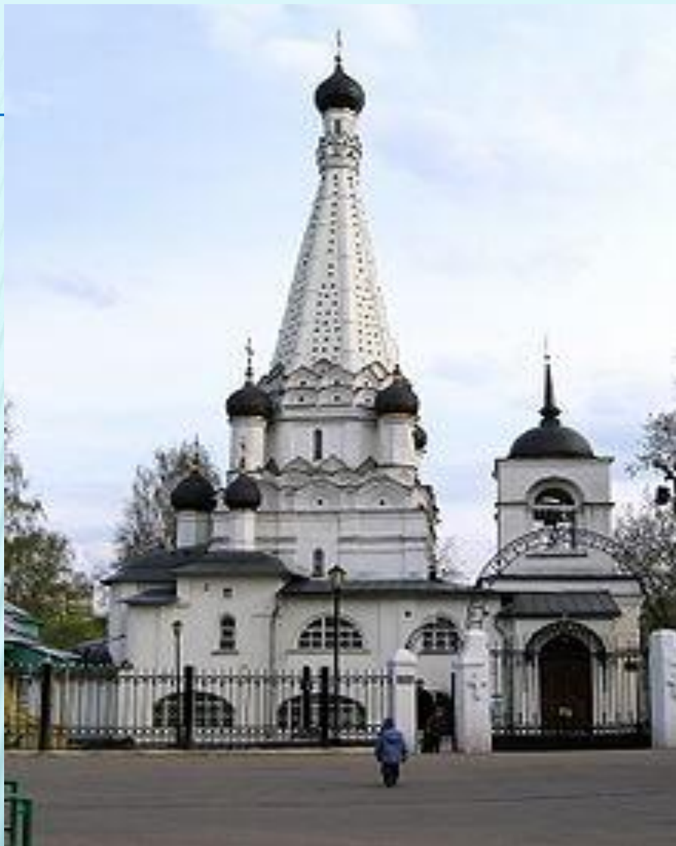
Церковь Покрова в Медведкове