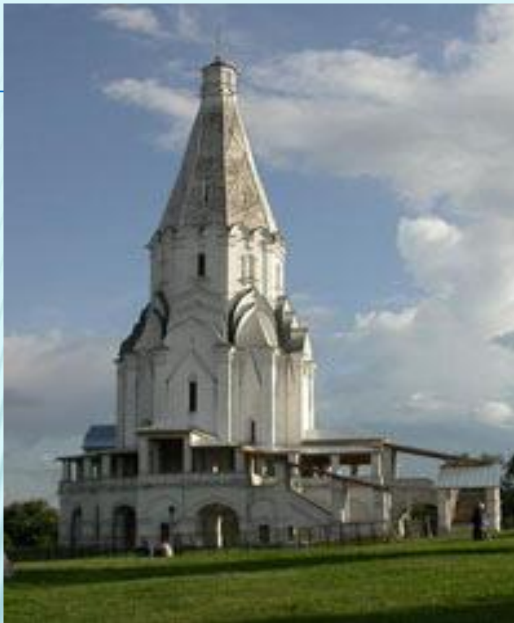
Храм Вознесения в Коломенском