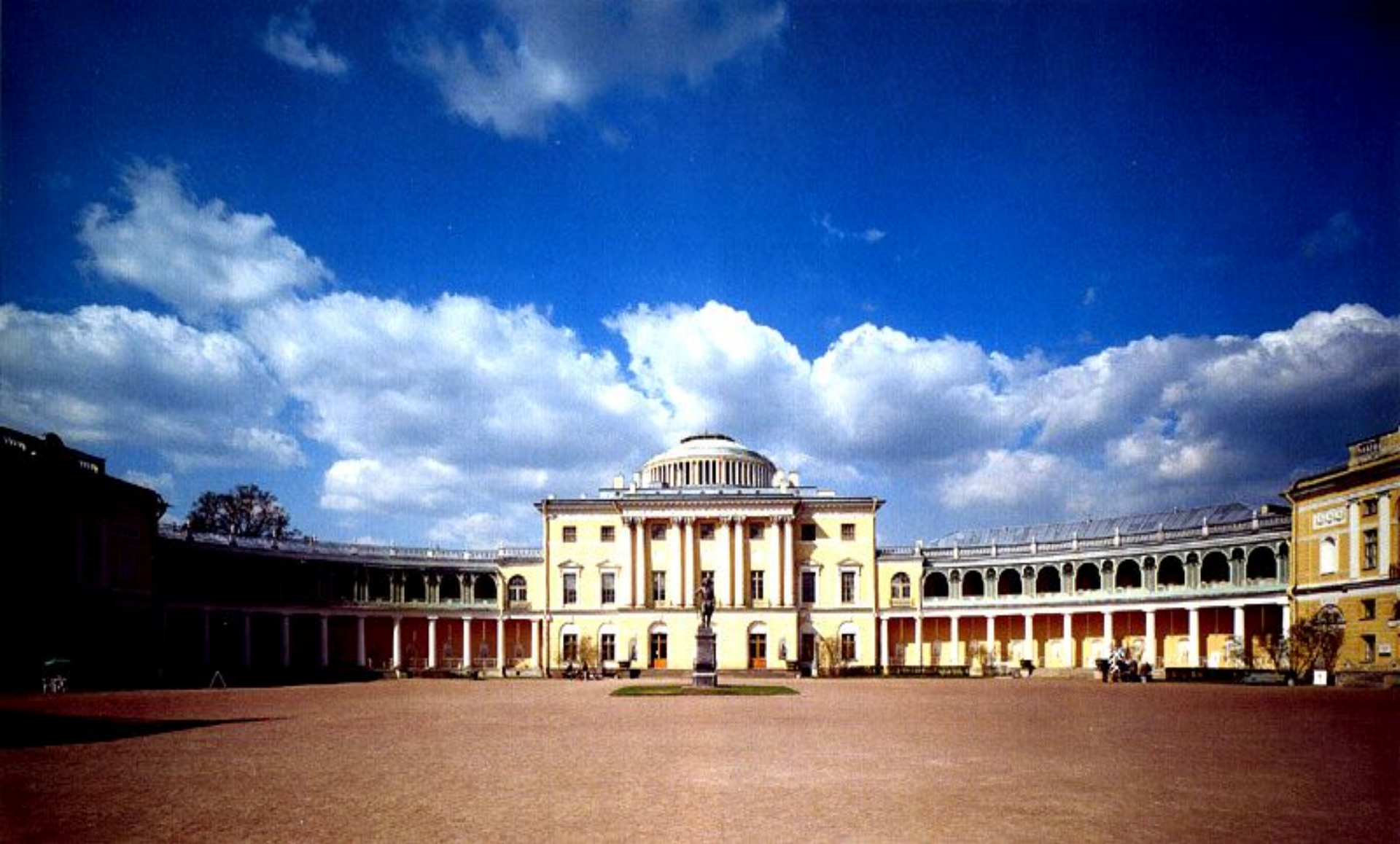
Дворец в Павловске Камерон Ч.