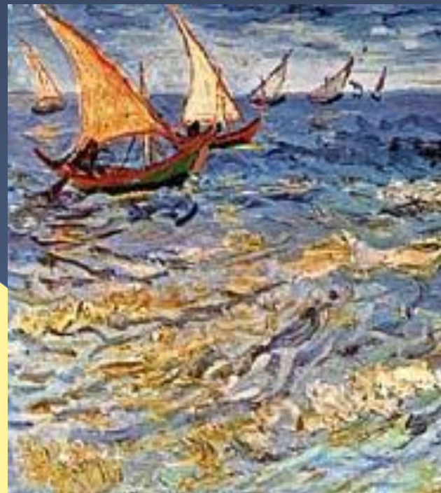
«Море в Сен-Мари». 1888.

Страстная эмоциональность, остродраматическое восприятие жизни, социальный протест, присущие искусству Ван Гога, выражались им в первой половине 1880-х годов в произведениях, выдержанных в сумрачной гамме, проникнутых сочувствием к простым людям; с 1888 создавал трагические образы в болезненно-напряженной, предельно экспрессивной манере, построенной на контрастах цвета, порывистого ритма, на свободной динамике пастозного мазка («Море в Сен-Мари», 1888 г.).