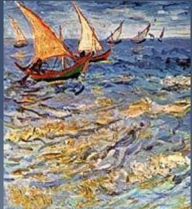
«Море в Сен-Мари». 1888.

Страстная эмоциональность, остродраматическое восприятие жизни, социальный протест, присущие искусству Ван Гога, выражались им в первой половине 1880-х годов в произведениях, выдержанных в сумрачной гамме, проникнутых сочувствием к простым людям; с 1888 создавал трагические образы в болезненно-напряженной, предельно экспрессивной манере, построенной на контрастах цвета, порывистого ритма, на свободной динамике пастозного мазка («Море в Сен-Мари», 1888 г.).