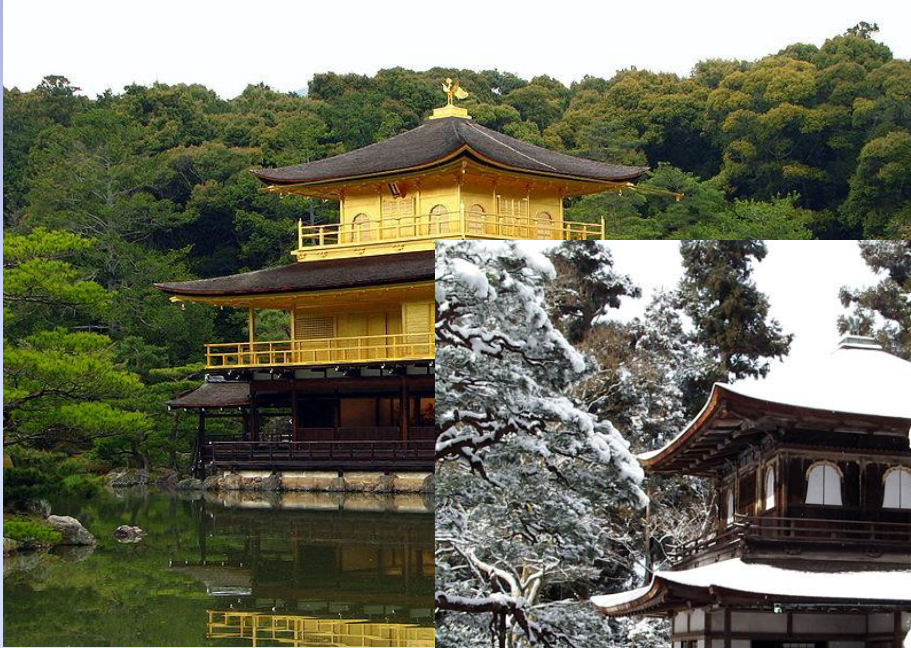
Кинкаку-дзи (Золотой павильон) Киото