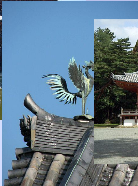
Украшение на крыше храма Хоодо