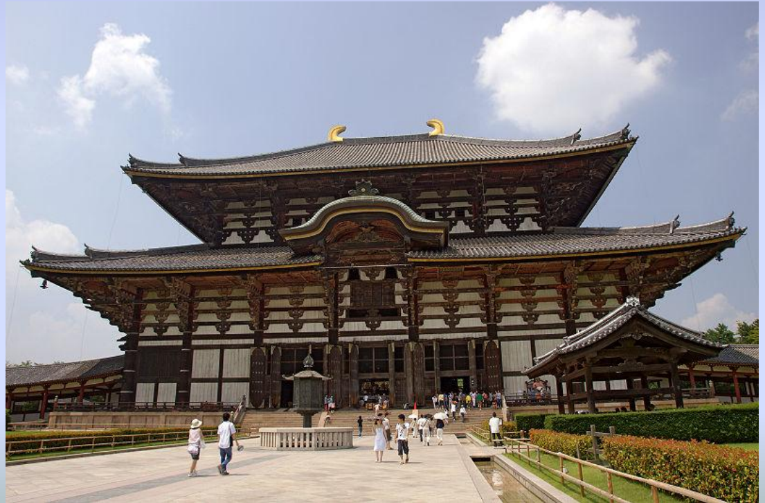
Главный зал храма Тодай-дзи, 745 год