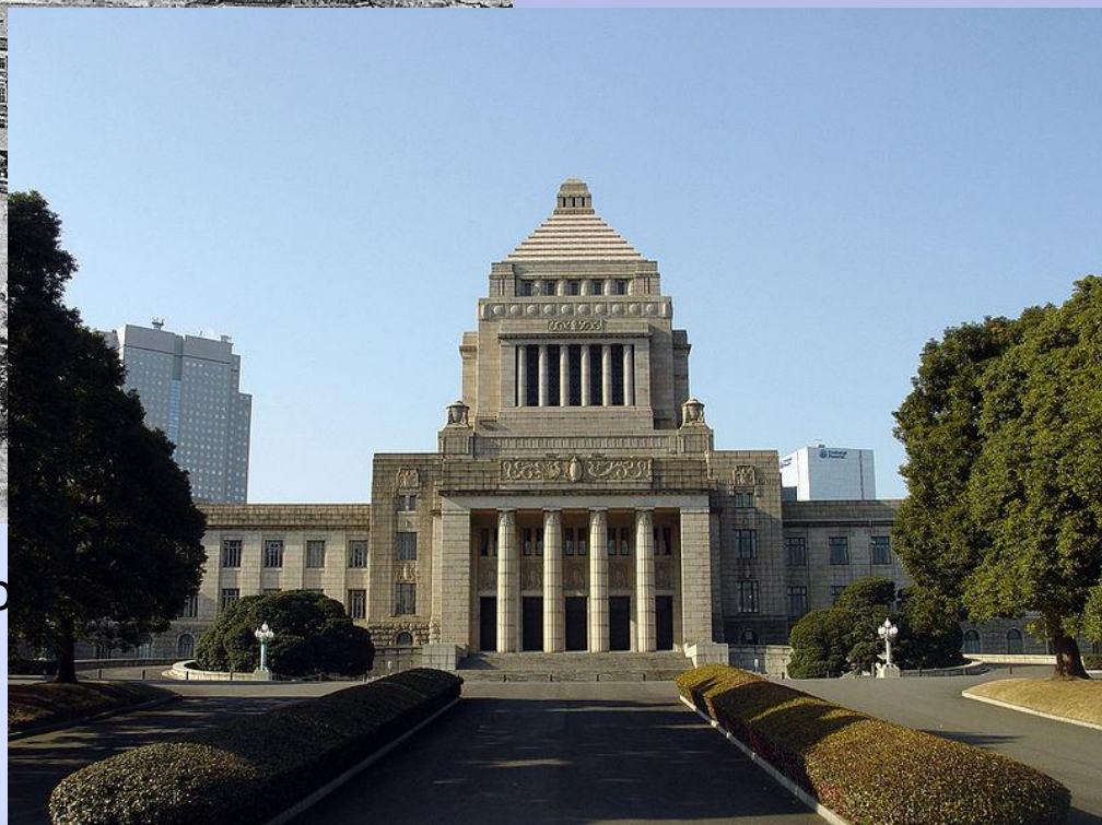
Здание Парламента Японии