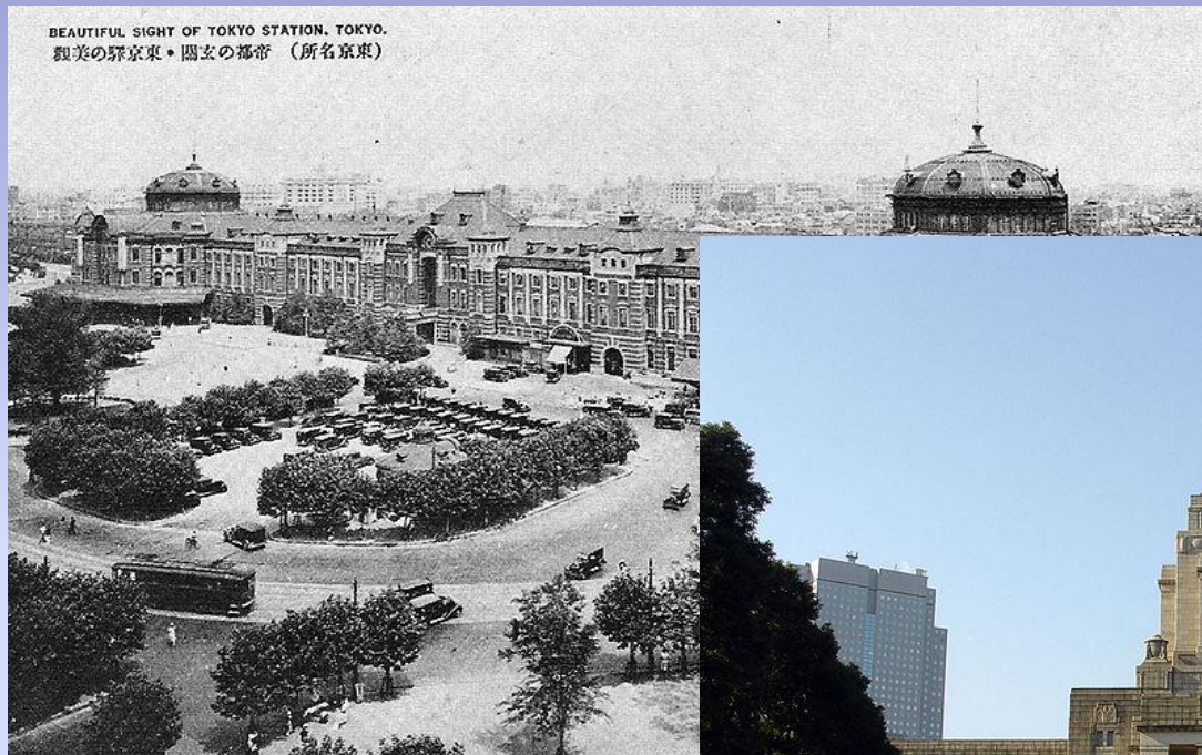
Здание вокзала Станция То