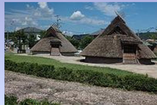
Реконструкция жилищ, город Сэтоути, префектура Окаяма