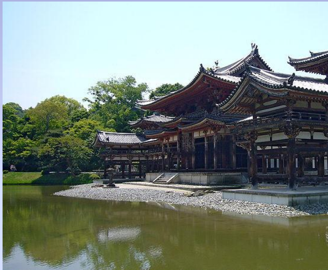
Храм Феникса (храм Хоодо) в монастыре Бёдо-ин