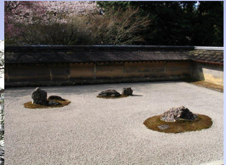
Сад камней в Рёан-дзи