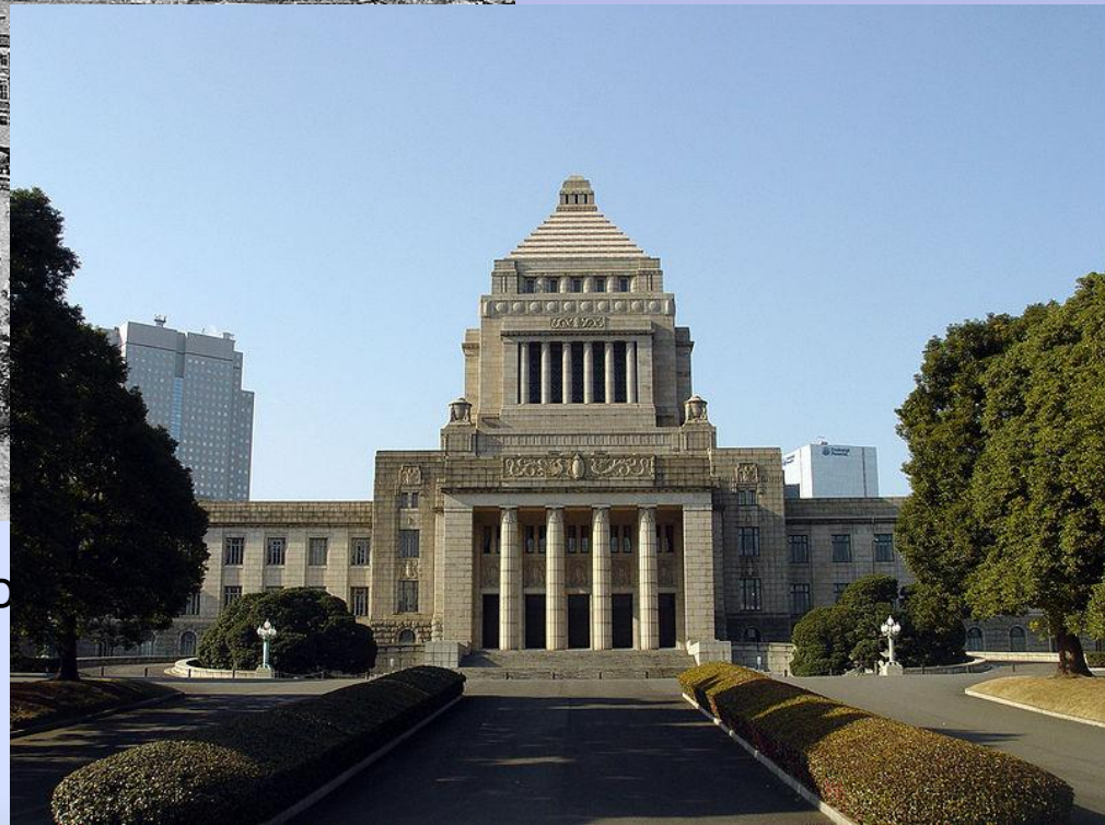
Здание Парламента Японии