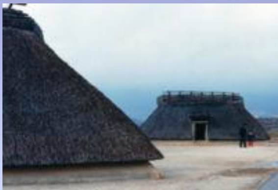
Примеры реконструированных зданий периода Яёй