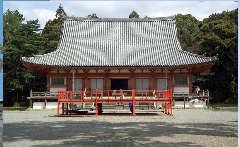
Храм Дайго-дзи в Киото