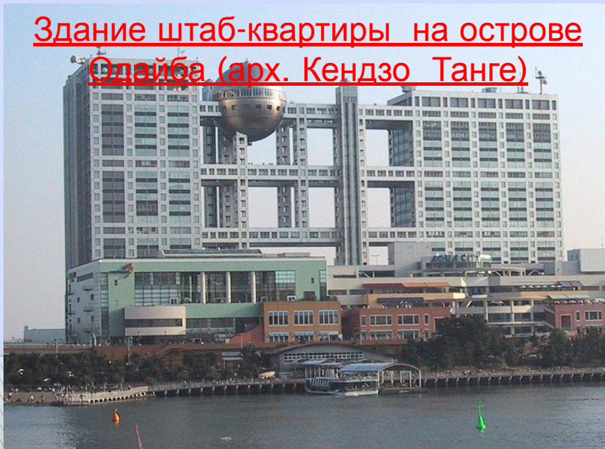
Здание штаб-квартиры на острове Одайба (арх. Кендзо Танге)