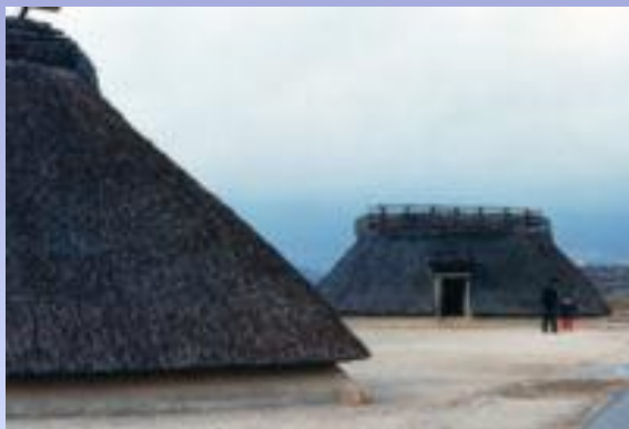
Примеры реконструированных зданий периода Яёй