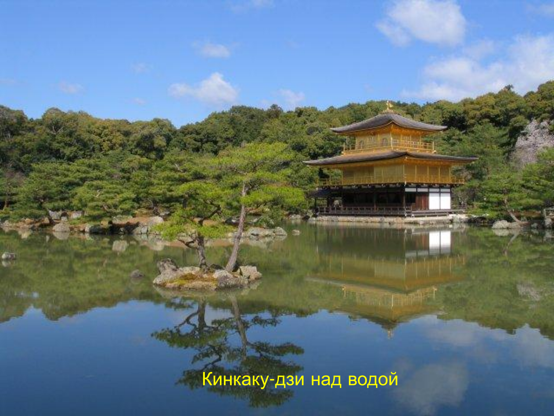
Кинкаку-дзи над водой