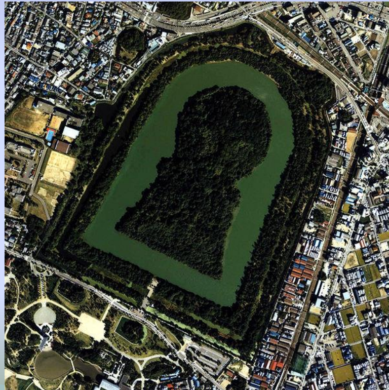
Курган императора Нинтоку, V век

В третьем веке н. э. с наступлением периода Кофун в районах Осаки и Нары в большом количестве сооружались огромные курганы, служившие гробницами для правителей и местной знати. В настоящее время в Японии обнаружено более 10 тыс. курганов. Эти сооружения имели круглую форму, позднее — форму замочной скважины и часто окружались рвами с водой по периметру. Один из самых известных сохранившихся курганов находится в городе Сакаи, префектура Осака, считается что это усыпальница императора Нинтоку. Это самый крупный курган в Японии, его размеры составляют 486 метров в длину и 305 метров в ширину.