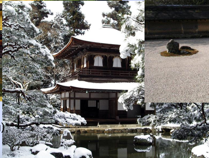
Гинкаку-дзи (Серебряный павильон)