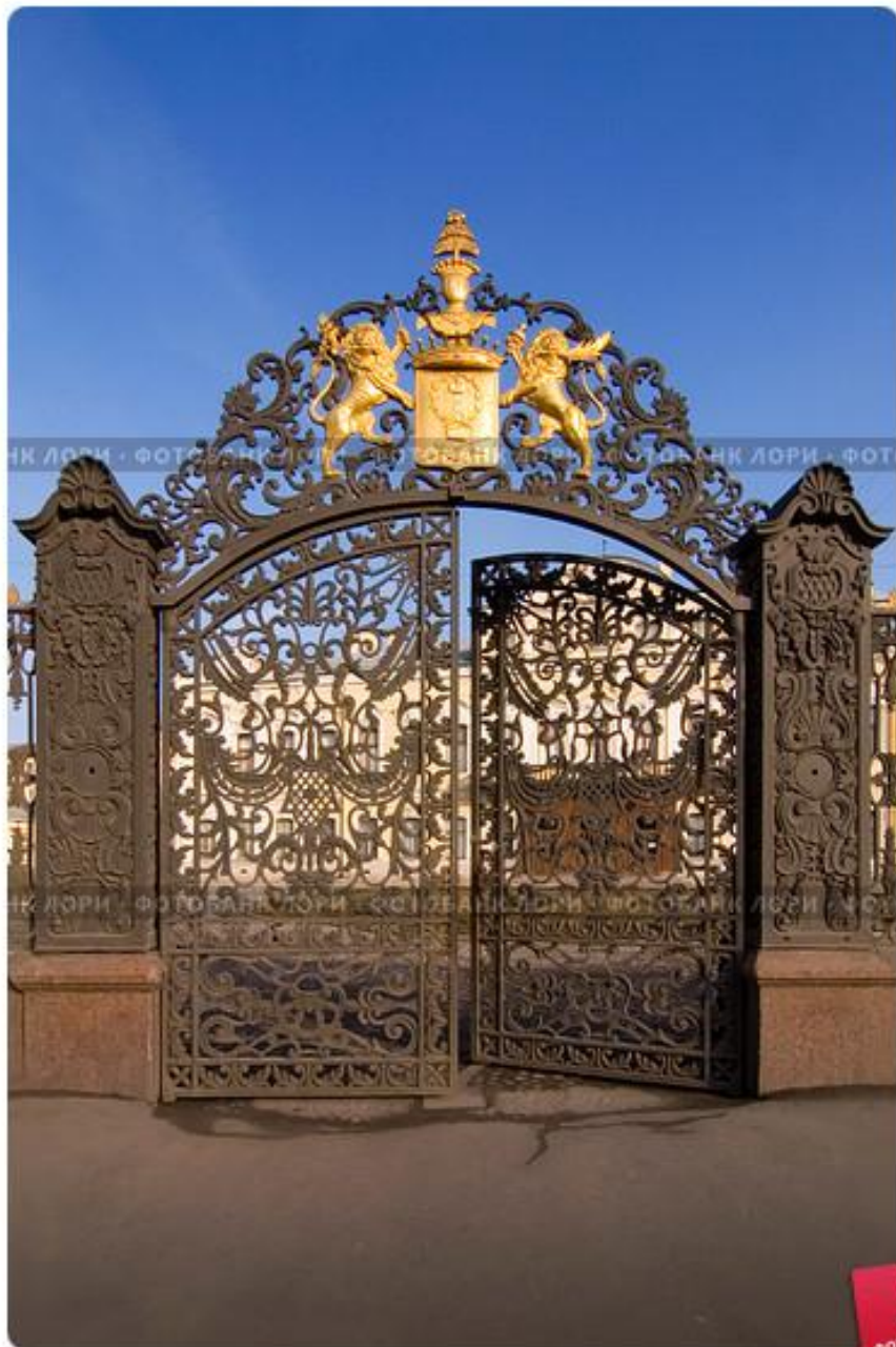
Ограда Шереметьевского дворца в Санкт-Петербурге

Вскоре, впрочем, слава графа Шереметева стала еще более громкой и приобрела скандальный оттенок. По городу пошли слухи о романе Шереметева с одной из его крепостных актрис, певицей Прасковьей Ковалевой, выступавшей на сцене под псевдонимом Жемчугова. Осуждение высшего общества и даже немилость императрицы Екатерины II не помешали Николаю Шереметеву дать Жемчуговой вольную и в конце концов сделать ее своей женой.