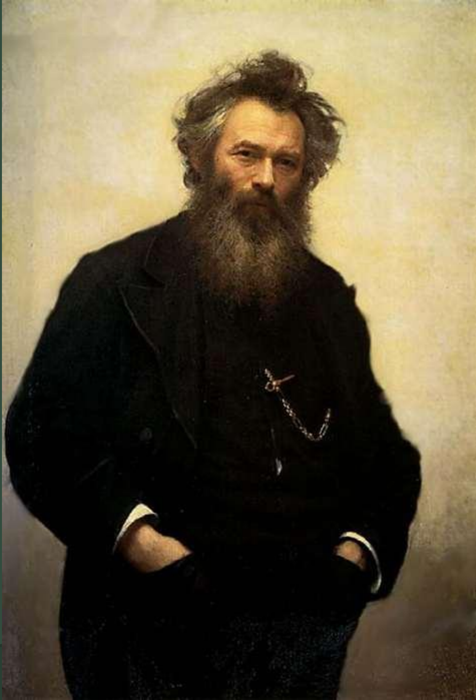
И.Крамской Портрет художника И. И. Шишкина 1880г Государственный Русский музей, Санкт-Петербург