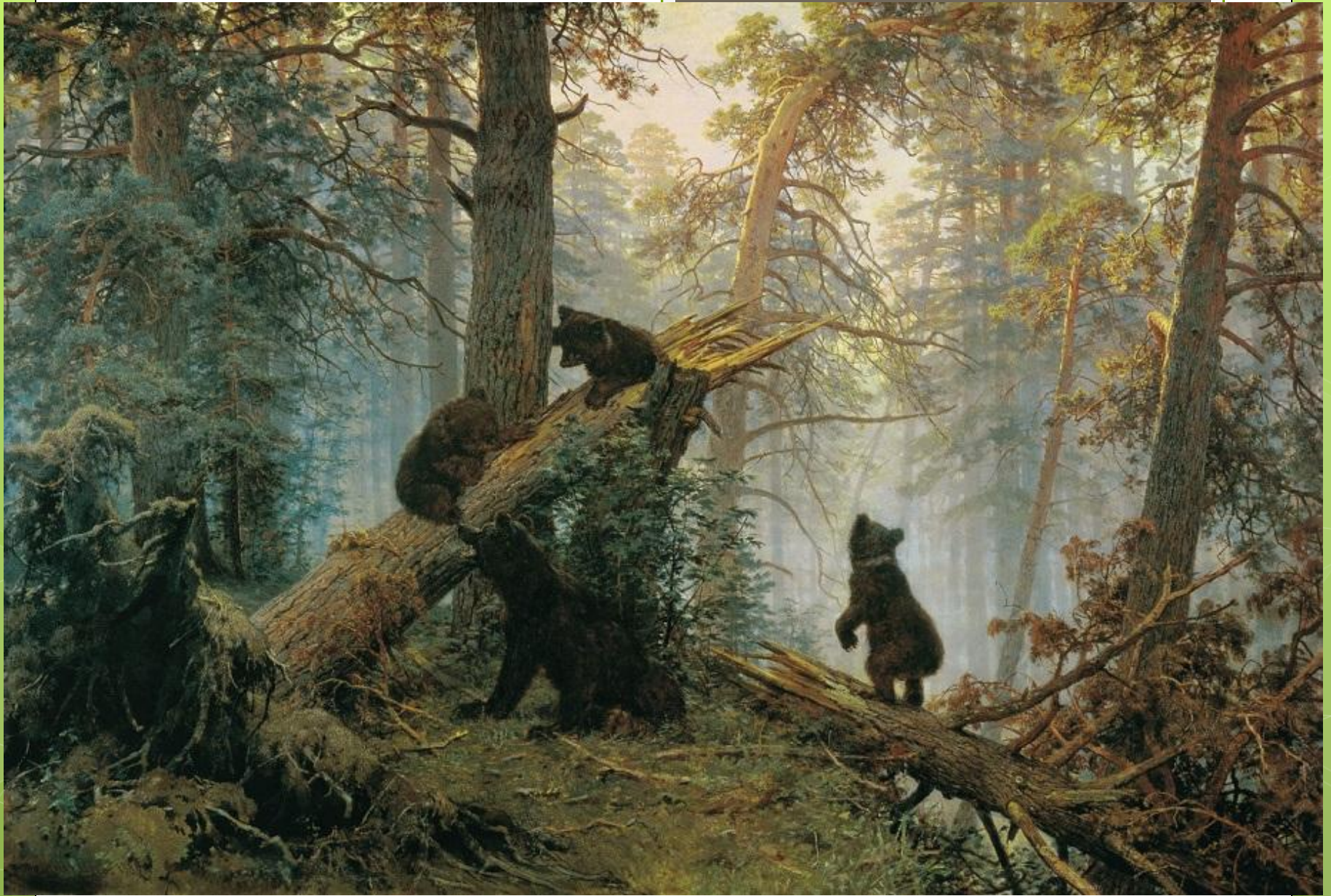
Утро в сосновом лесу, 1889 г.