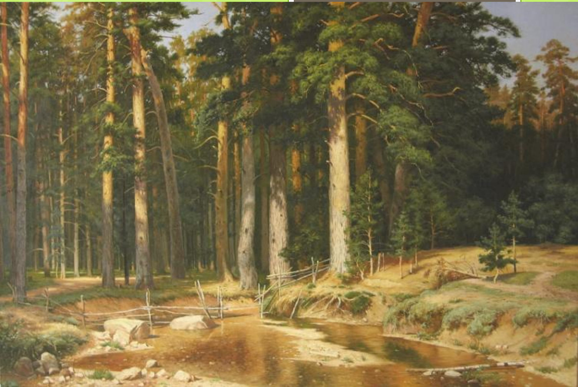
Корабельная роща, 1898 г.