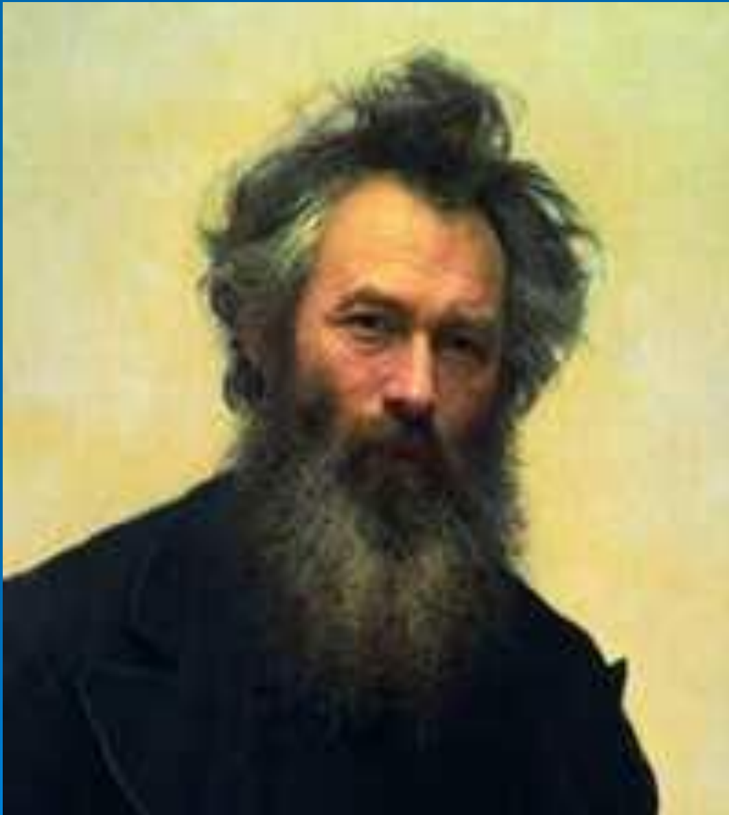
Шишкин Иван Иванович 1832-1898