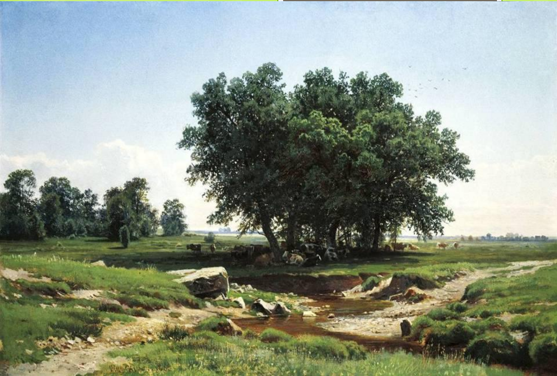
Дубки, 1886 г.