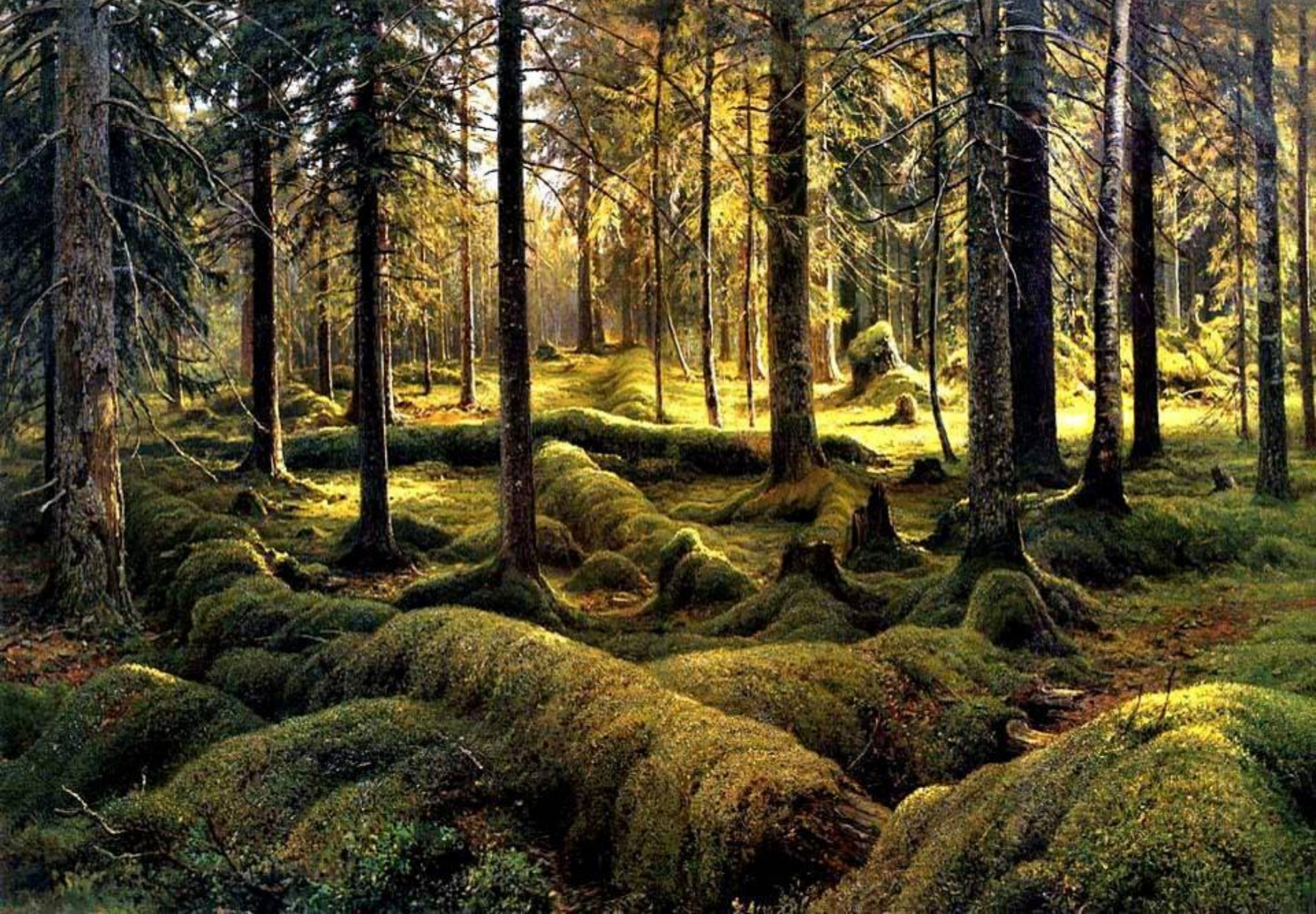
Лесное кладбище, 1893 г.