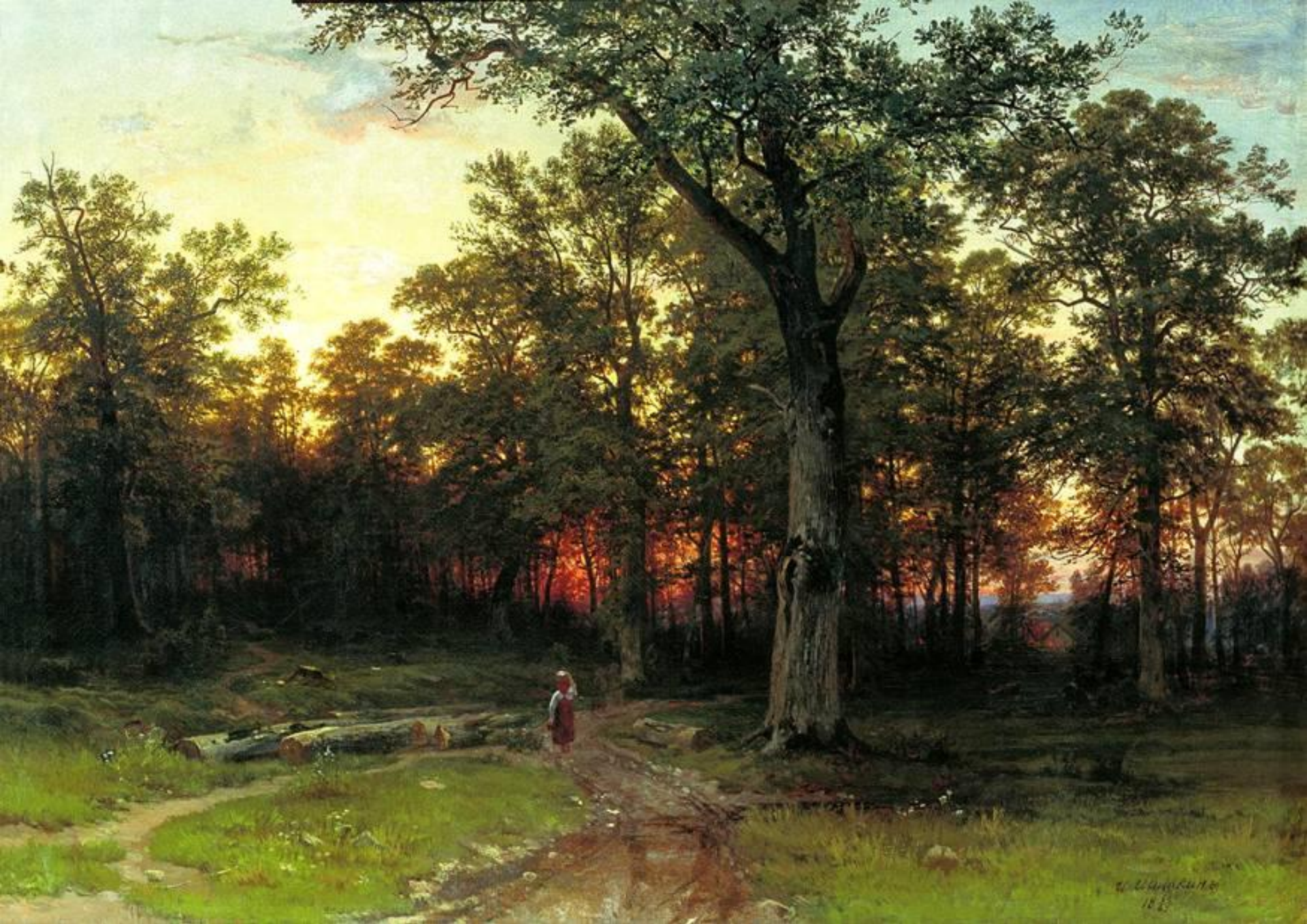
Лес вечером, 1869 г.