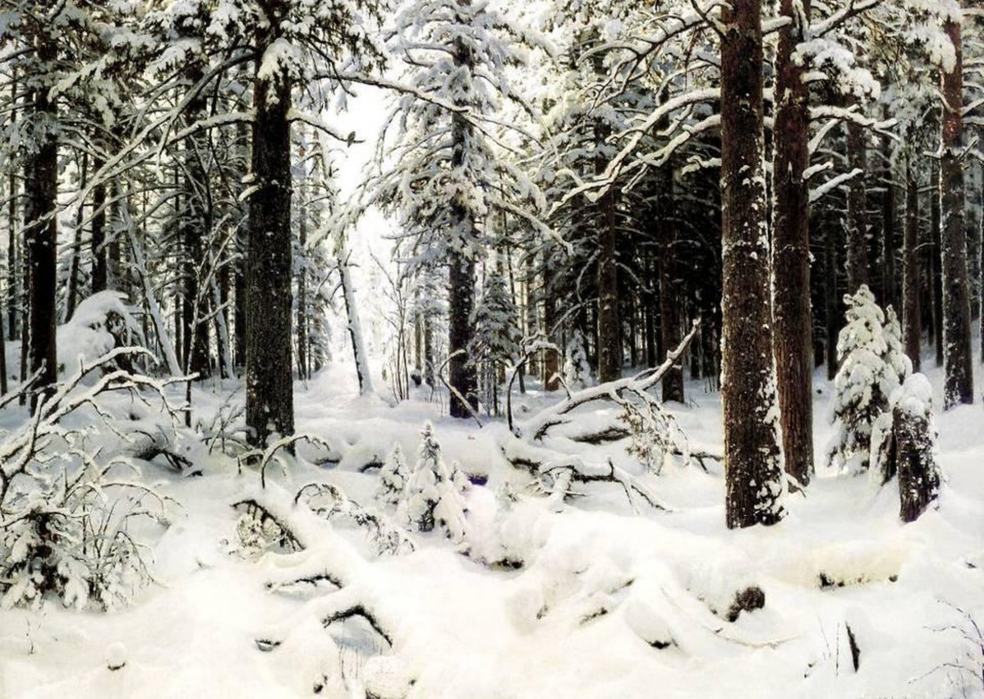
Зима, 1890 г.