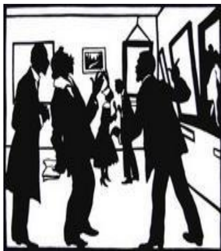
Е. Кругликова. На выставке «Мира искусства».

В России искусством силуэта особенно увлекались известные художники М. В. Добужинский , Е. С. Кругликова , Н.В.Ильин. В XX веке наиболее частой сферой бытования силуэта была книжная графика, иллюстрации. Сообщники "Мира искусства", возвращаясь к традициям русской культуры прошлых веков, оценили прелесть силуэтных изображений: появились изумительные силуэтные иллюстрации Г. Нарбута к сказкам Г. Андерсена и басням А. Крылова. Силуэт предстает в работах Сомова, Добужинского, Александра Бенуа, Остроумовой-Лебедевой, Кустодиева, Д. И. Митрохина, С. В. Чехонина, В. Н. Левитского.