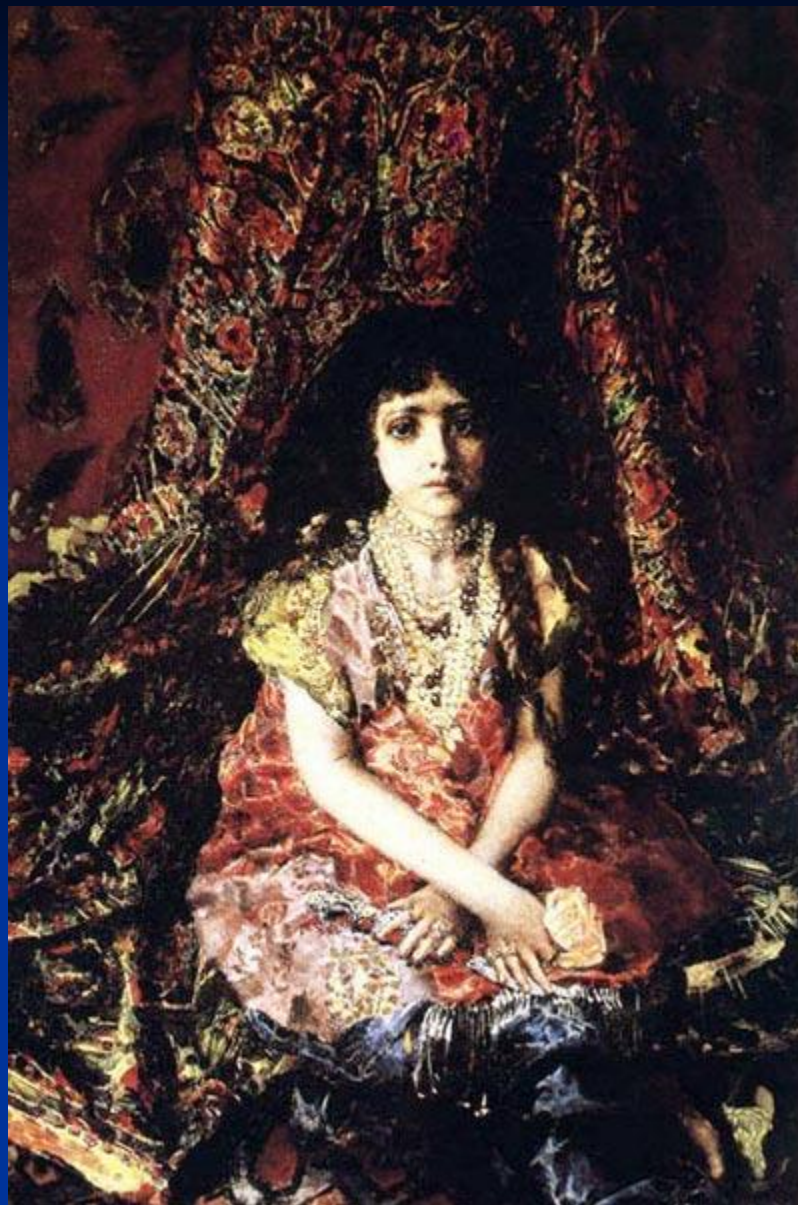
М. Врубель. «Девочка на фоне персидского ковра».