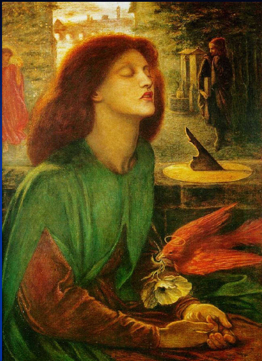
Д. Г. Россетти. «Благословенная Беата».