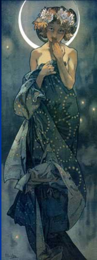
А. Муха. Из серии «Звёзды». «Лунное сияние».