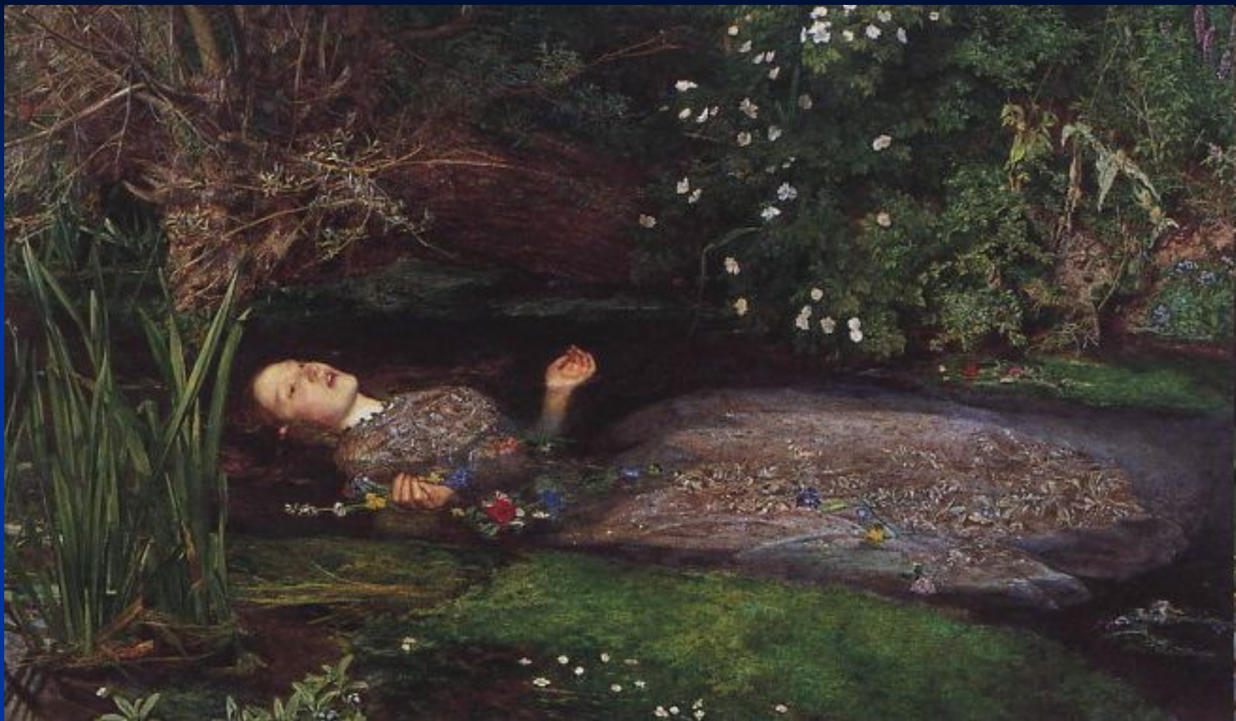
Д. Миллес. «Офелия».