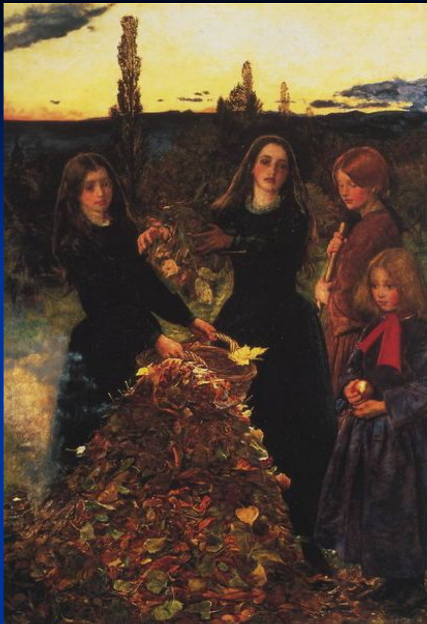
Д. Миллес. «Осенние листья».