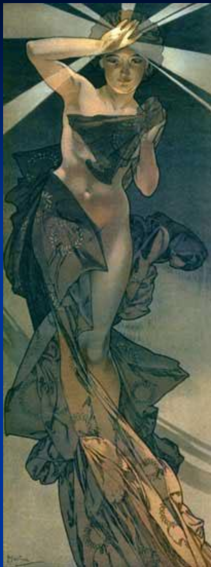
А. Муха. Из серии «Звёзды». «Утренняя звезда».