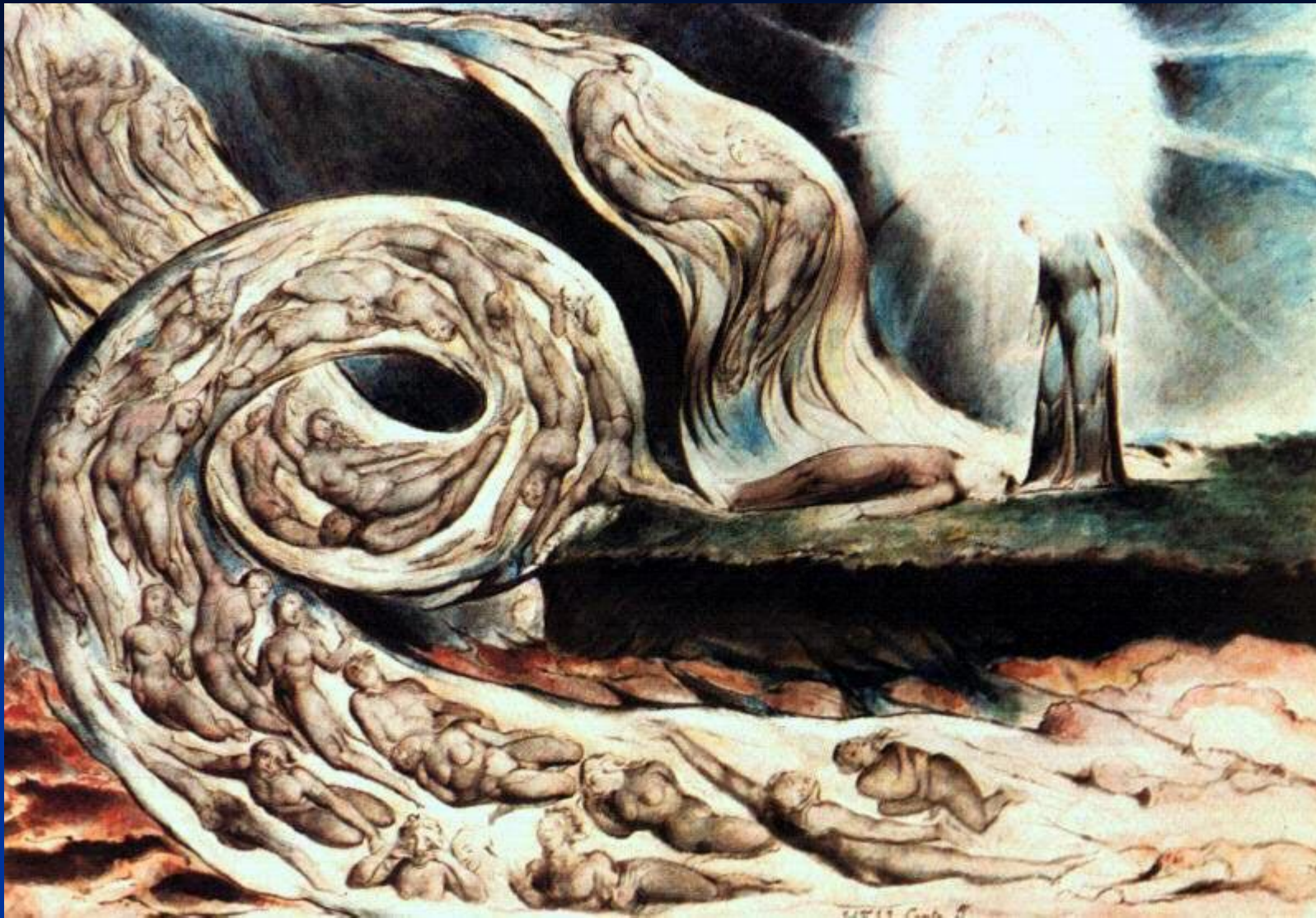
У. Блейк. «Вихрь любовников».