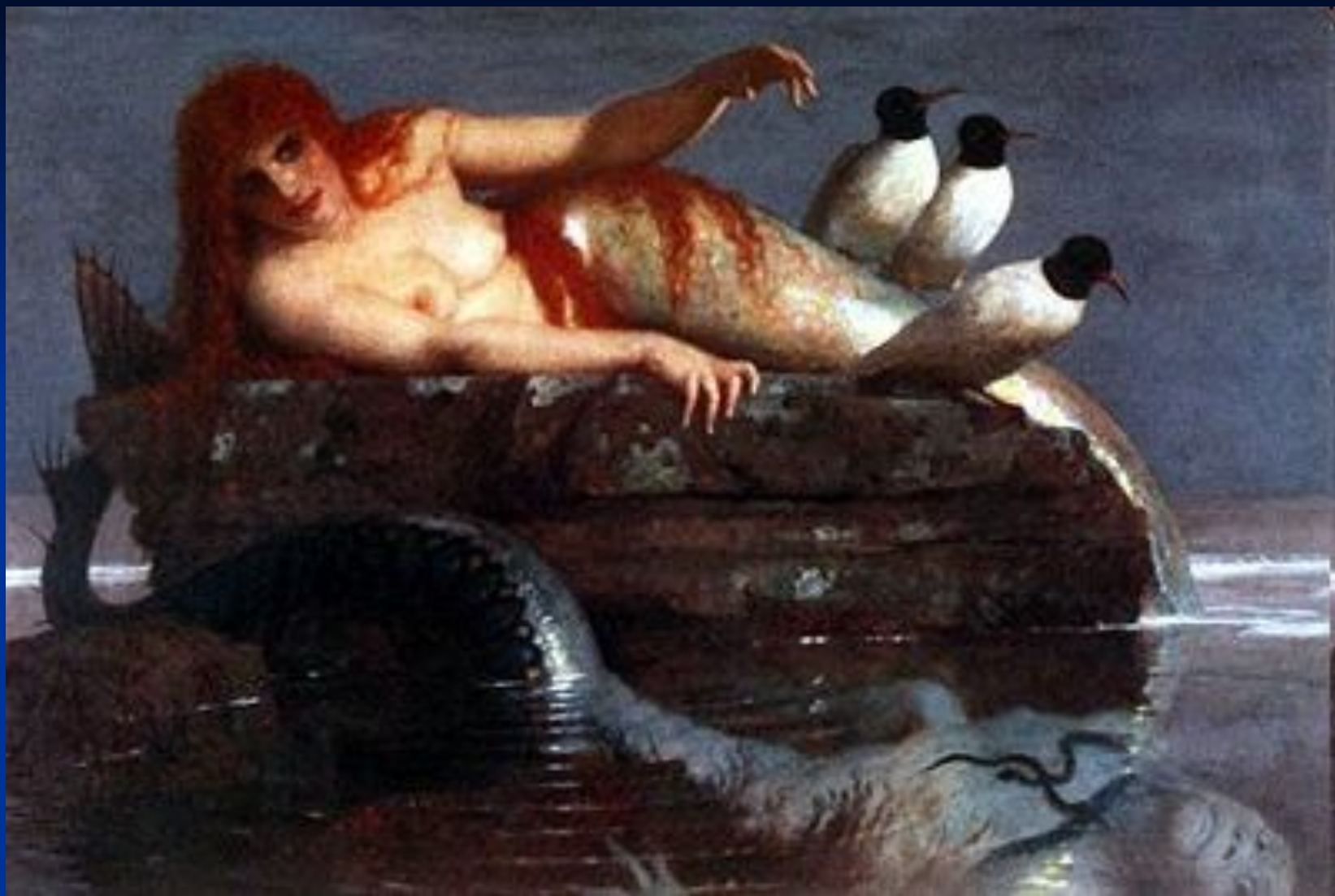
А. Бёклин. «Тихое море».