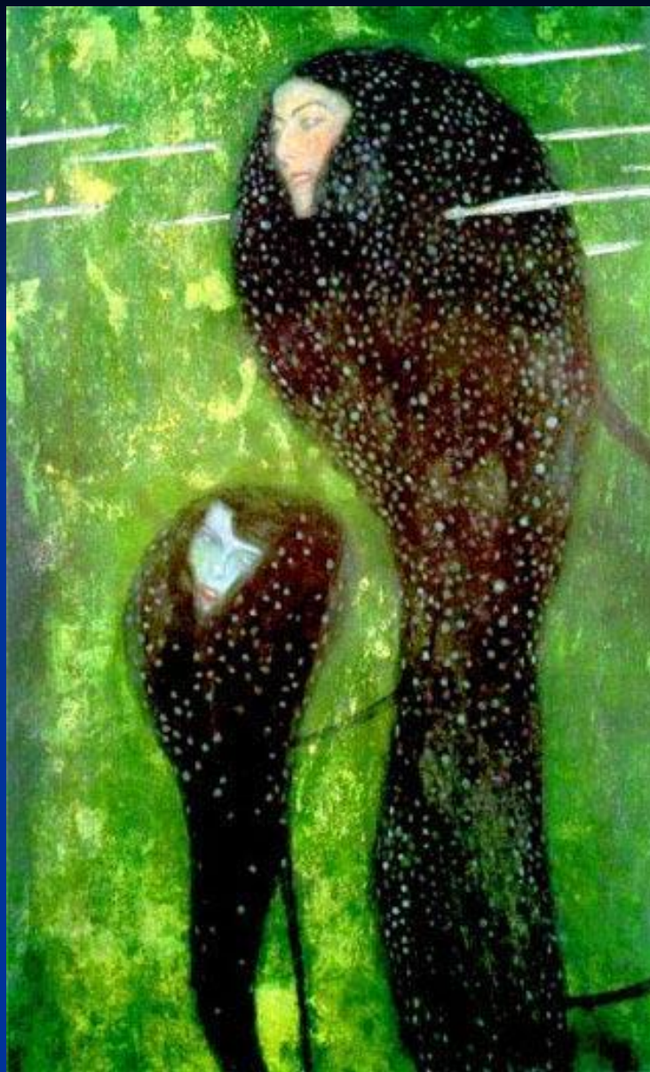
Г. Климт. «Русалки».