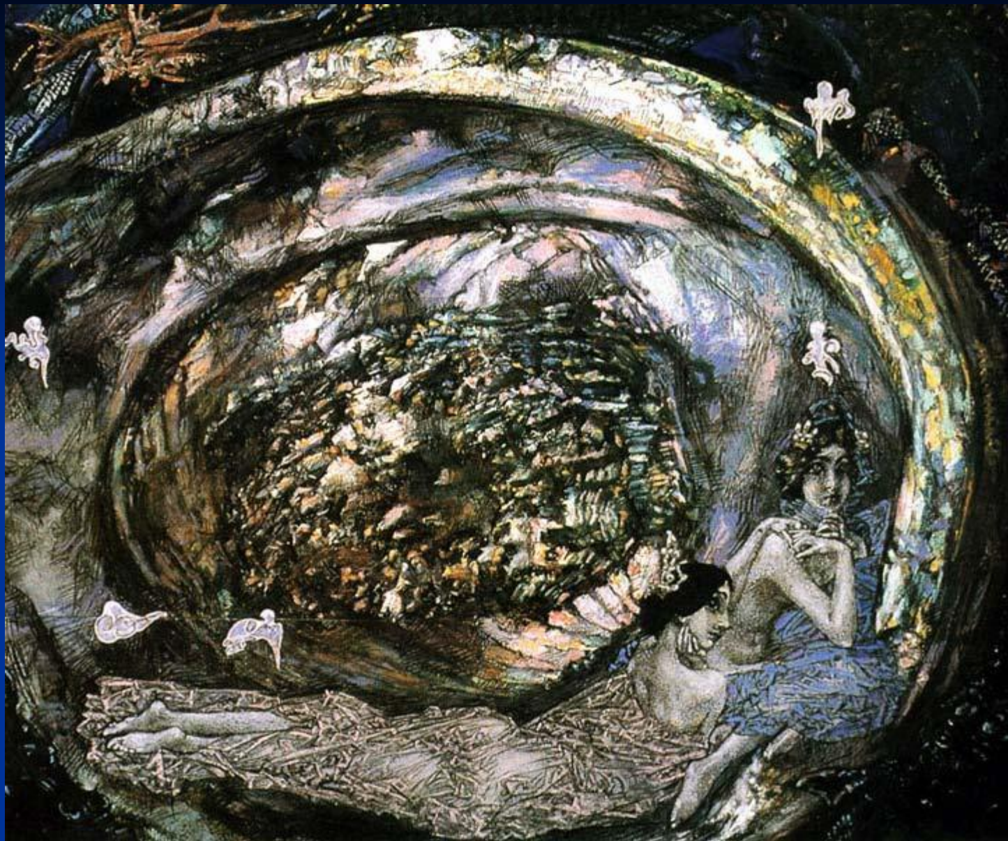
М. Врубель. «Жемчужина».