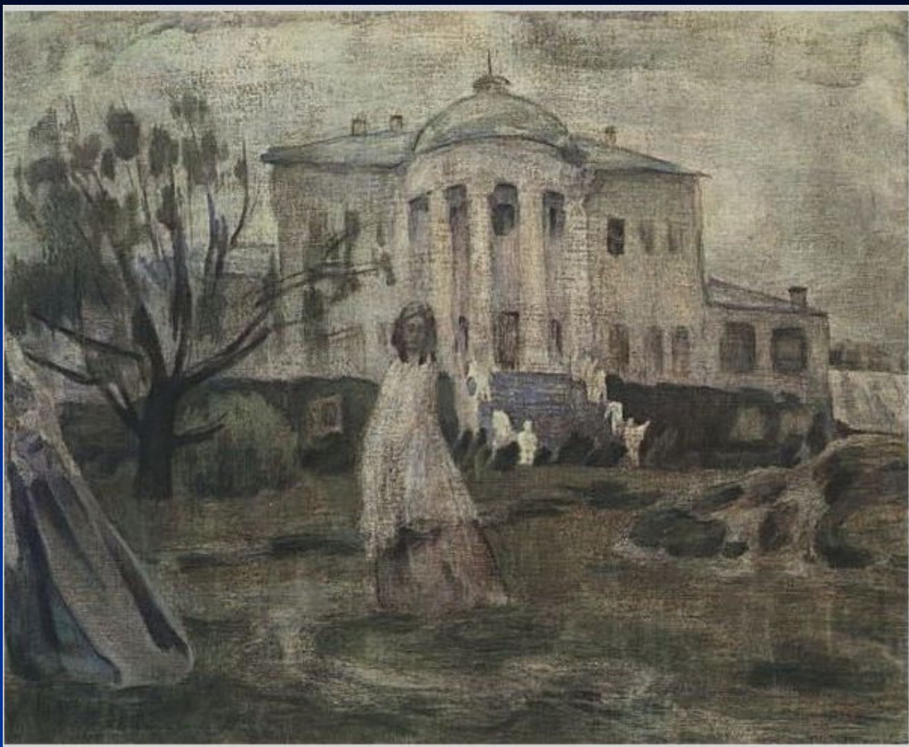
В. Борисов-Мусатов. «Призраки».