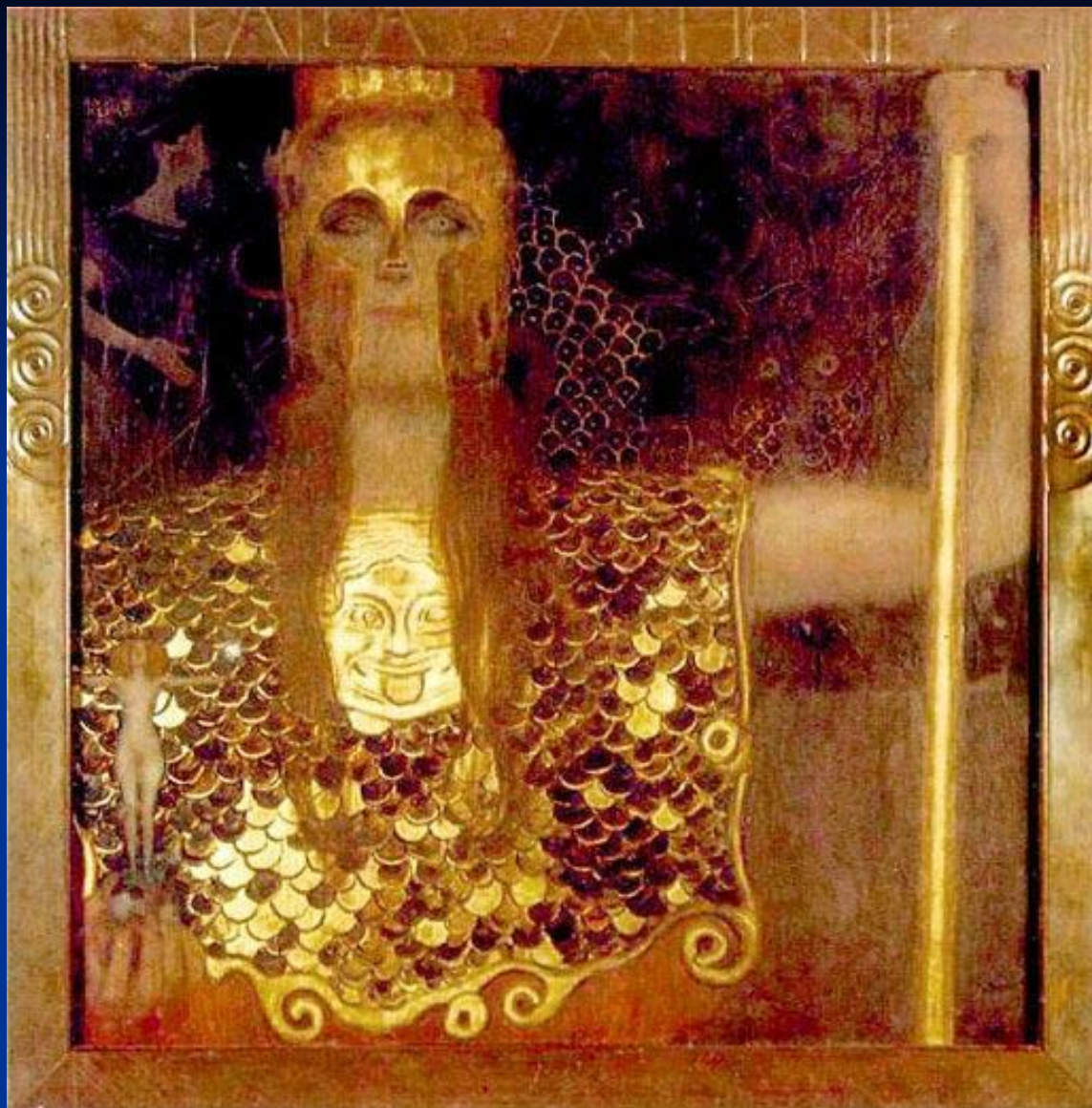
Г. Климт. «Афина Паллада».