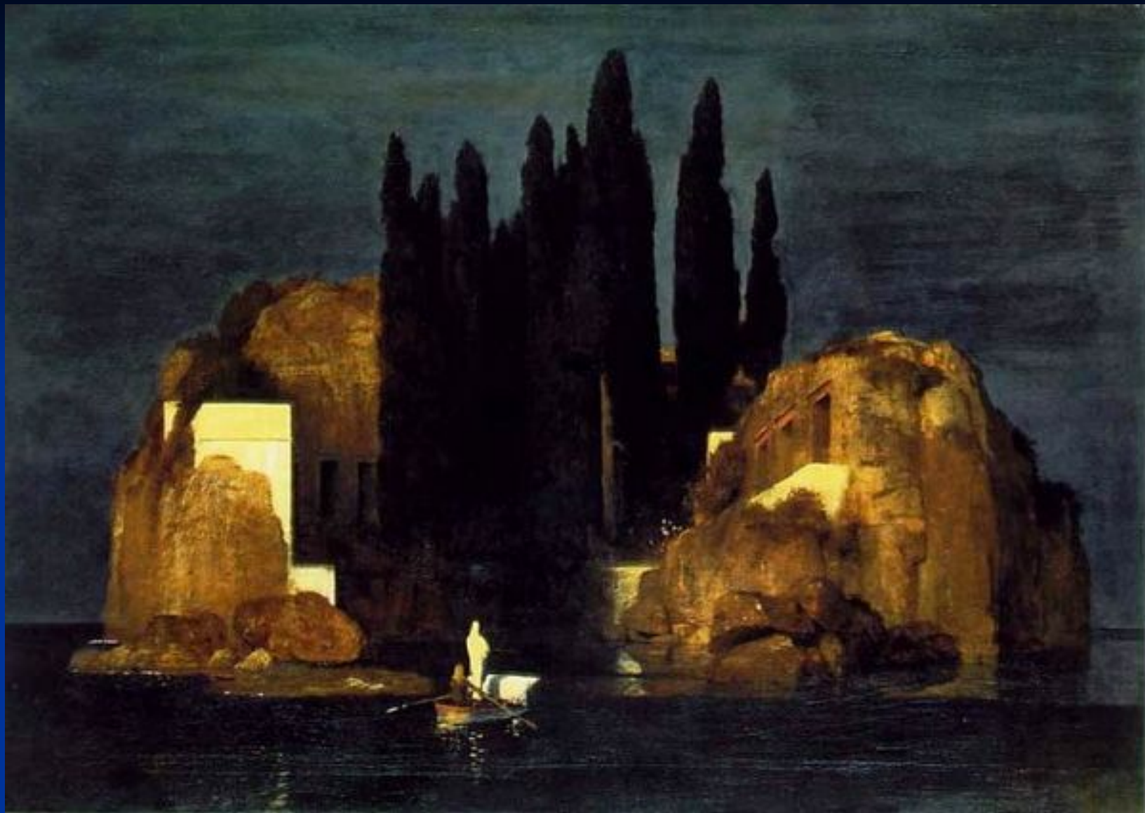
А. Бёклин. «Остров мёртвых».