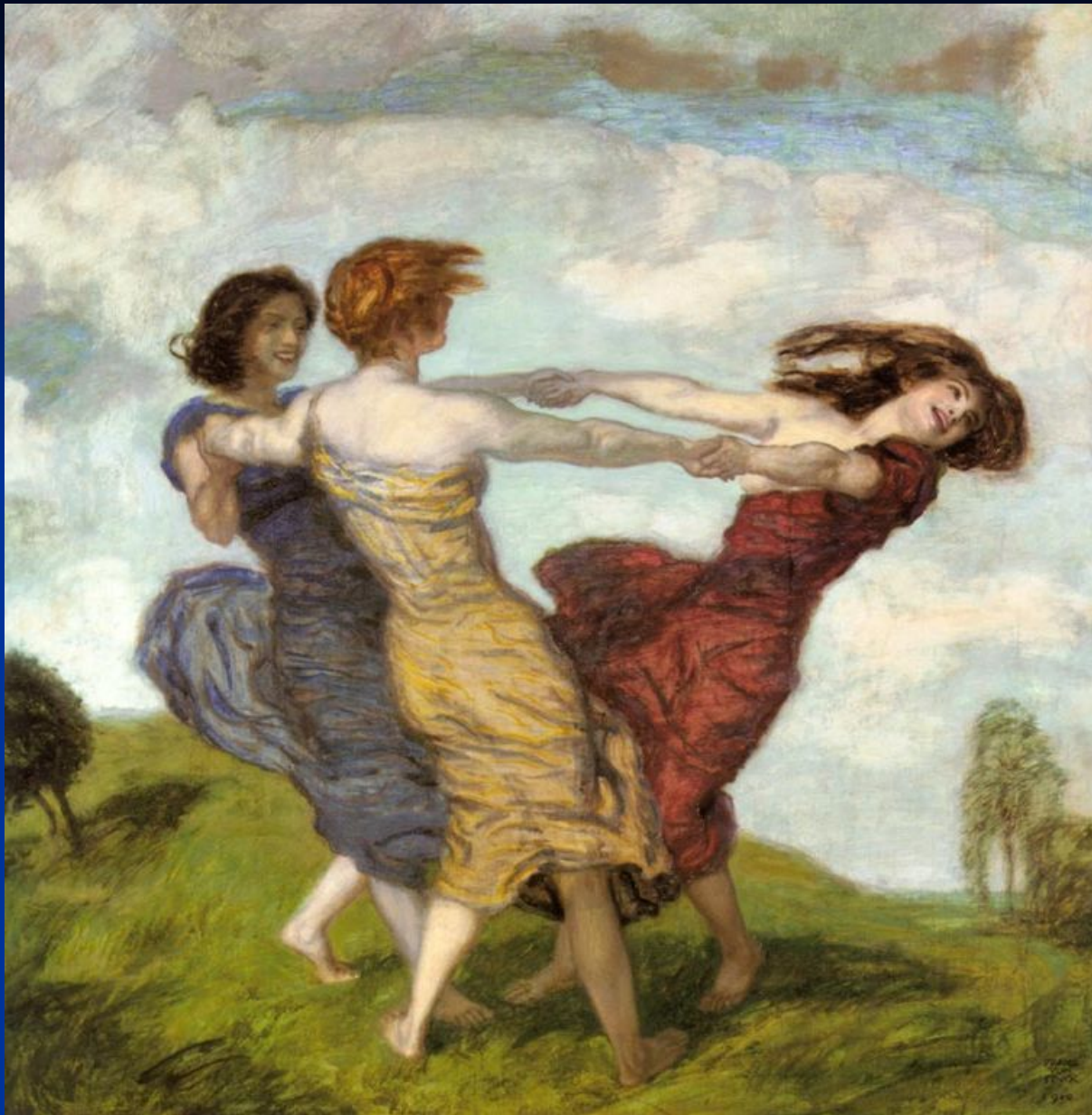
Ф. фон Штук. «Хоровод роз».