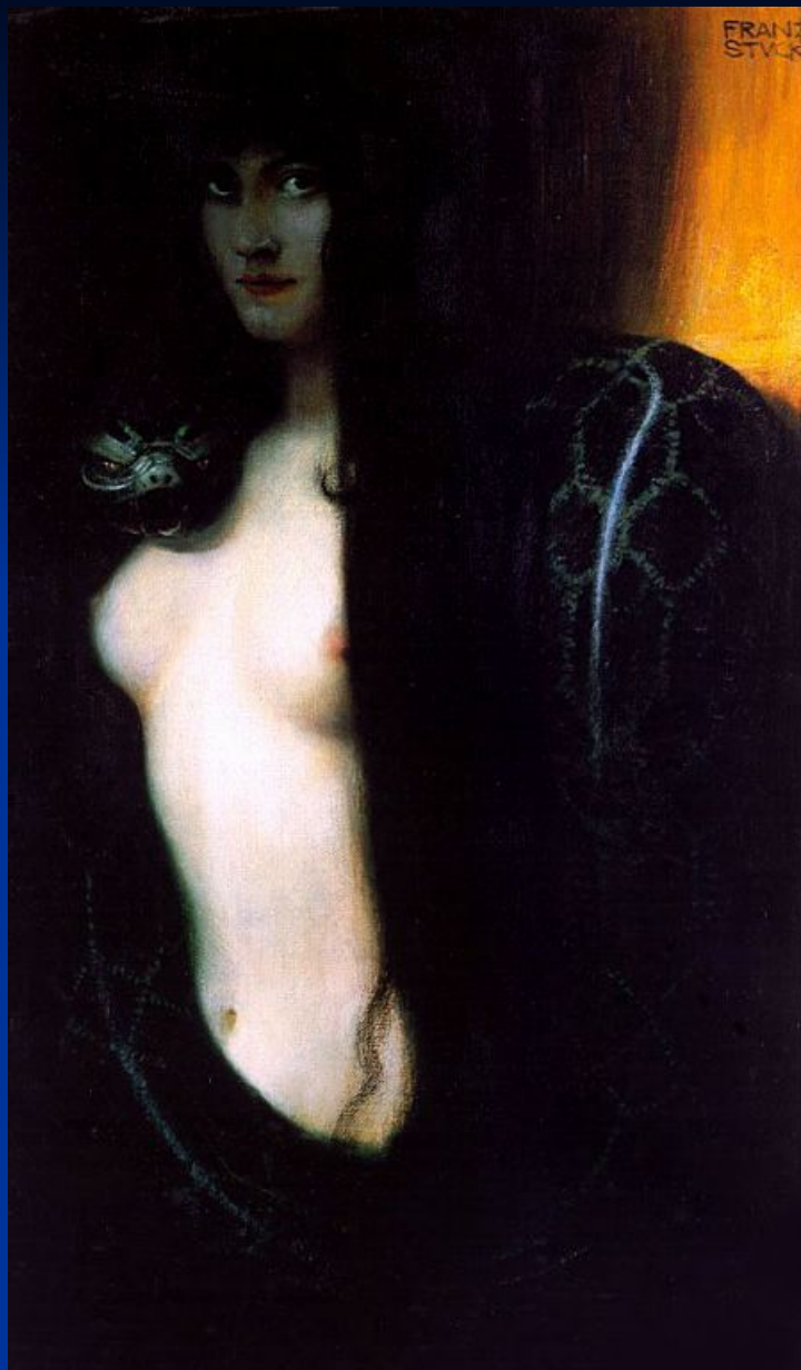
Ф. фон Штук. «Грех».