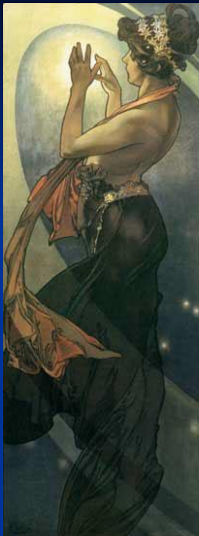
А. Муха. Из серии «Звёзды». «Северная звезда».