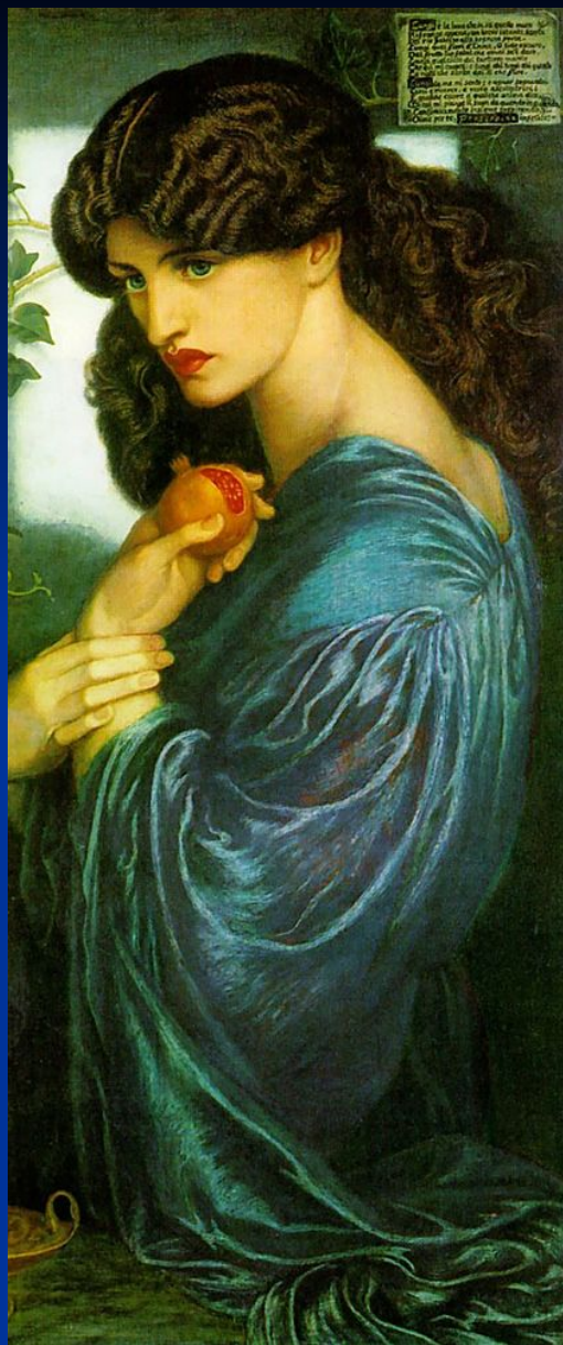
Д. Г. Россетти. «Прозерпина».