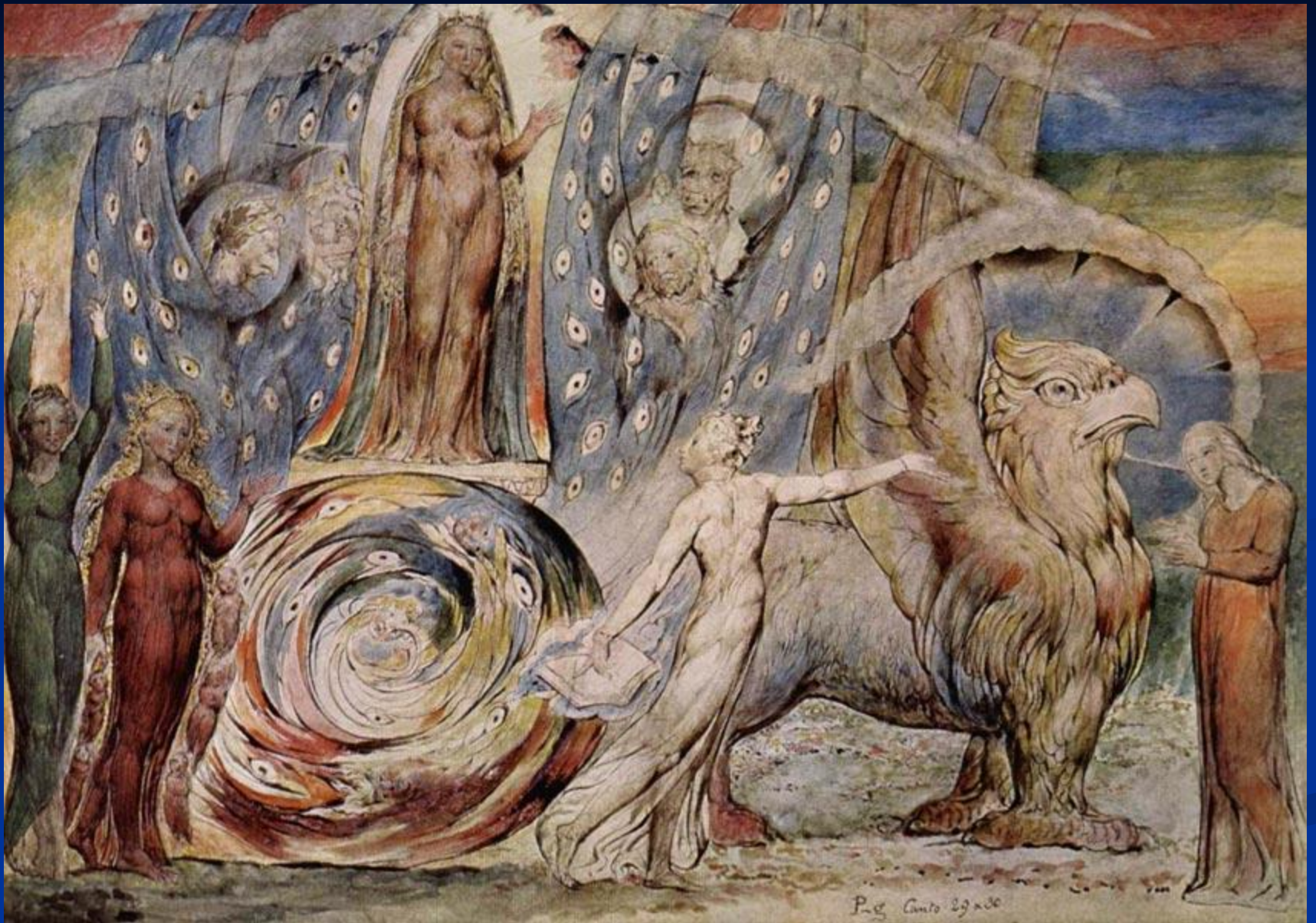
У. Блейк. «Беатриче и Данте».