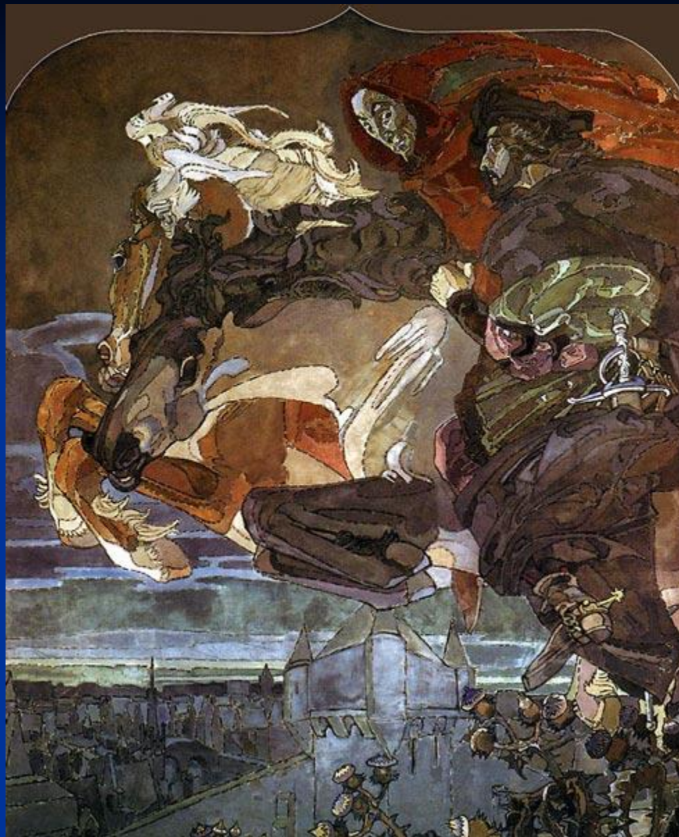
М. Врубель. «Полёт Фауста и Мефистофеля»ю