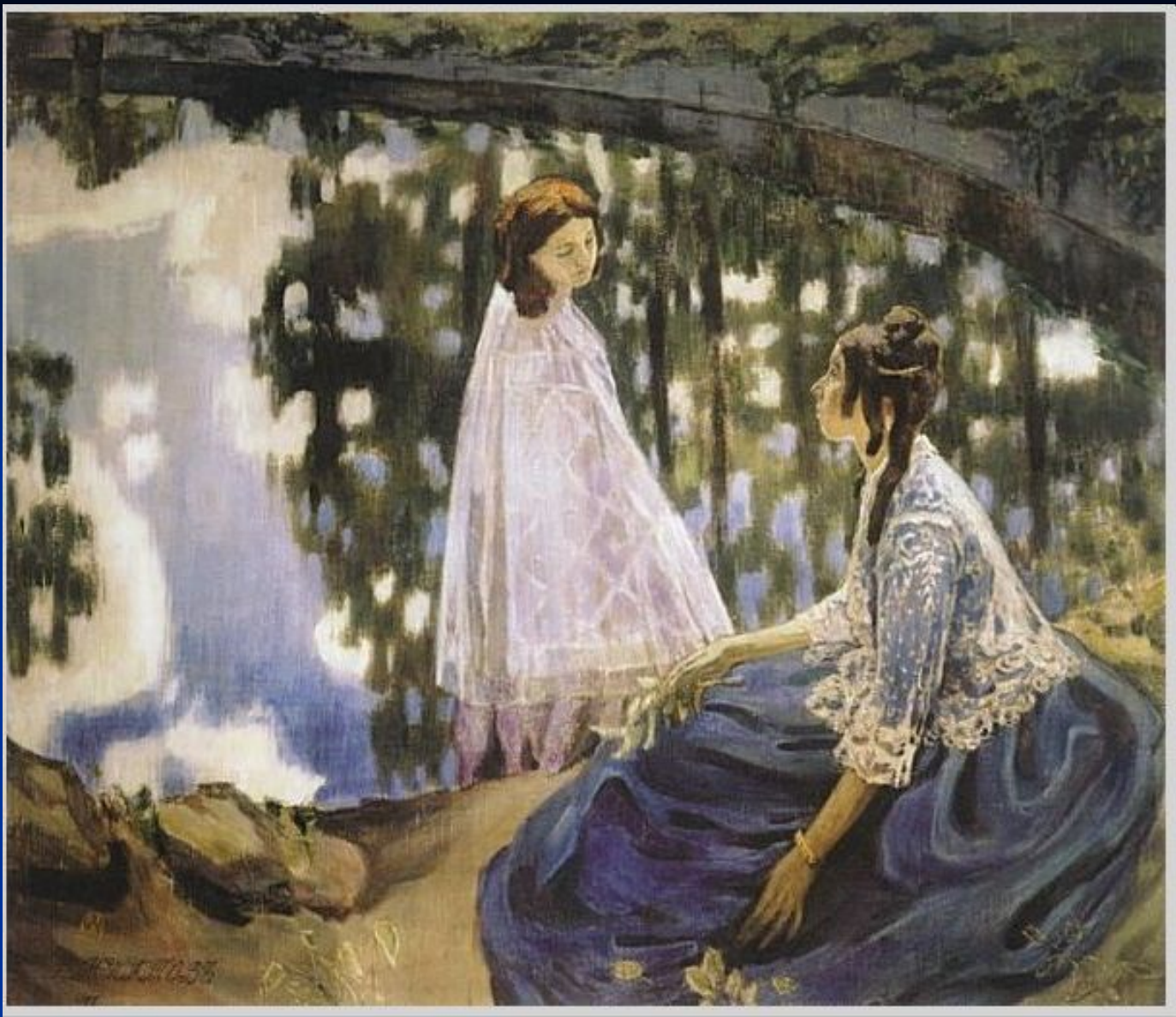
В. Борисов-Мусатов. «Водоём».