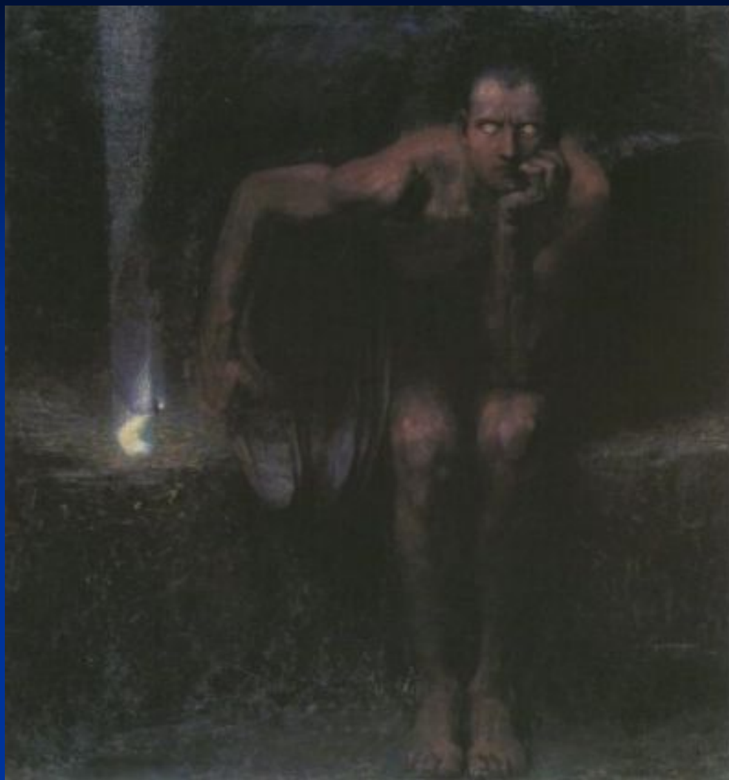
Ф. фон Штук. «Люцифер».