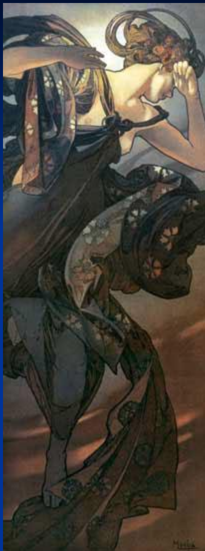
А. Муха. Из серии «Звёзды». «Вечерняя звезда».