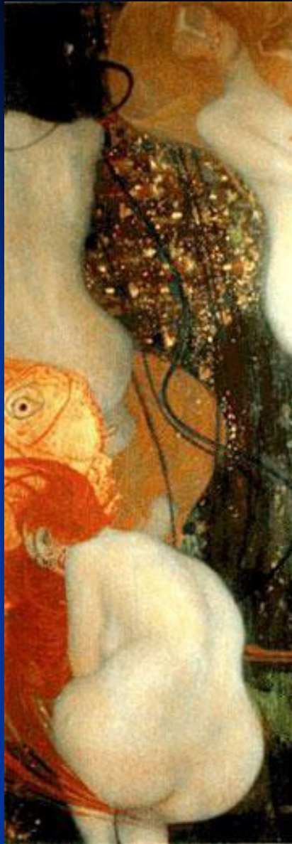
Г. Климт. «Золотые рыбки».