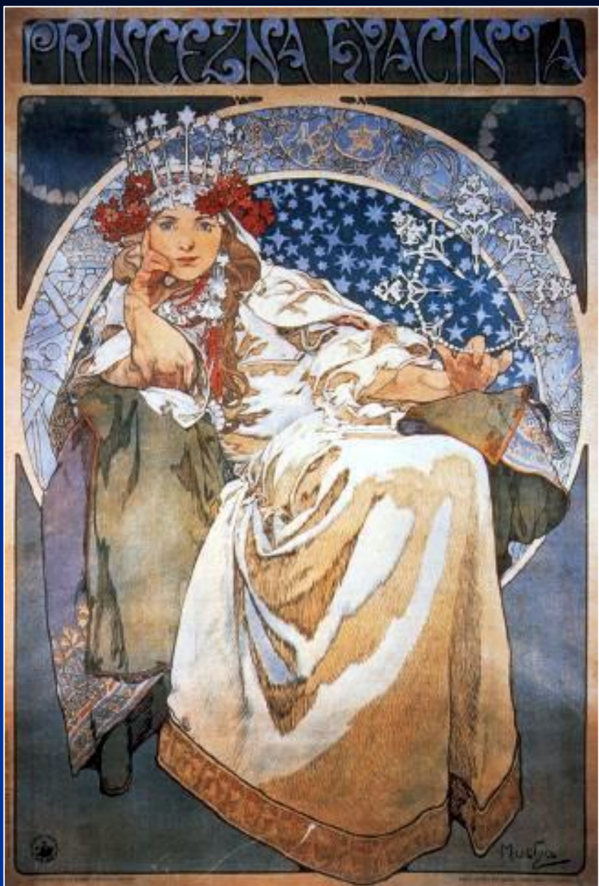
Альфонс Муха «Принцесса Гиацинт» 1911 г.