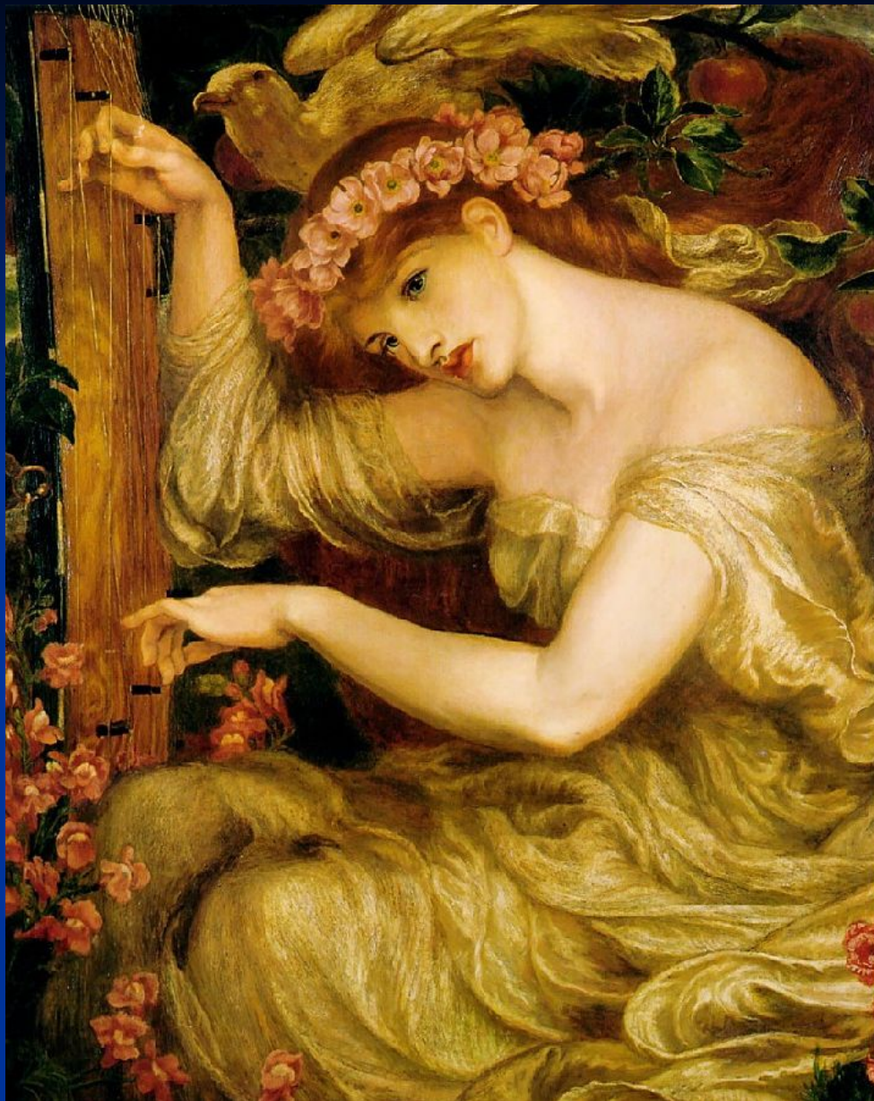
Д. Г. Россетти. «Морское заклинание».