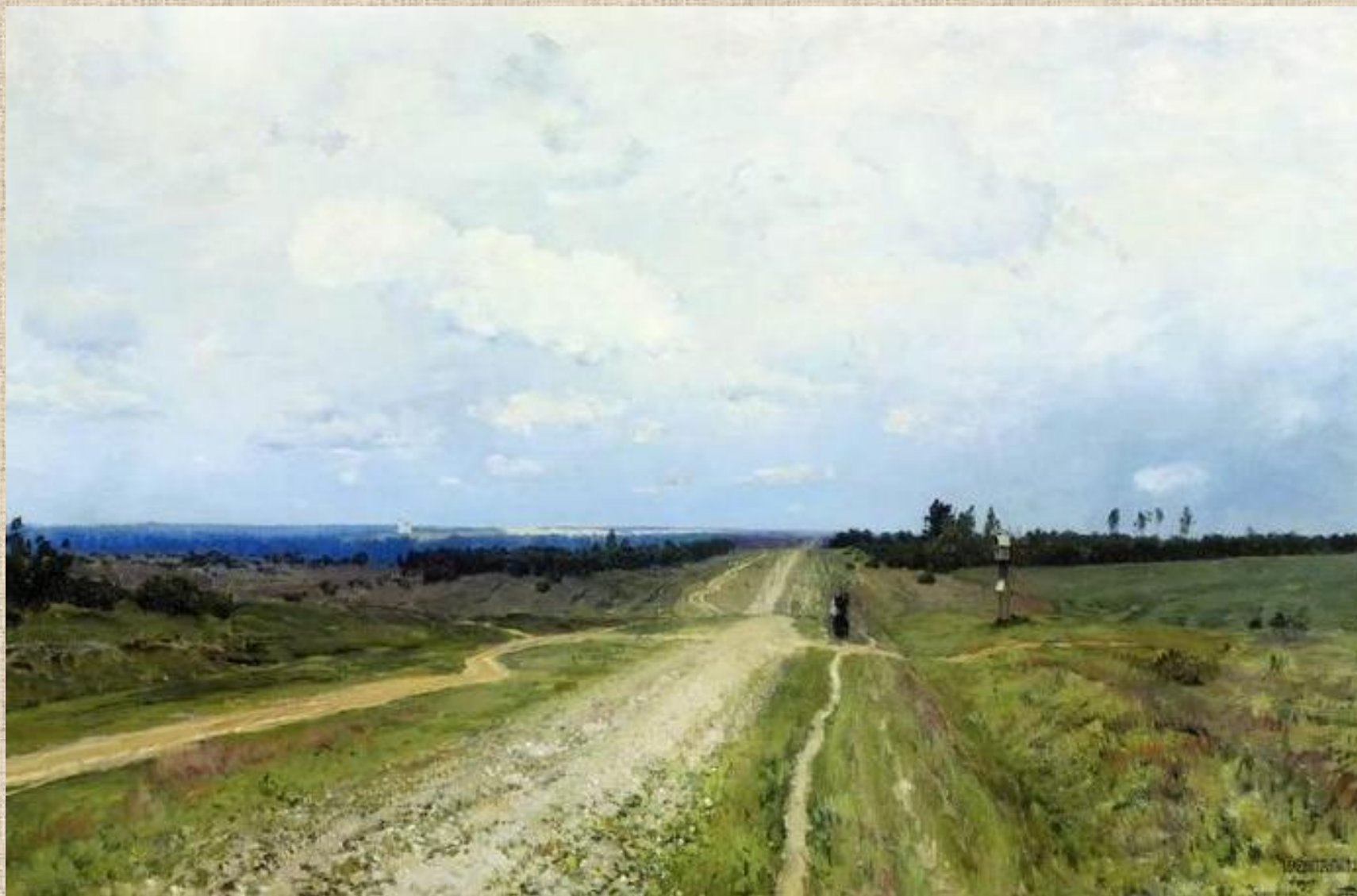
И Левитан. Владимирка, 1892