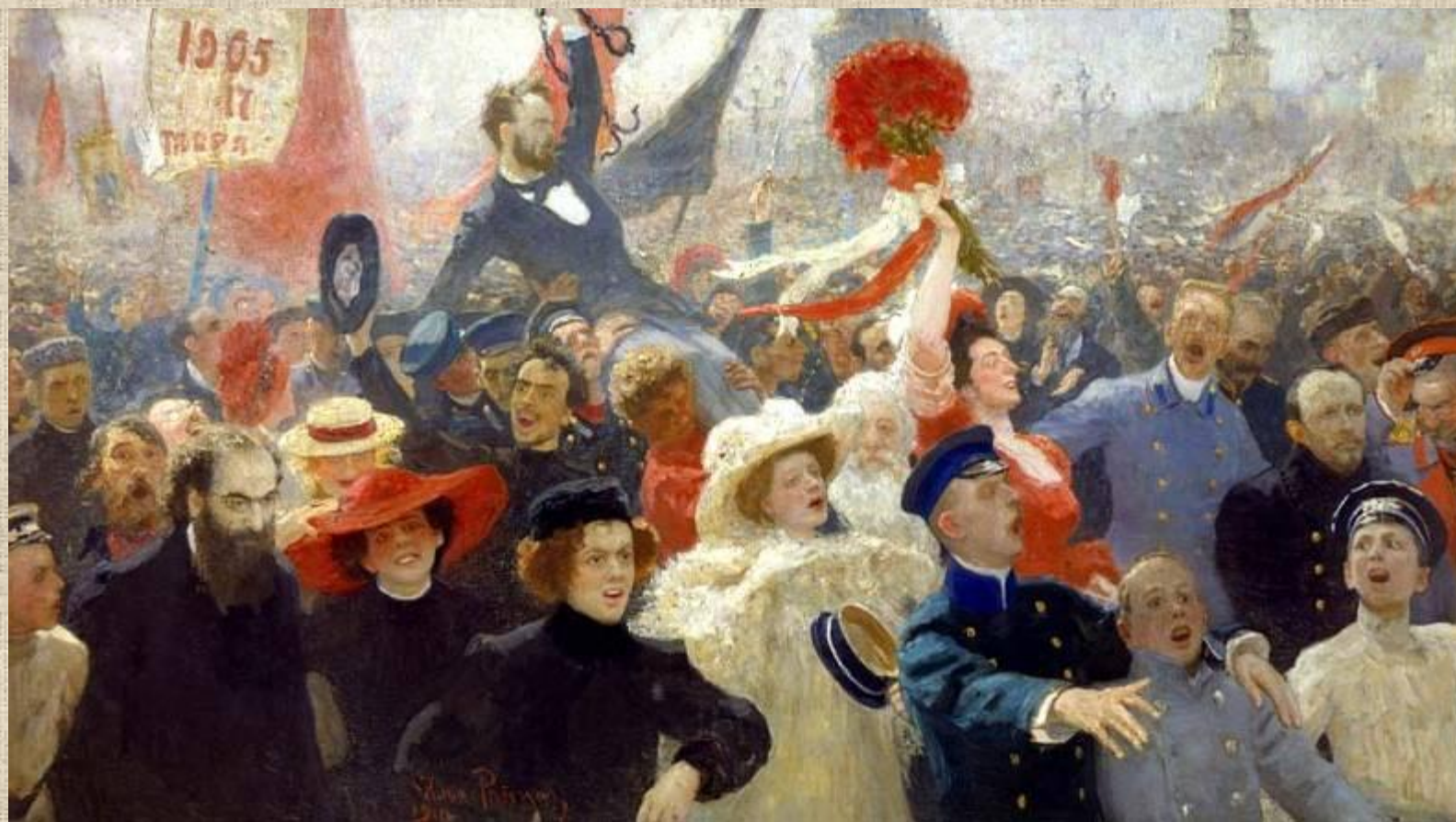
И.Репин. «17 октября 1905 года»