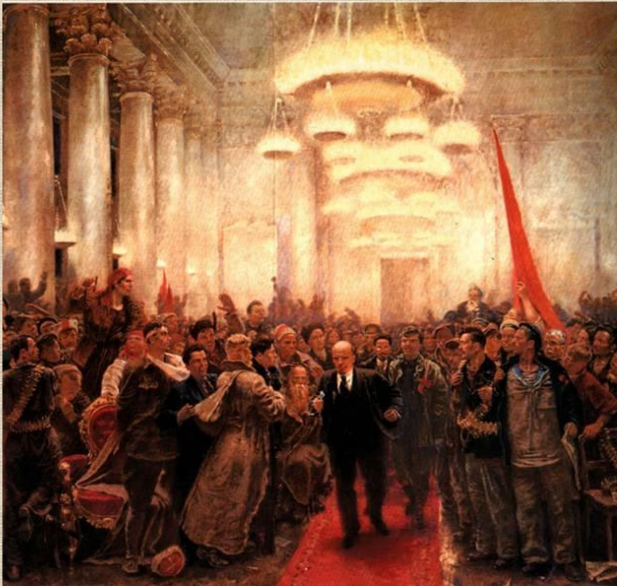
А. Самохвалов. Появление В.И. Ленина на II Всероссийском съезде Советов