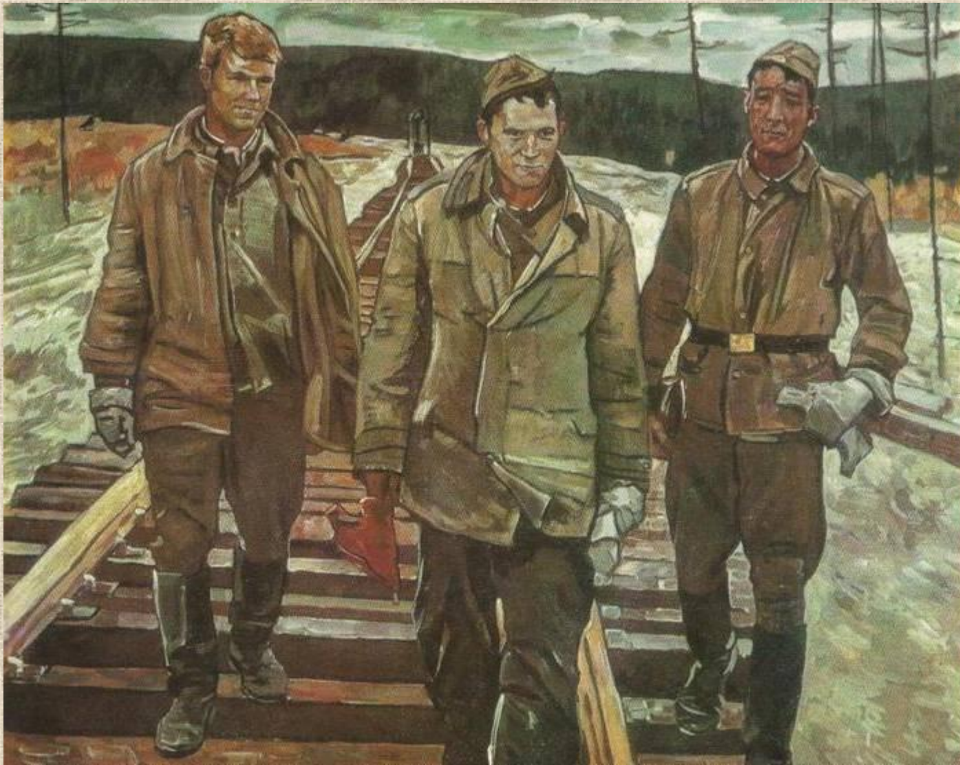
М.И.Самсонов. Утро БАМа.