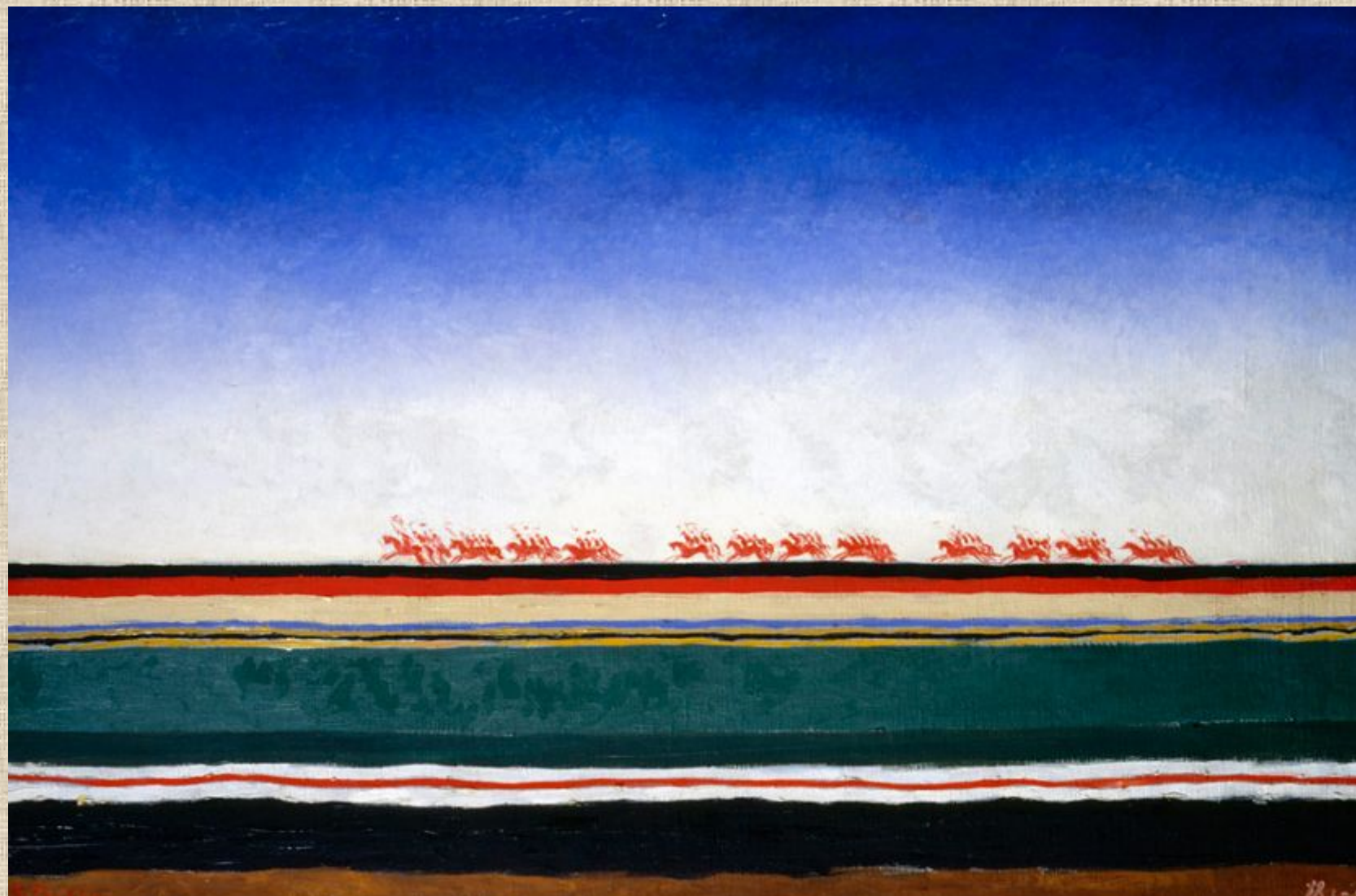
К. Малевич. Красная конница