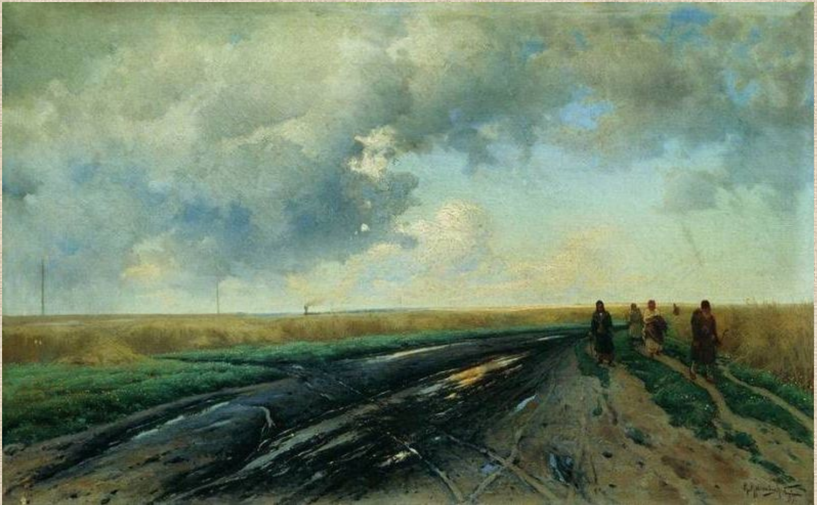
К. Крыжицкий. Дорога после дождя.