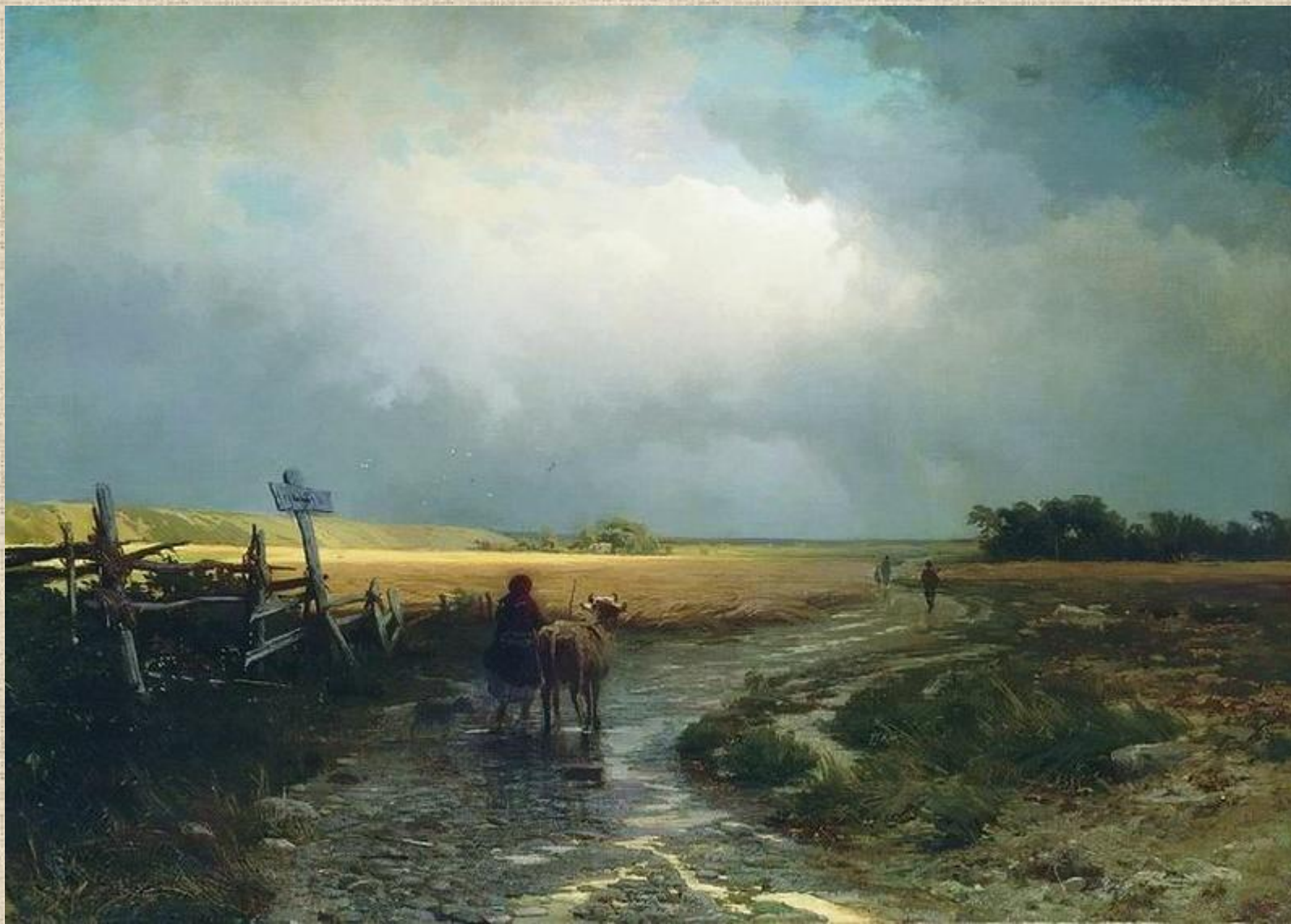
Васильев. После дождя. Просёлок. 1867-1869