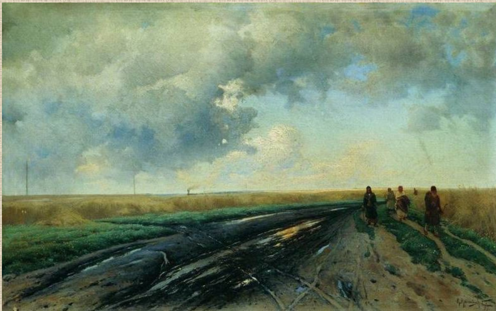
К. Крыжицкий. Дорога после дождя.