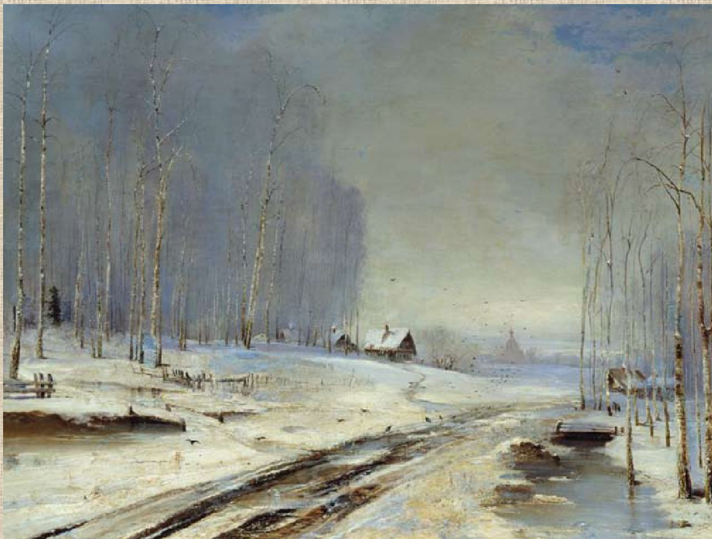
А. Саврасов. Распутица.