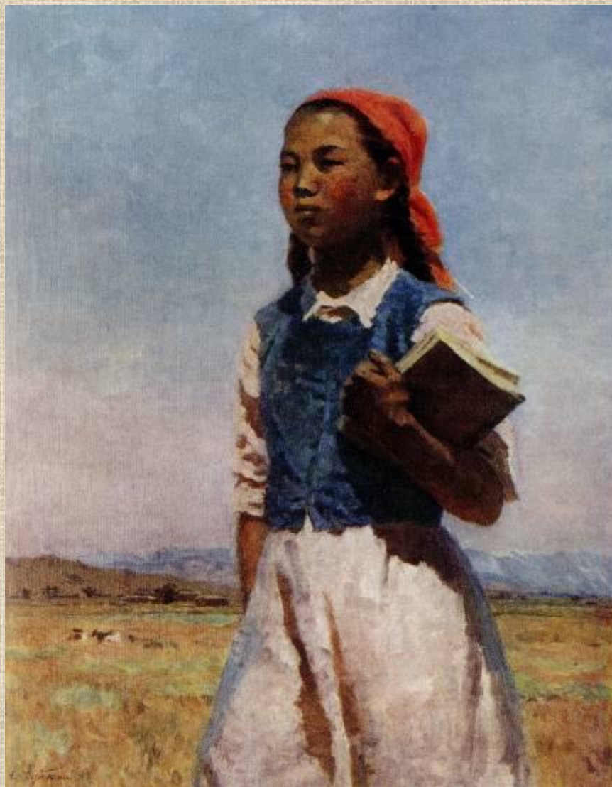
С.Чуйков. Дочь Советской Киргизии, 1948.