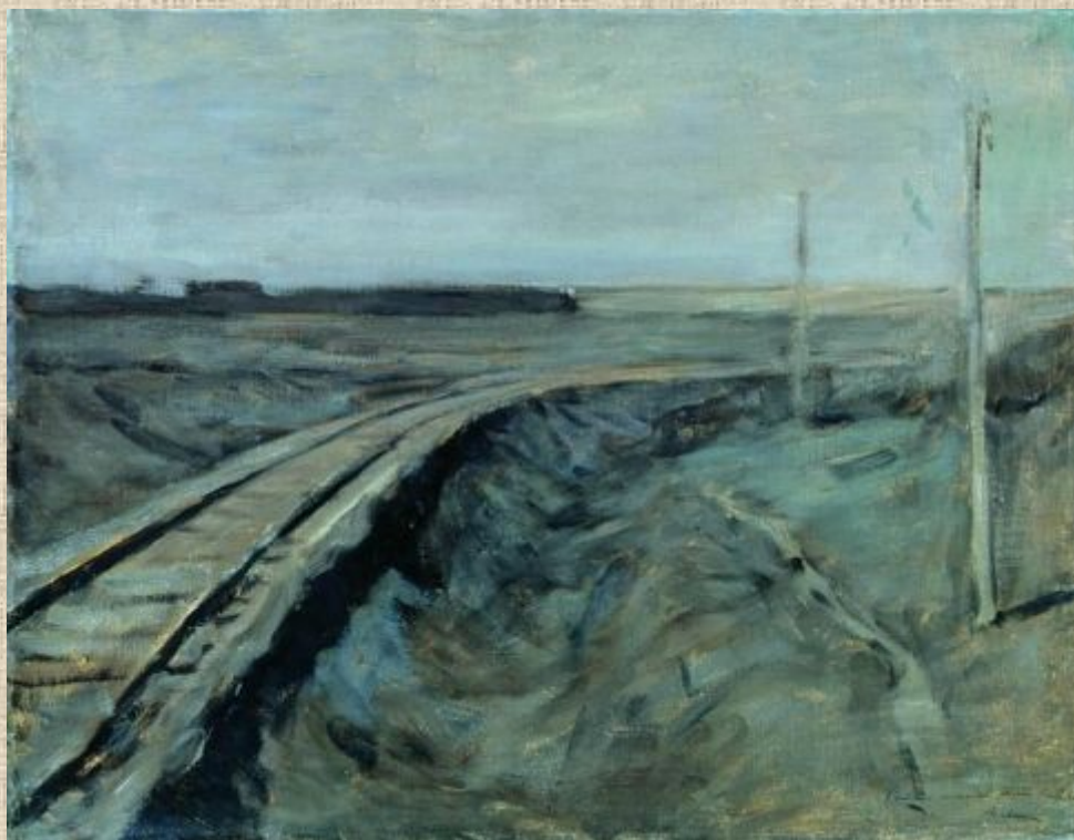
И. Левитан. Полотно железной дороги. 1898-1899,