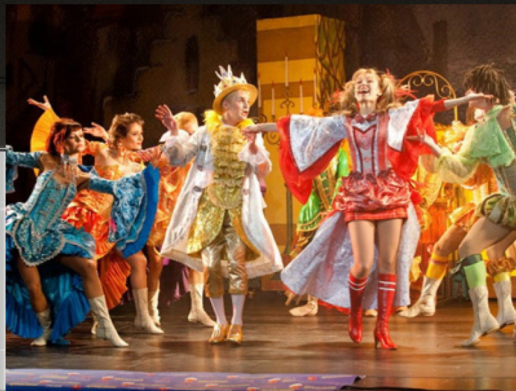
«Бременские музыканты» Г. Гладков

Многие мюзиклы и рок-оперы обрели свою вторую жизнь в кино и получили высокие кинематографические награды.