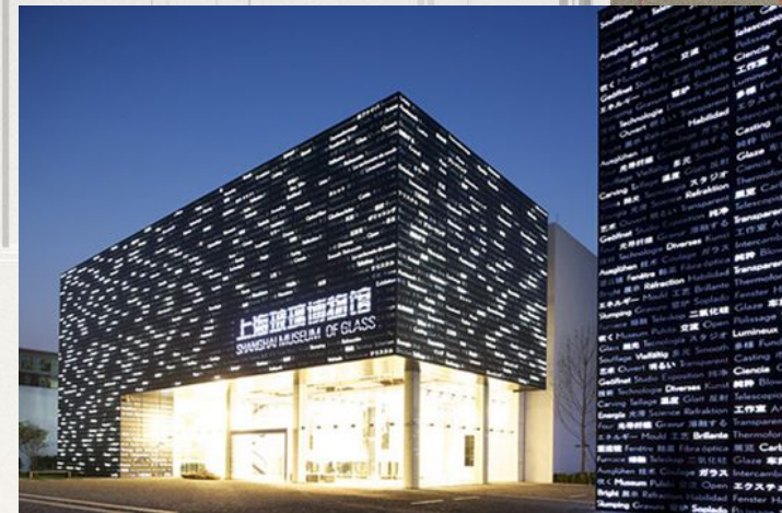
Музей стекла в Китае