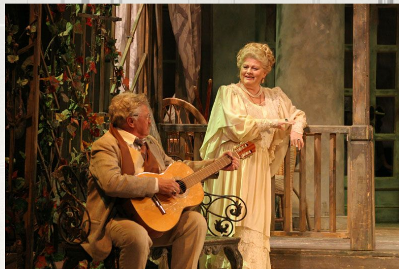
Сцена из спектакля в Малом театре