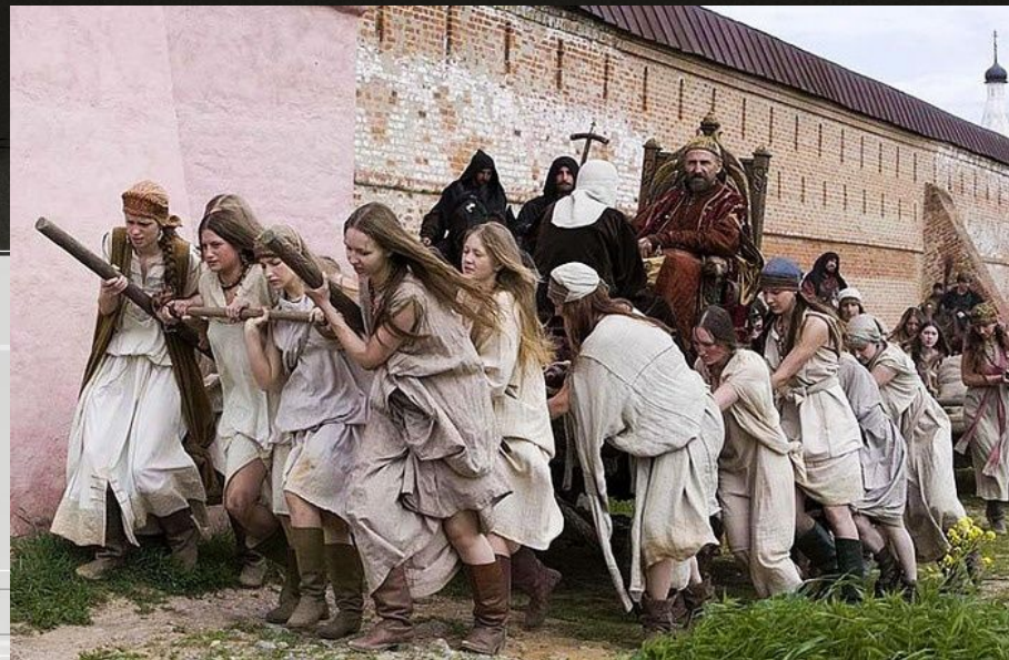
Сцена из фильма «Царь»

Эмоциональное переживание происходящих на сцене коллизий во много раз усиливается музыкой.