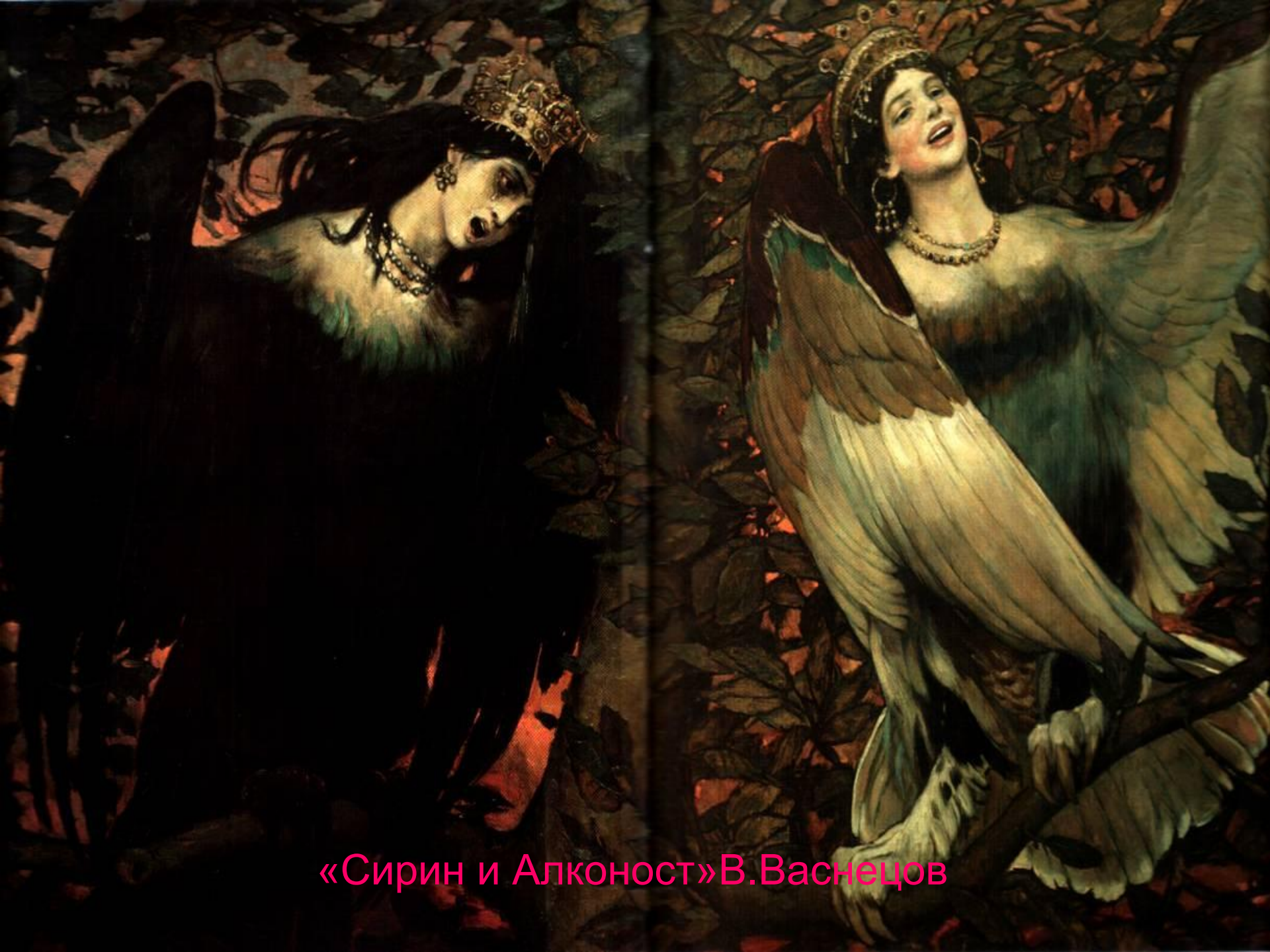
«Сирин и Алконост» В. Васнецов