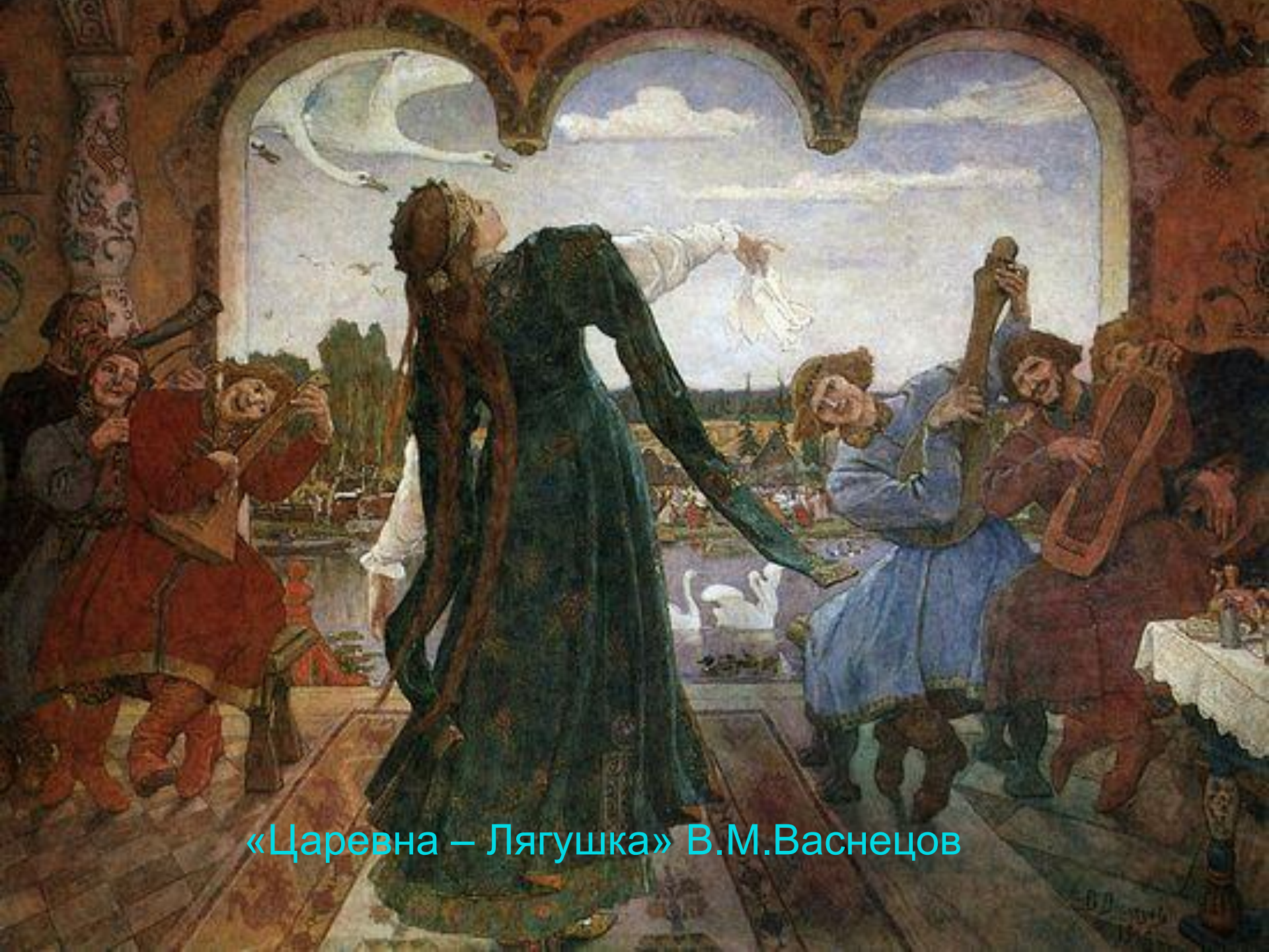
«Царевна – Лягушка» В.М.Васнецов