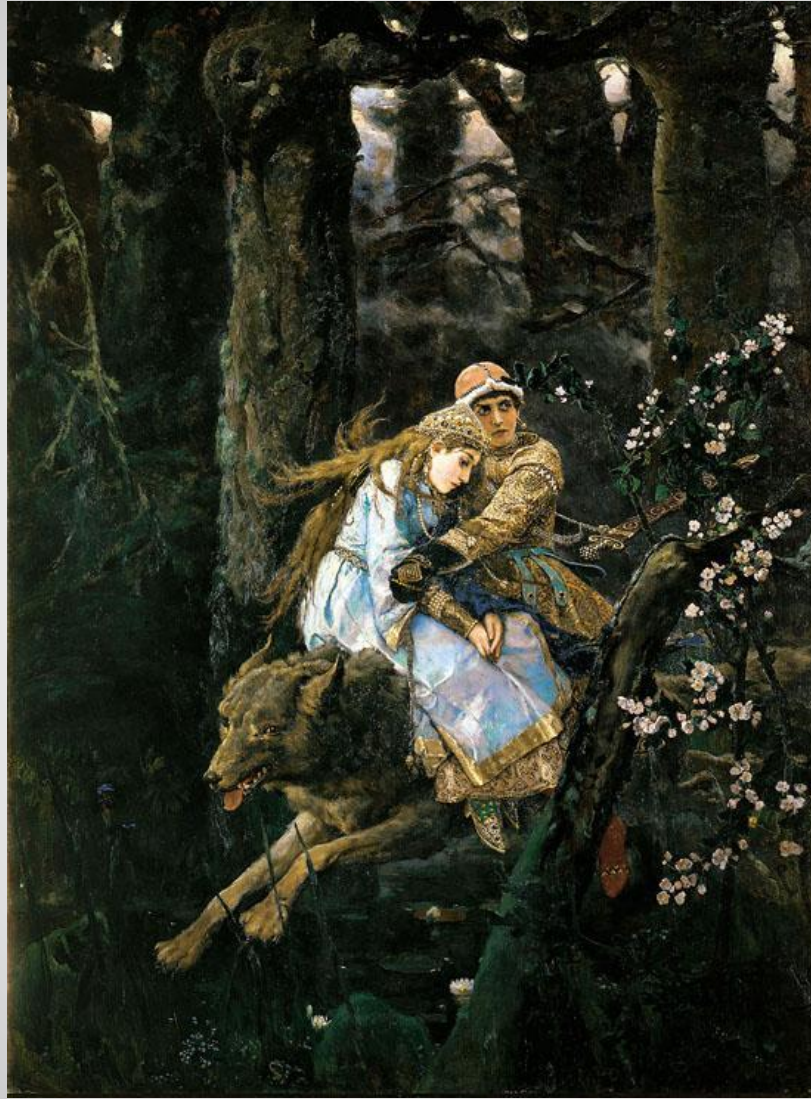
Иван-Царевич на Сером Волке