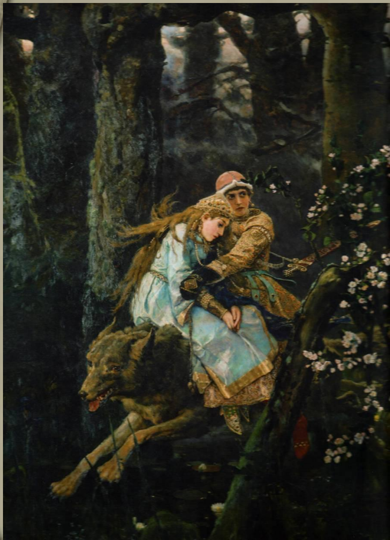
«Иван-царевич на сером волке» В.Васнецов