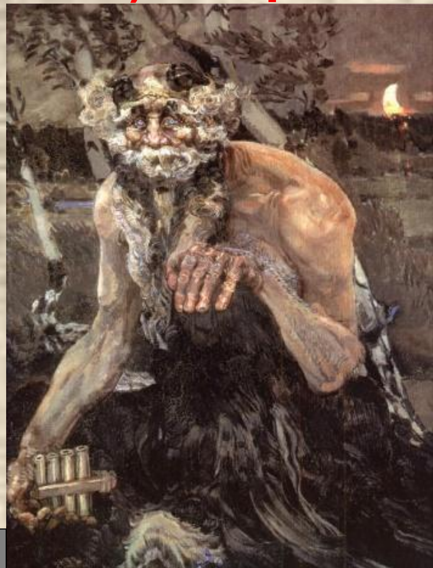
М. Врубель Пан.