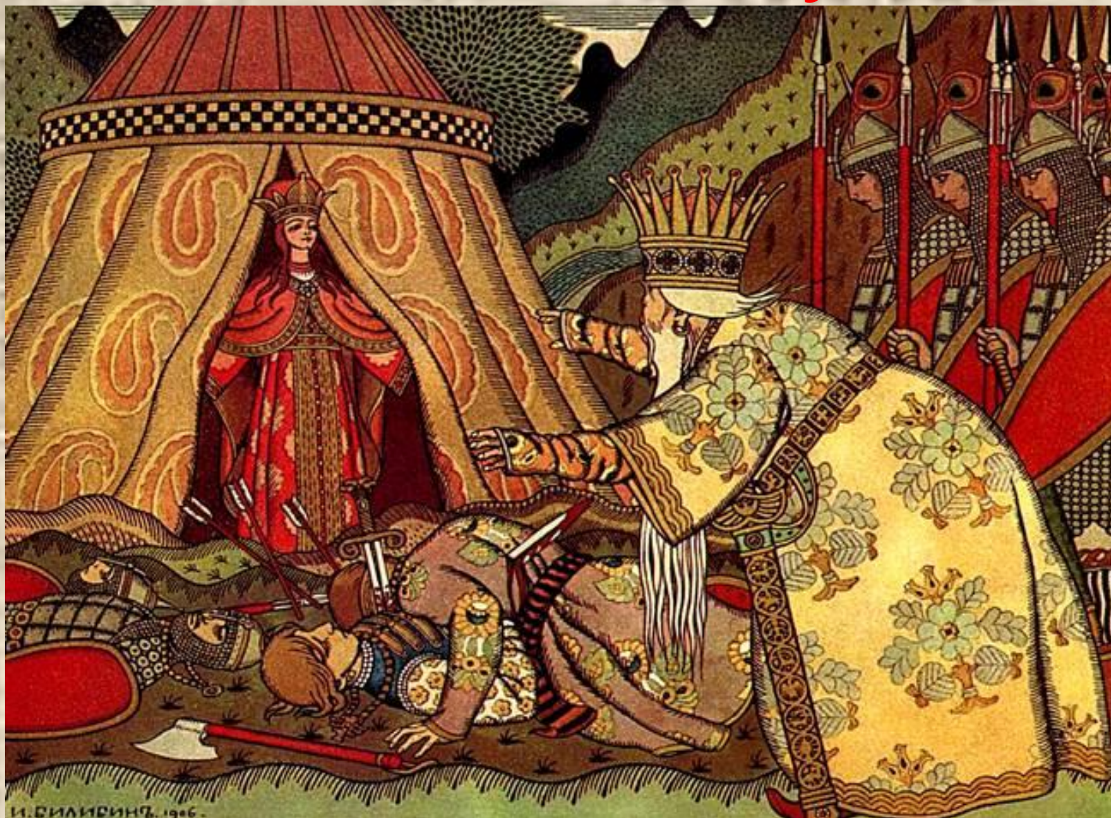
Иллюстрация к «Сказке о золотом петушке»