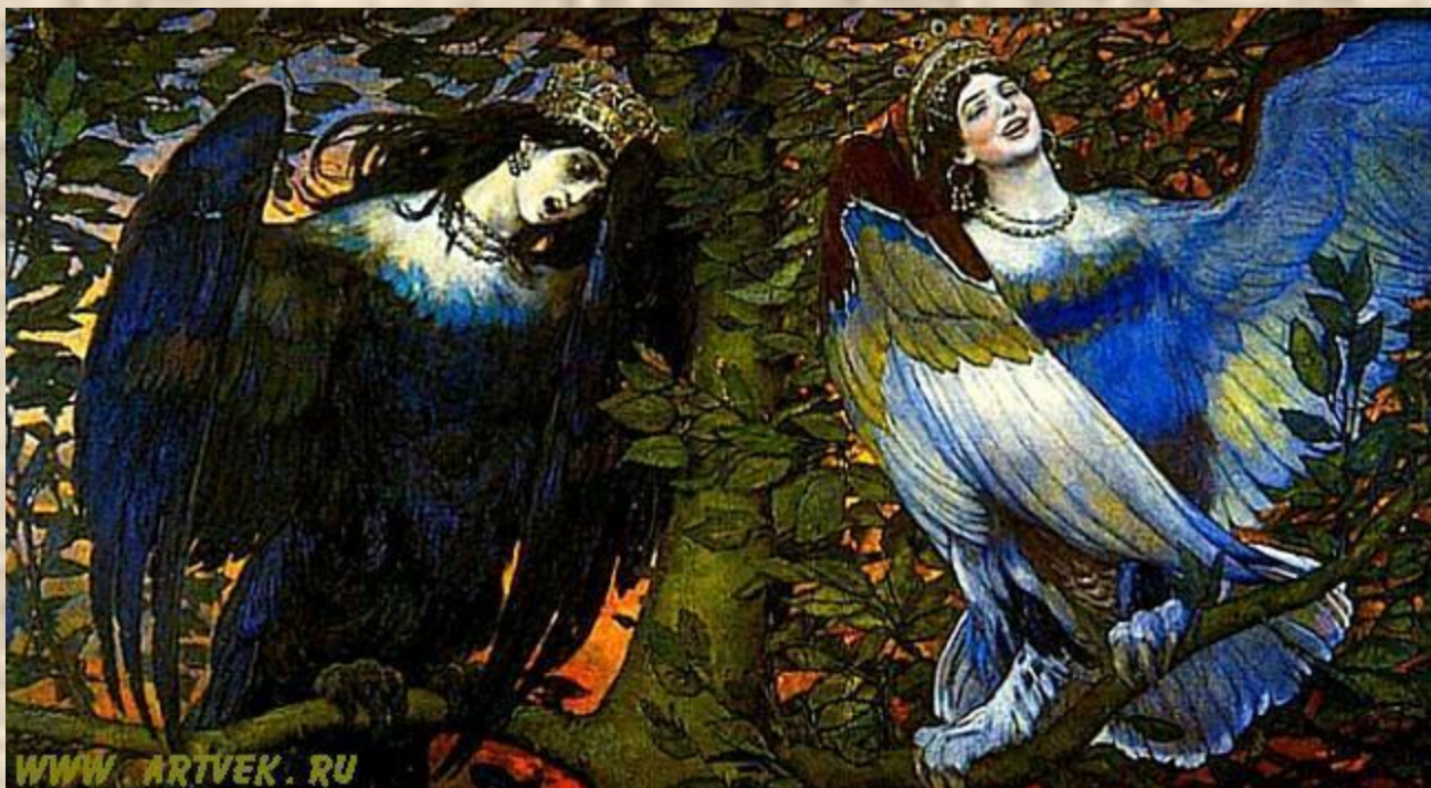
В. М. Васнецов. Птицы печали и радости