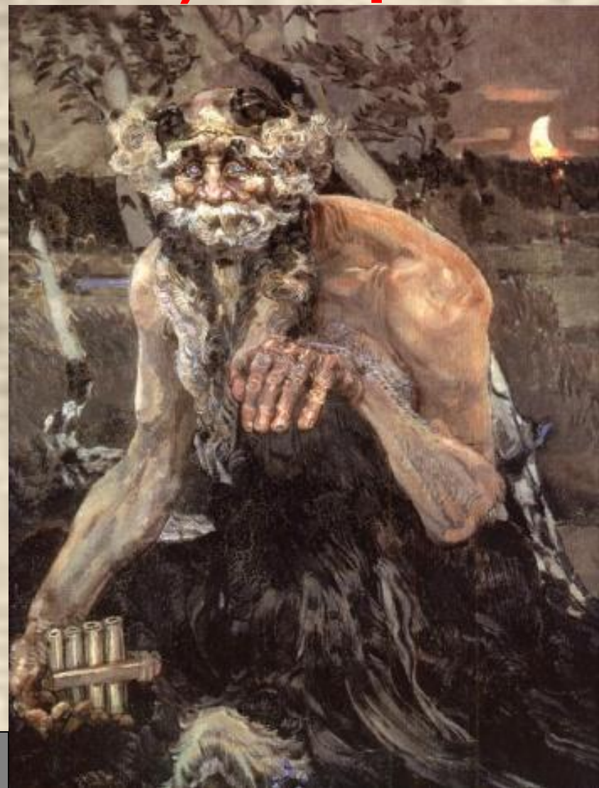
М. Врубель Пан.