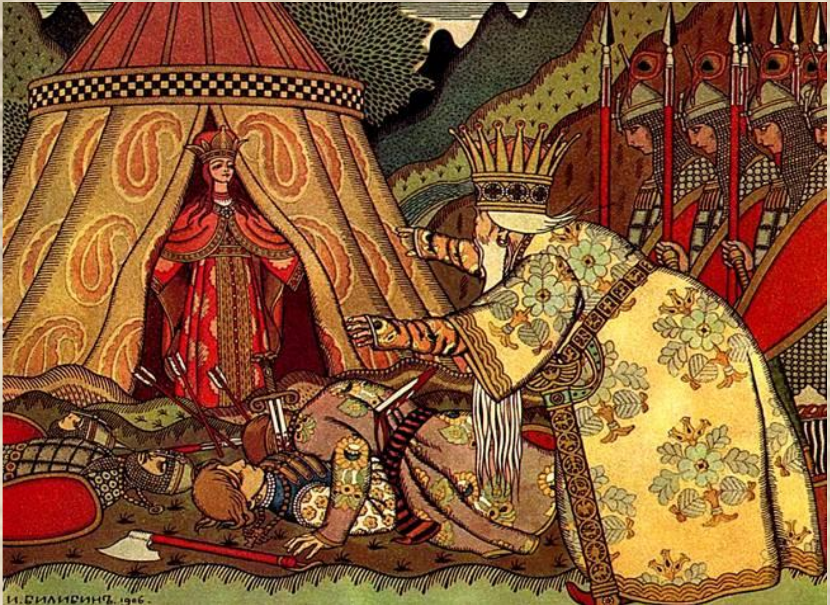
Иллюстрация к «Сказке о золотом петушке»