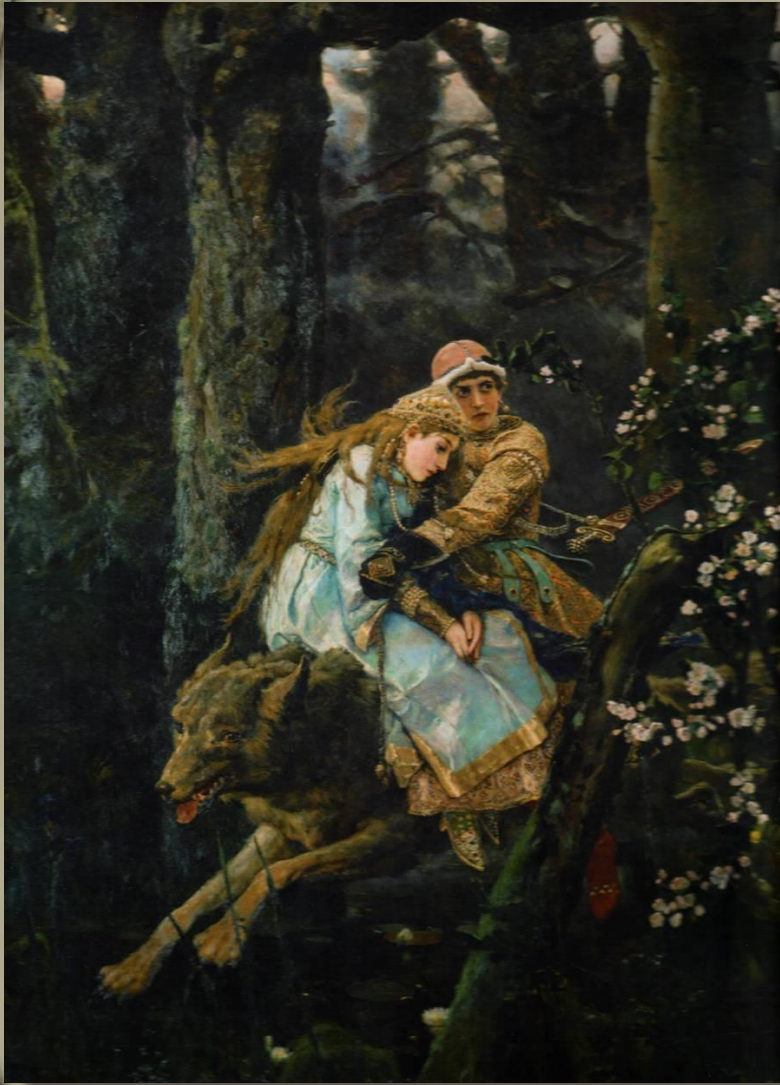
«Иван-царевич на сером волке» В.Васнецов