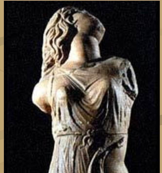
Менада. 4 в. до н.э.