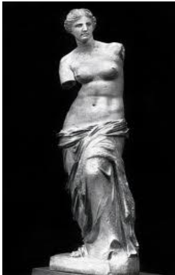
статуя работы Агесандра «АФРОДИТА МИЛОССКАЯ» (II в. до н.э.)